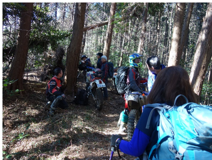
成年オフロードバイク軍団に会う