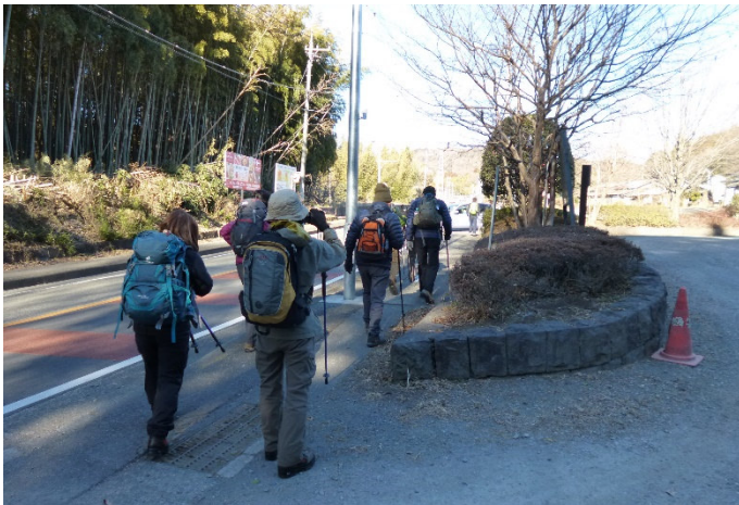
上三増バス停（終点）を出発