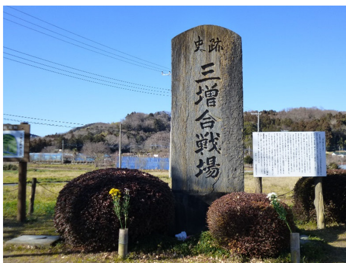
三増合戦場跡地 三増バス停に着き、下山終了