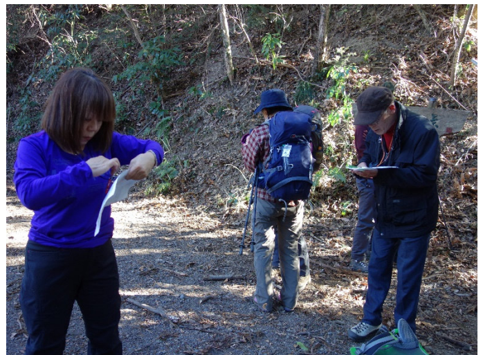
コンパス使用法と読図の勉強会