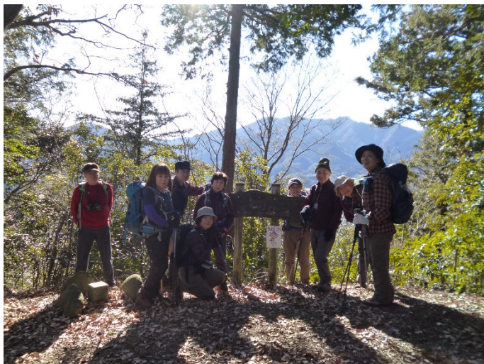
富士居山山頂 仏果山をバックに