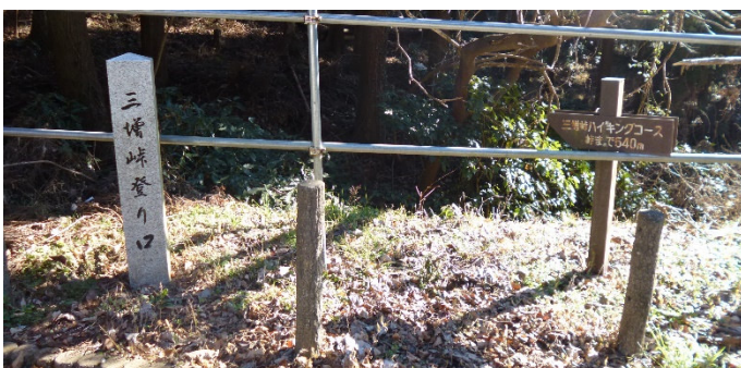
三増峠登り口（トンネルの手前から右に入る）