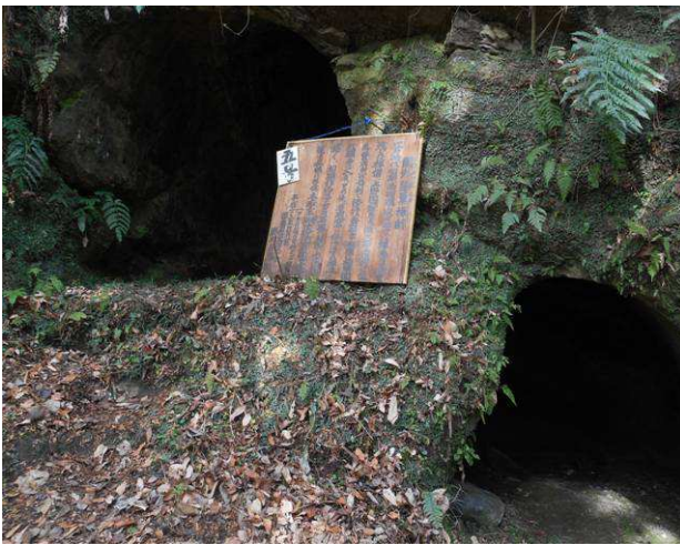
横穴は数個ありました奥行は約2m位で 人が一人で座禅をする場所見たいです。