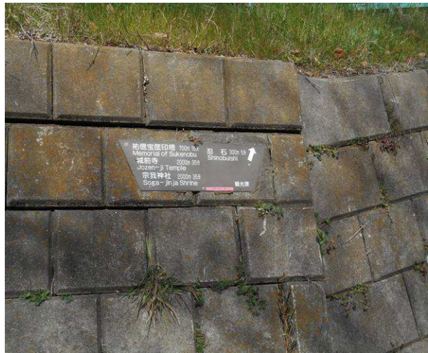
六本松跡です今回のコースは左ですが車道になるので、右の忍石方面に行き農家の作業場所で昼食タイムを