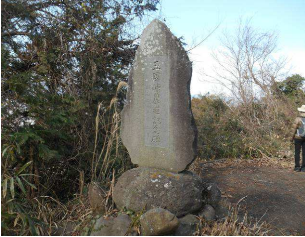
五国峠碑 立てられたのは 昭和27年3月 これは、私の誕生月でした