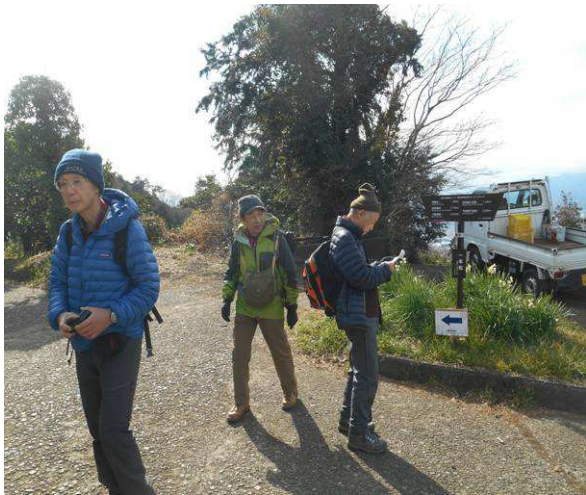
一本松跡 標識のみ