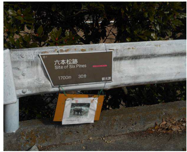
林道ですが、猪が出てくるようです