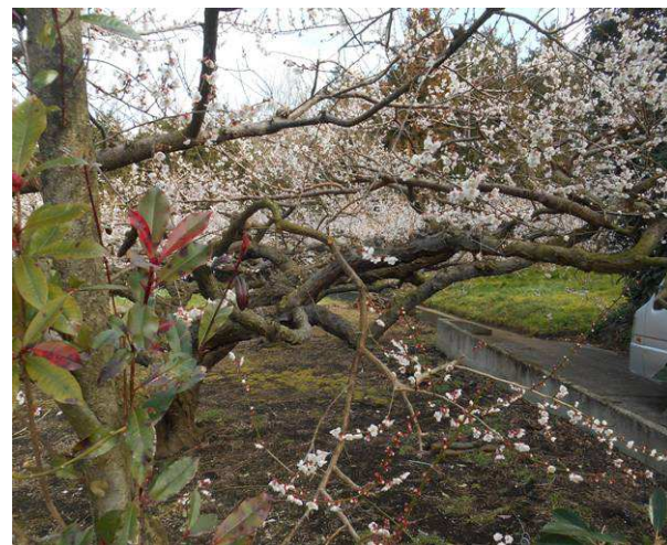
手入れがされた梅林で花が綺麗です