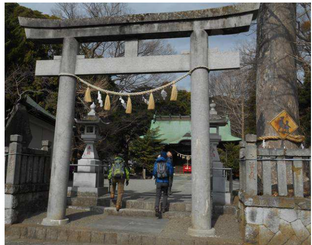
宗我神社 鳥居右側に大きな御神木