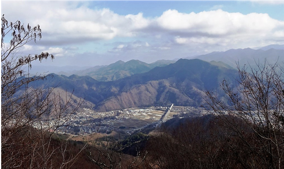
展望が広がった 九鬼山方面