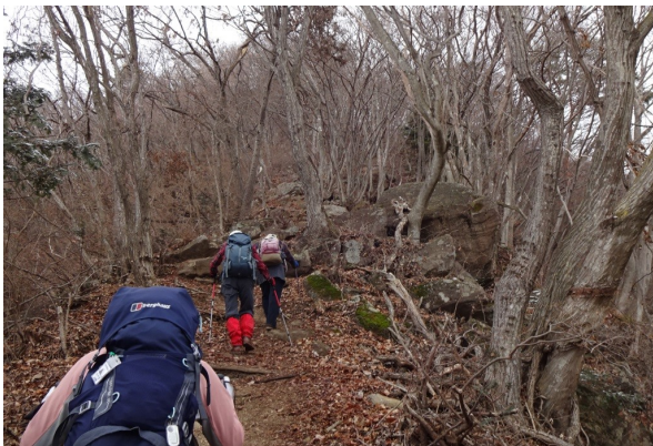
大月駅から登ってきた尾根が見えている