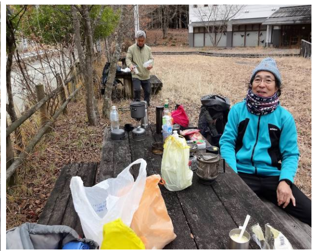
玄倉に11時15分に到着した バスが10時16分で次が15時16分のつもりでいたら 11時21分のバスがあったが、気が付かない為、バスに乗り遅れた 近くにベンチがあったので ゆっくりと昼食タイムを、取った 11時21分のバスは休日ダイヤでした！！