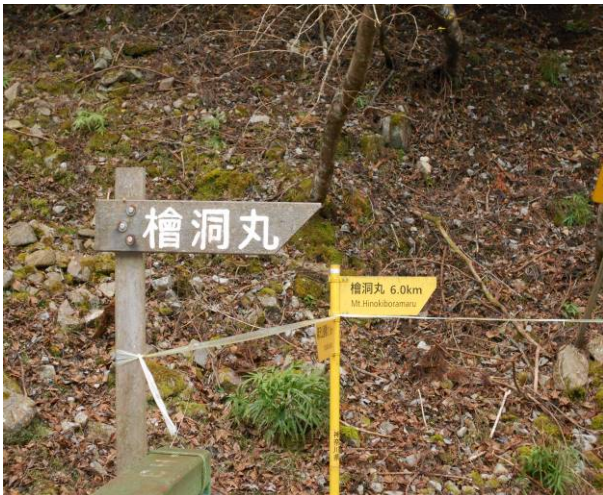
箒沢公園橋バス停よりここから檜洞丸までは6.1km

昨年行った青ヶ岳山荘に泊まるのが、目的で今回の山行を行った、コースを石棚山経由で行き、翌日は犬越-路經由-大室山-白石峠-西丹沢ビジネスセンターの計画でしたが、翌日が雨予報の為、コース変更を県民の森経由玄倉にした、山荘では、常連さんたちの、鍋パーティーにぶつかり、楽しい時間を過ごす事ができた、この山荘は小さな小屋ですが、居心地の良い場所です、ザックを置く場所もあり、寒い時期には、掘りこたつもあり、ゆっくりと、一杯やりながら、時間を過ごせます、檜洞丸へのコースは、つつじ新道より急な登りを晶文社地図では、約3時間のコースの為、この小屋に行くのは大変ですが、小屋で過ごす時間が好きです、来年もコースを変えて行く予定