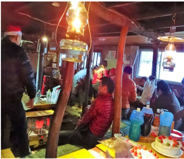
小屋の中に常連さんが10数名来ていた 素泊まりで、鍋、ケーキを作り パーティーを行う様です