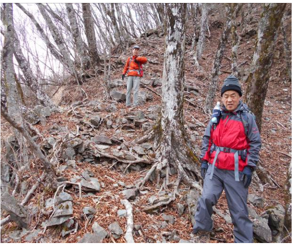
途中でざれた細尾根で下りでは特に注意