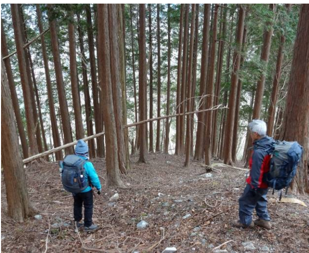
途中用人口林となるこの場所でルートは左側に曲がる、正面に行きそうになるので下りは注意