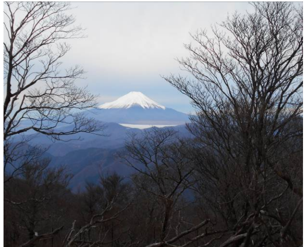
檜洞丸か見た富士山 その奥に南アルプスが見渡せた