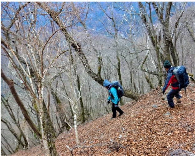
県民の森へのルート急な下りが続く