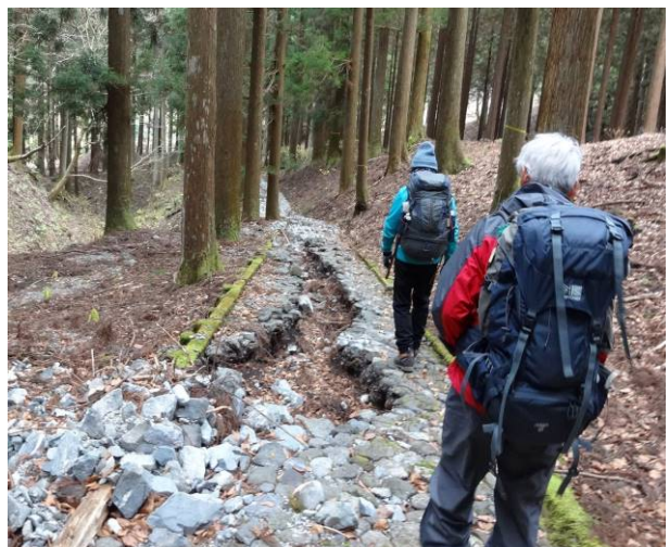
県民の森の中台風の影響で道が削られている