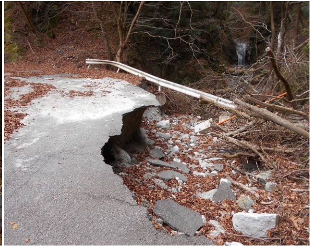
台風の影響で道路が崩落 現在林道は 車両通行止め