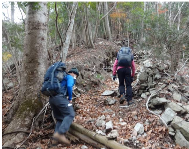
最初は沢沿いの道ですが途中からは板小屋沢ノ頭までは急な登りになる