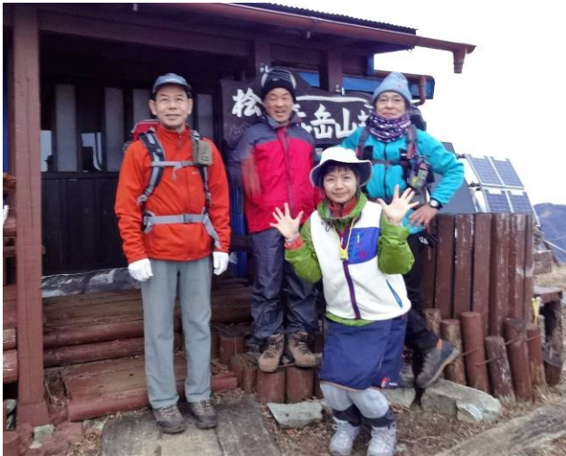
出発時小屋のオーナーと記念写真