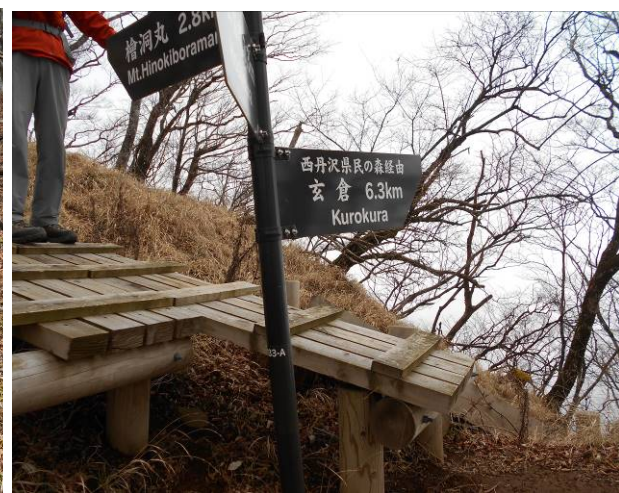
ここは県民の森への分岐点 ここコースは晶文社地図では点線です