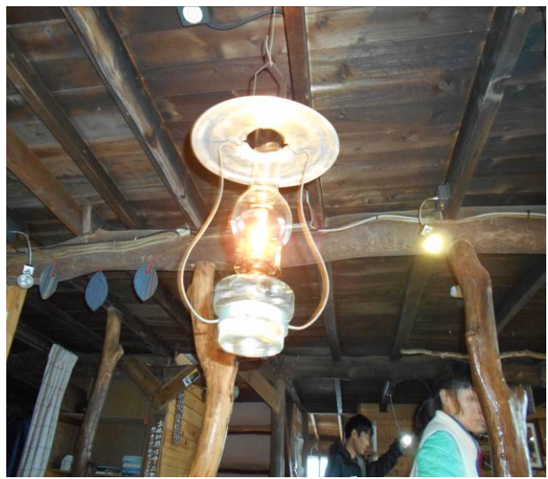
小さな小屋なので、ランプで明かりを 併用でLEDライトもあります