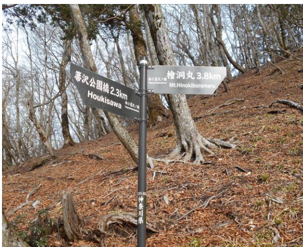
板小屋沢ノ頭 ここまで約2時間弱掛かった