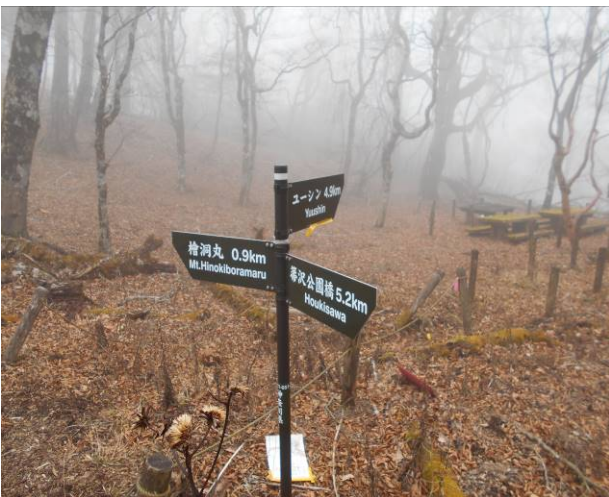
ユーシンから来る 同角山稜の分岐 現在ユーシンまでの林道が閉鎖の為 このルートの使用も出来ない