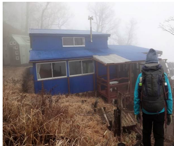
今夜泊まる青ヶ岳山荘に到着