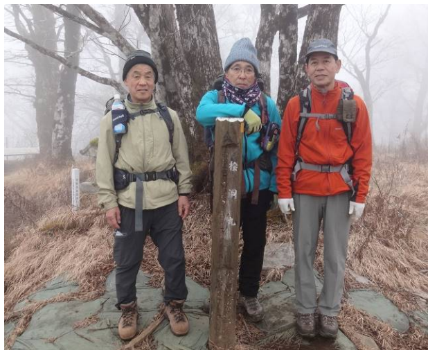
檜洞丸に到着 1名の登山者がいたので 記念写真を依頼した 気温はかなり低い