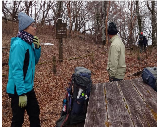
途中にベンチがあり時間も早いので休憩を行ったが寒い為すぐに出発