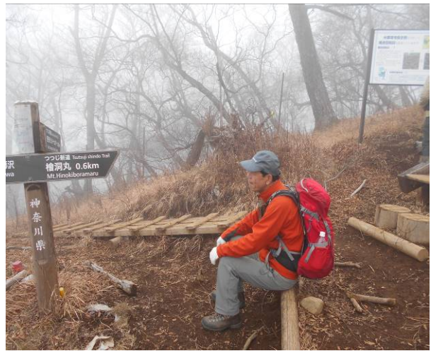
つつじ新道の合流 山頂までは、もう少し 天候悪くなってきた