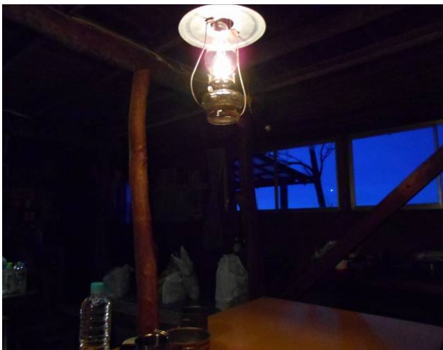
早朝ランプの明かりだけ、小屋の様子