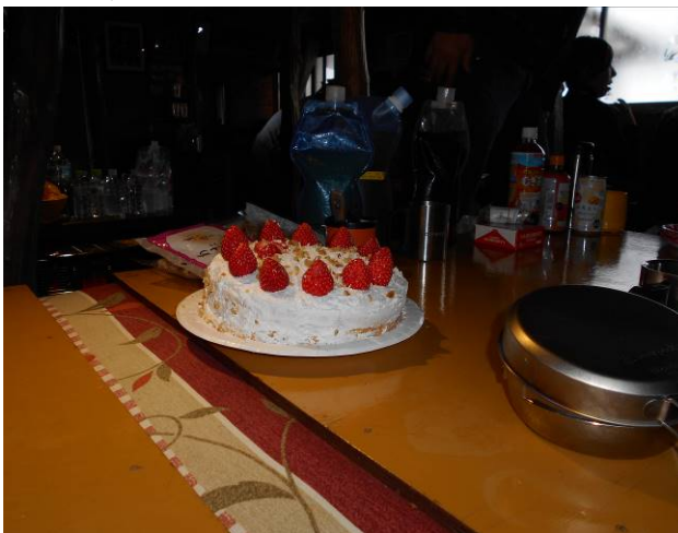
作っていたケーキです、本格的に 後で私たちも分けてもらい、おいしく 頂きました