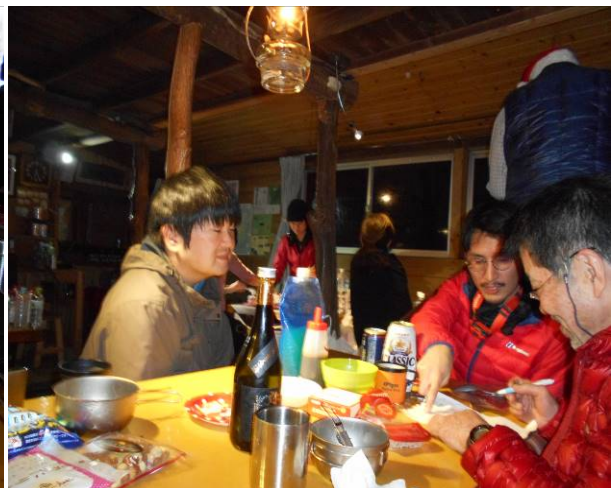
堀こたつで、一拝やり、ゆったりと過ごす