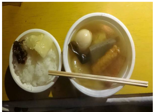
夕食はカレー（手作り）朝はおでん