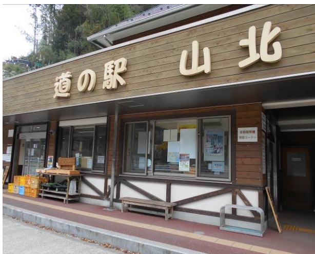
バスに乗れなかったので谷峨駅まで歩く 途中の道の駅で小休止