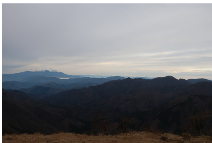
塔ノ岳から：富士山と南アルプス