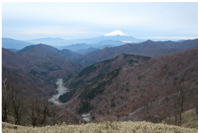
竜ヶ馬場から：ユースン溪谷が良く見えた