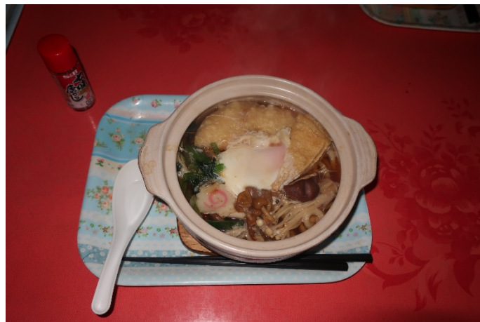
お決まりの鍋焼きうどん!