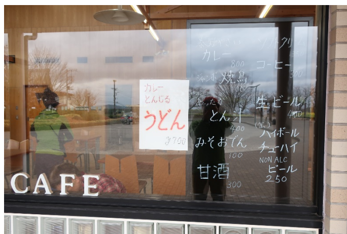
コンビニになってしまっていたどんぐりハウスの食堂が復活していた! 生ビールも有ります。