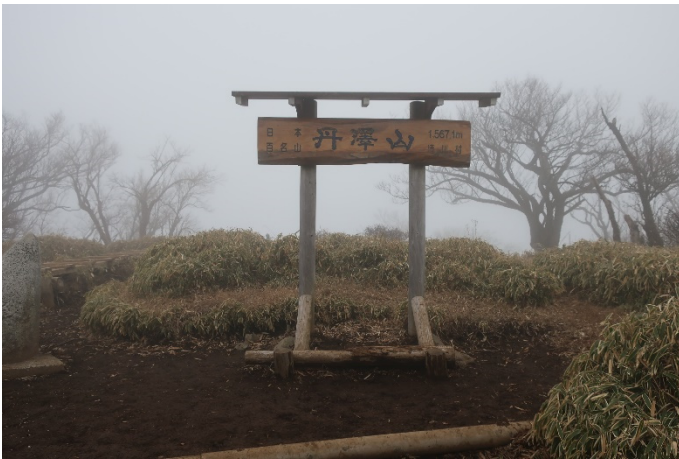
やっと着いた丹沢山山頂

本日は曇っていて、また、標高が上がると雲の中に入ってしまって、展望は全くなし。 あまり写真も撮らなかった。みやま山荘泊。 夜中には晴れて、相模原方面や裾野方面の夜景が見えていた。