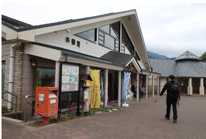
順調に大倉に到着