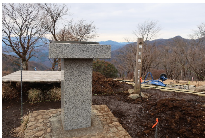
鍋割山到着 標識は工事中