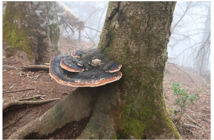
いつも通る大きなサルノコシカケの場所