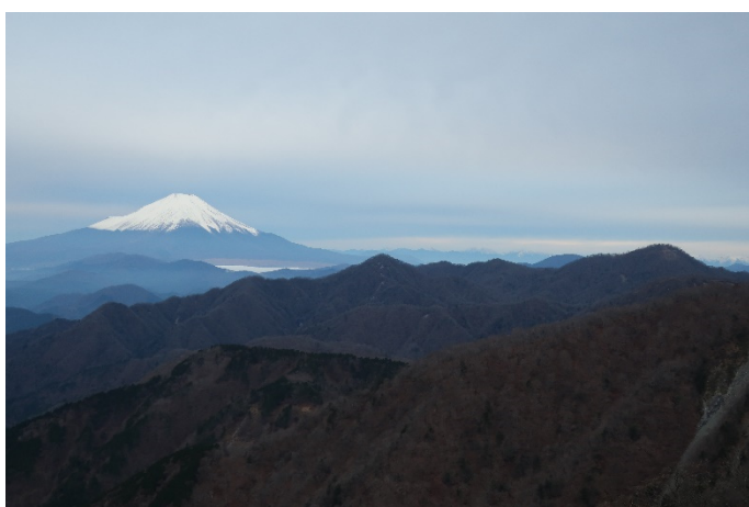
竜ヶ馬場から：富士山と南アルプス