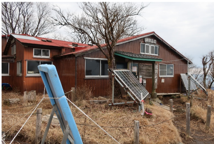
鍋割山荘 本日は9:40から営業