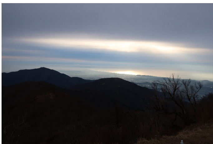
塔ノ岳から：相模湾