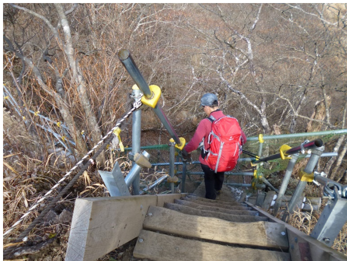
金冷し手前の崩落箇所 仮設足場で整備されており、安全。