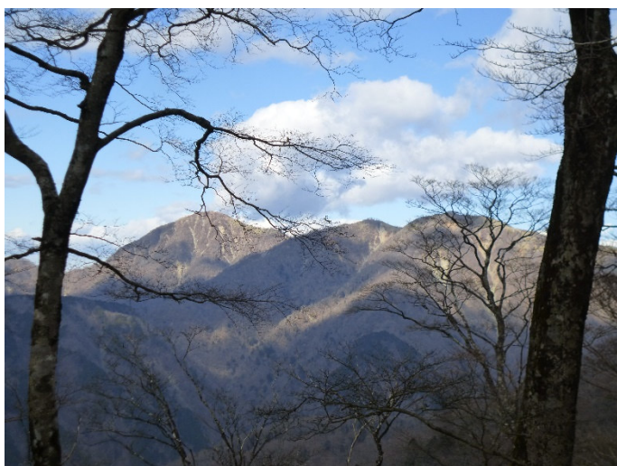
復路は小丸尾根経由に変更 蛭ヶ岳方面の展望