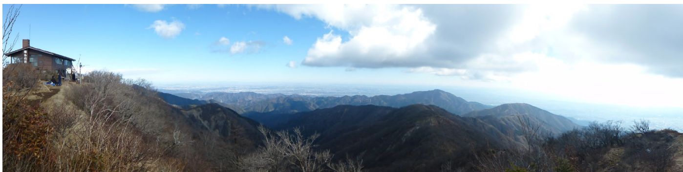
東方のパノラマビュー。相模台地から相模湾まで良く見える。