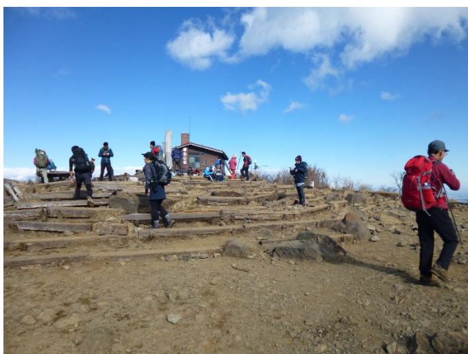
塔ノ岳山頂 快晴で展望良し ただし、気温 2℃と寒い