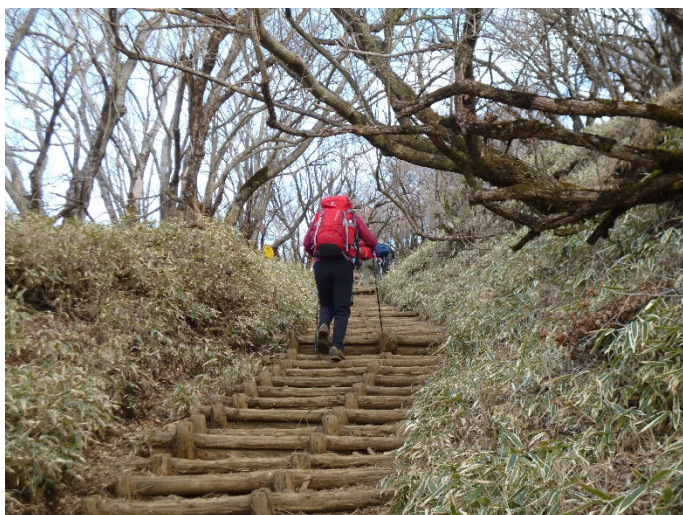
山頂手前の登り 積雪なし、乾燥していて凍上箇所も少ない