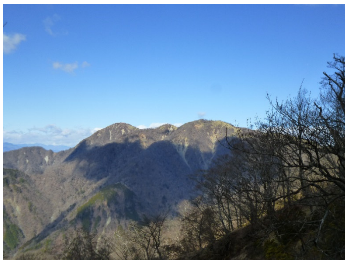
三ノ塔（右）方面の展望 三ノ塔避難小屋が建替えて解体され見えない