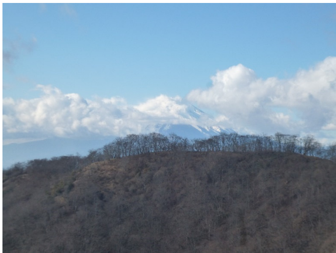
花立山荘上の展望 富士山にかかった雲が切れない