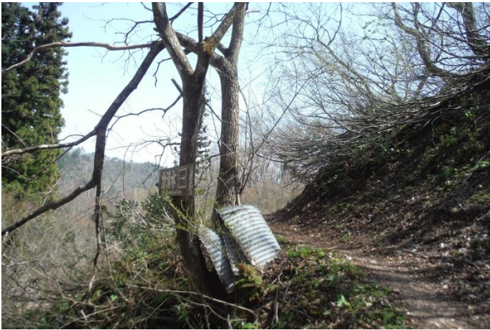
オオシマサクラも目に付く