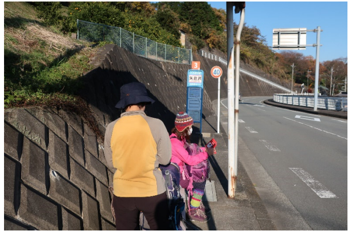
予定通りにバス停に到着