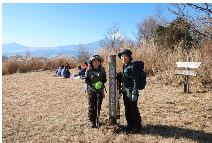
お決まりの記念写真を撮って下山開始