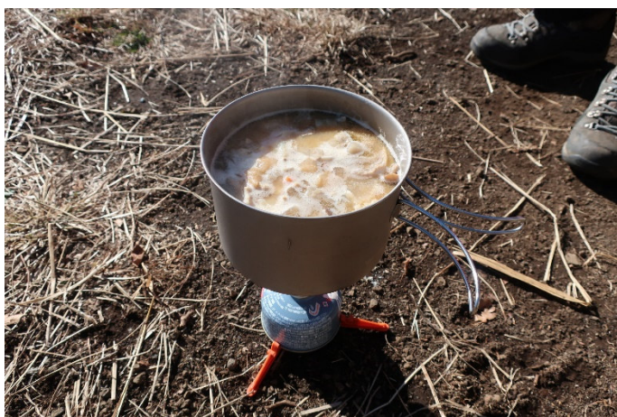
Tさん特製の豚汁をたっぷりと頂く