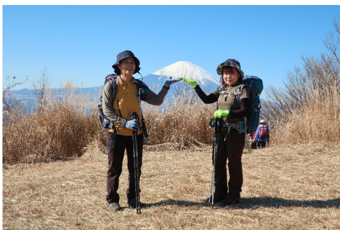
富士山の雪、重いっ！