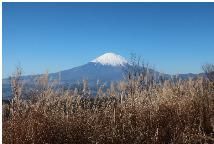
絶好の富士山ビュー