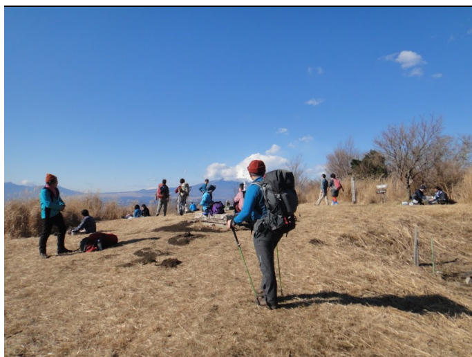
山頂到着！ 山頂は広く平らな広場になっている