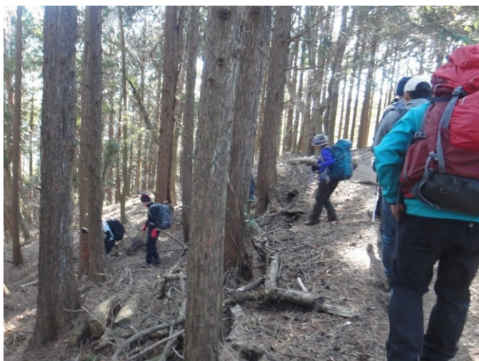
万葉ファミリーコース分岐 コース上に標識は無く、少し下った所にある