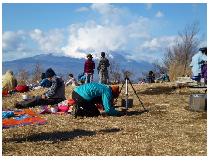
鍋パーティーの準備開始