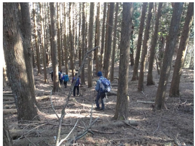
万葉ファミリーコース 樹林帯の中を下る