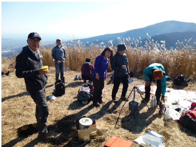
シャンパンも堪能 (乾杯の写真撮りそこないました)