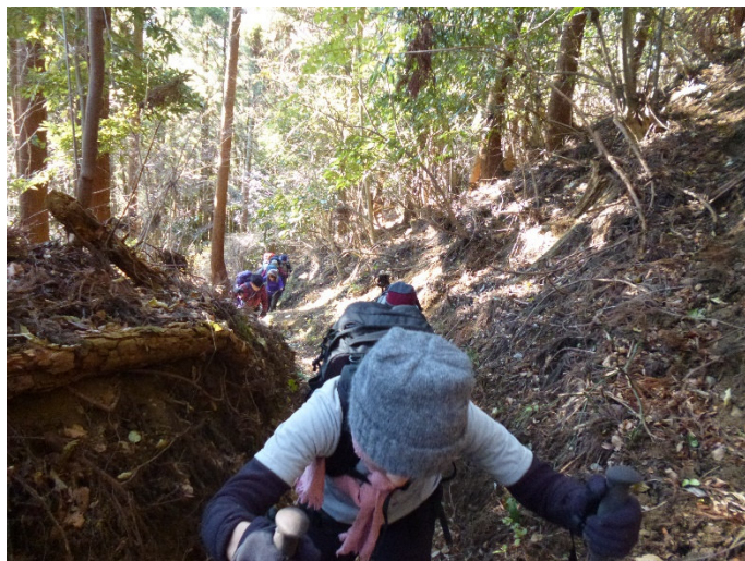
急坂だが、段差は少ない道で歩きやすい