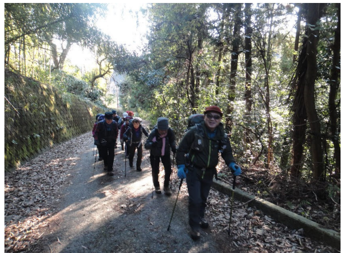
始めは舗装路の林道を行く