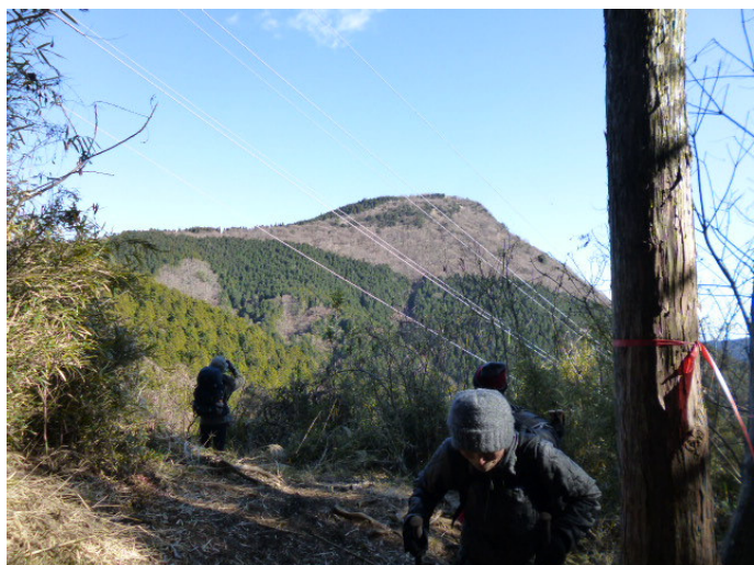
登ってきた矢倉岳を仰ぐ