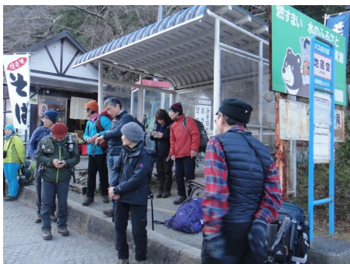
地藏堂バス停に到着