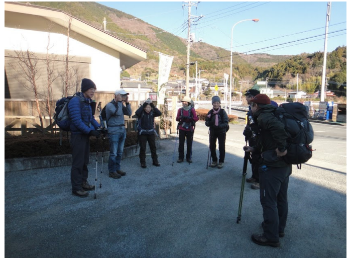
矢倉沢バス停で降りる 近くの矢倉沢公民館前の公園で身支度 トイレもある