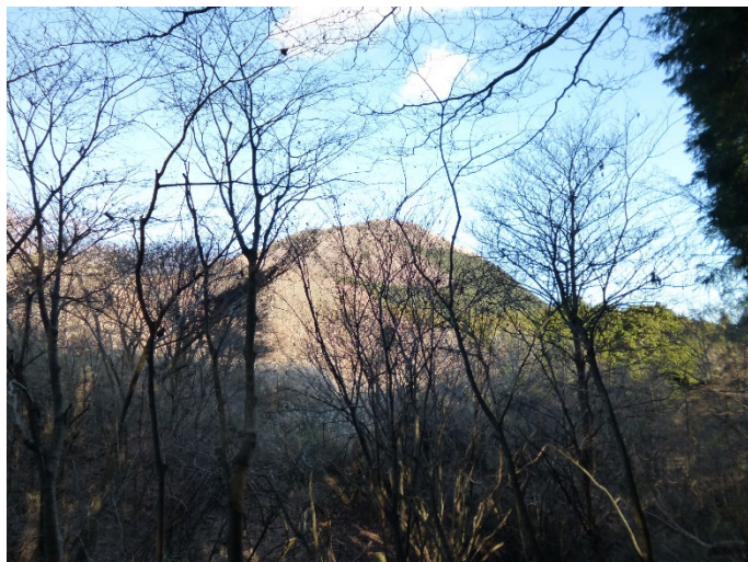
登ってきた矢倉岳が遠くに見える