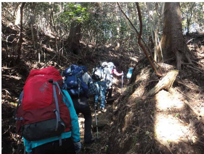
鹿柵を過ぎると急登の始まり