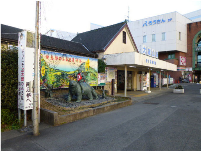
集合した大雄山駅 金太郎の銅像がある 隣の関本バスプールから地藏堂行バスに乗る