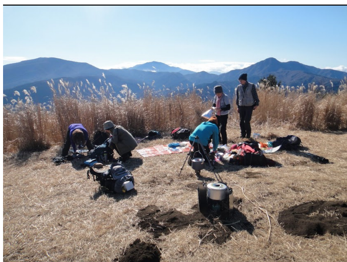
準備中 箱根山をバックに 左から、明神ヶ岳、神山、金時山