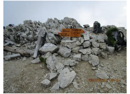
薬師岳と同じく黒部五郎岳も岩ゴロの急登が頂上まで続く