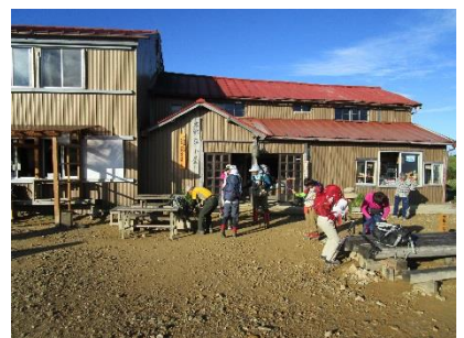
折立から約5時間で本日の宿、太郎平小屋に到着