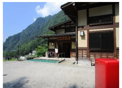
わさび平小屋で休憩後、新穂高温泉に下山・・・今年も無事歩けたことに感謝！ 日帰り温泉で5日間の汗を流し帰京した。