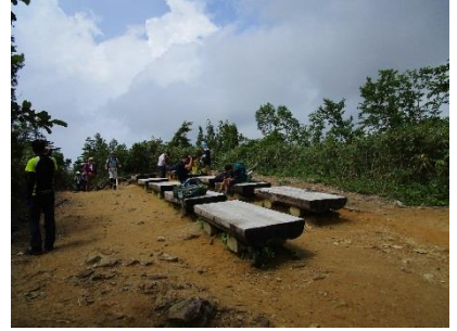
折立登山口から樹林帯を登り五光台ベンチに到着