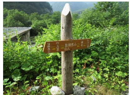
雪田花見平～弓折分岐～小池新道登山口へ