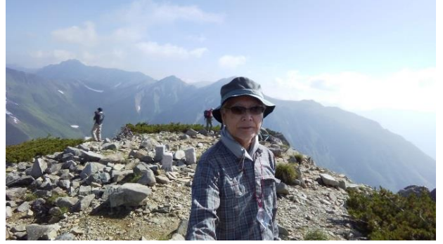
三俣蓮華岳山頂はすばらしい眺望でした