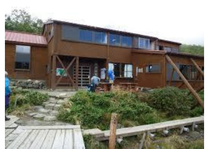
中道ルートのお花畑を歩き、予定よりも早く双六小屋に着いたので、その先の鏡平山荘まで行くことにした