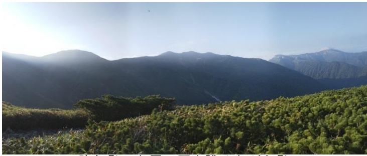
昨年登った雲ノ平を眺めながら登る