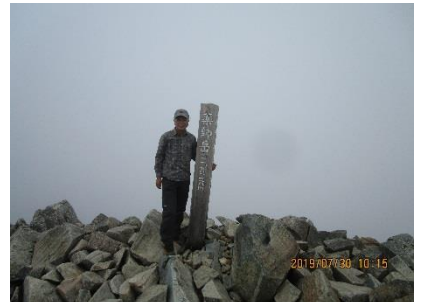
薬師岳山頂に登頂・・・あいにくガスが出てきて暫く待ったが眺望なし・・・