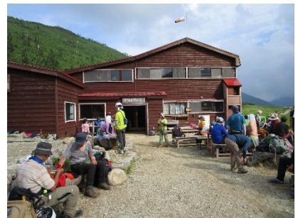
本日の宿、黒部五郎小舎に到着