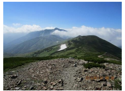
お花畑の木道を歩き、北ノ俣岳に登る、遠くには黒部五郎岳が見える