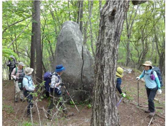
米背負峠から大谷ケ丸へ登りかえして