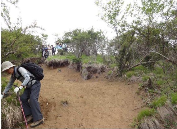
新緑がまぶしい尾根をさらに降って行く