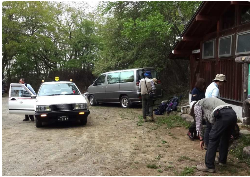
ガスでよく見えない白谷丸のザレ場