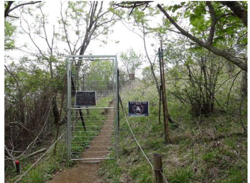
高原には花はまだ早かった