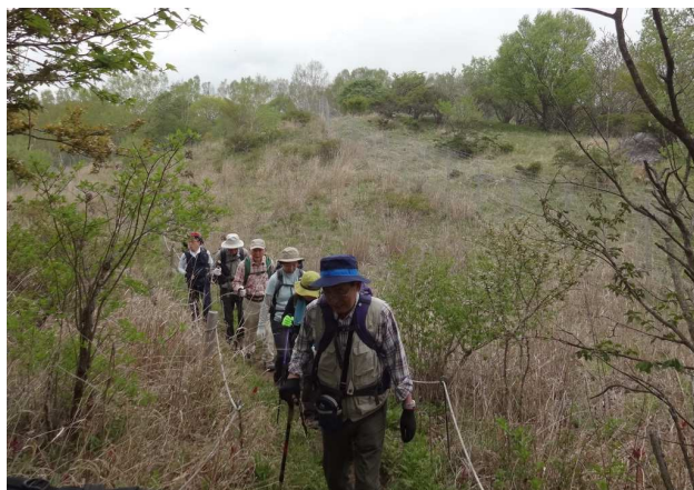
高原にわらびの群落があったので、少し分けてもらう