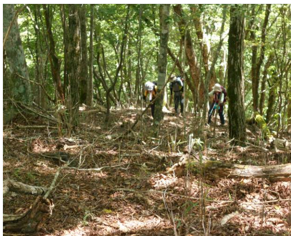
鳥ノ胸山南北山稜コース合流直前