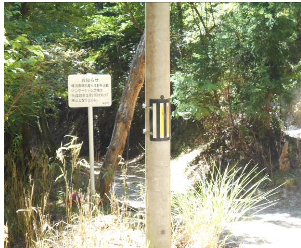
正面に野外活動センターがあった H25年3月で廃止