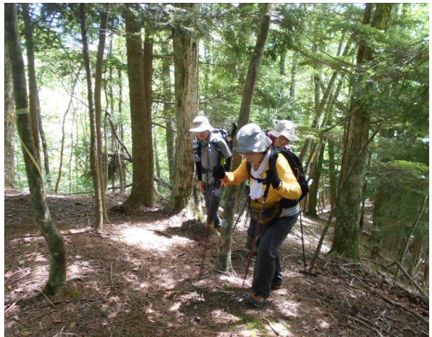
尾根道の間あたり