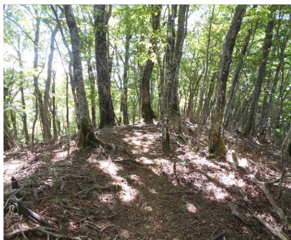
鳥ノ胸山南北山稜コースに合流