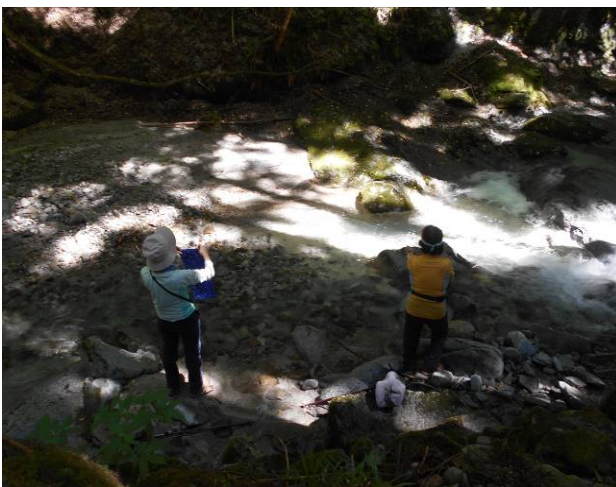
熱いので河原で休憩