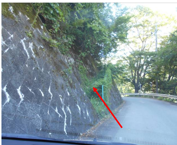
矢印の部分が今回の登山口

道志のバリルートで、西丹沢詳細地図にもないルートです、スタートは道志の湯より林道を約600m位下った場所が登山口ですが、標識等は無く、道路壁の切れ間は入口となるそこから尾根端まで移動し、そこから人工林の急登がルートになります、最初の部分踏み後は無いがコンパスの指す方向に登って行く、かなり登った場所からは薄い登山度(作業道)が出てくる、約40分位の場所に綺麗な林道に合流する、この林道の入口がわかれば、人口林の急登を使用しなくても、すみそうだここから検見ケ丸までは、林道を歩き終点より急登を直登すると、検見ケ丸に到着山頂には標識は無いですが、小さな広場となっていて、休憩するのは、良い場所です、そこから越路林道 恋路峠に向か登山道ですが人工林の平らなコースです、越路林道を約40分位歩くと、西棚沢の川にぶつかり、その先に大きな東屋があり、その先で先ほど渡った川を渡り対岸の急な尾根に取り付く、この場所にはリボン等の印は無いので、場所を探すのが大変でした、そこから鳥ノ胸山南北山稜コースまでは、人工林の急登で尚直登が続く、通常の登山道に合流し雑木ノ頭に向かう、合流地点より15分位で到着する、分岐の行先標識はあるが山名表示は立ち木に巻いたテープに書いてあった、の分岐の表示は行先表示が分かりにくい為、(道志の湯 道志の森キャンプ場)コンパスで行先確認を行った、ここから平指山へは、多少のアップダウンがあるが約15分位で、到着する、この場所には山名標識があった、到着時間も11時20分過ぎなのでここで30分の昼食タイムを取った、気温が高く蒸し暑いので、長めの休憩とした昼食後浦安峠までくだるルートとなるが、峠近くの場所は急なザレタ道で、下りに注意が必要、ここで次ぐに大界木山へは標高150mの登りとなるので、今回はここから室久保林道コースを下る事に変更した、ここからは駐車場までは1時間30分で行くが気温が高いので、途中河原に降りられる場所で、かわの水で顔を洗い涼んだ、その後駐車場に戻り着替えて、道の駅により、冷たいジュースを飲み、帰路に付いた。今回いけなかった大界木山経由のルートが後日室久保林道コースを浦安峠に行き、そこから残りのコースを歩く計画をたてる予定。