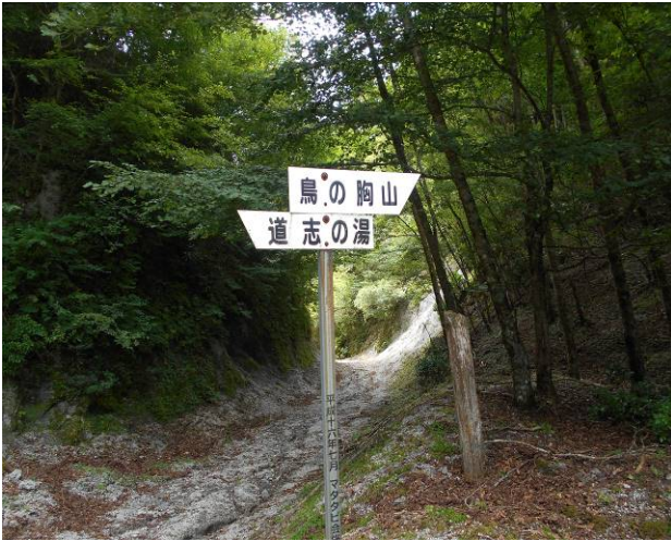
恋路峠に到着 奥側に行くと 大界木山方面