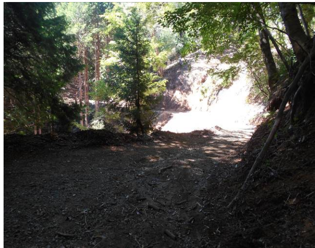
次も広い林道ですバリルートなのですが 越路林道