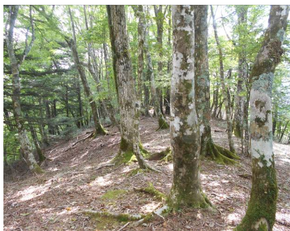
平指山よりの下山方面