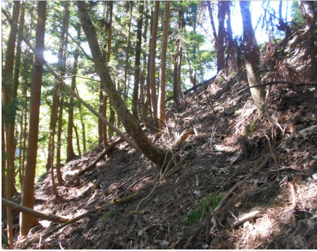
この部分を斜めに進む