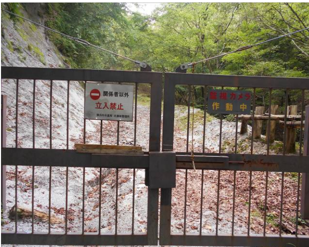
室久保林道のゲート恋路峠から数分の場所