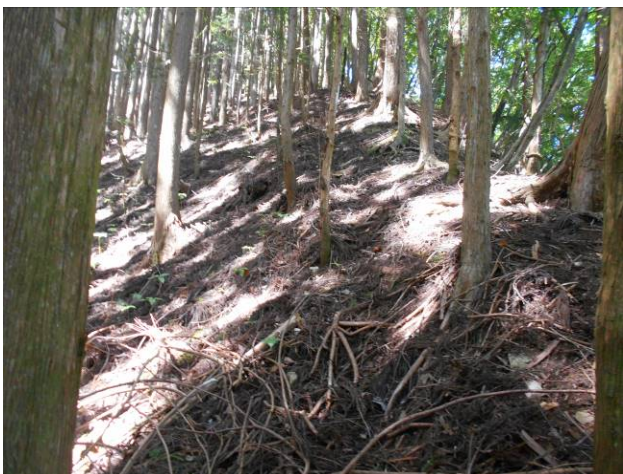
越路林道 恋路峠からの急な尾根道