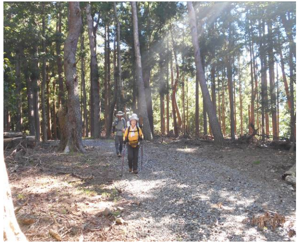
約 40 分後の林道 この場所も 地図に表記は無い