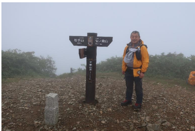
平標山山頂 気温 10℃、風速約 5m で体感気温は 5℃位