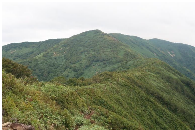
S字の尾根線を登れば山頂へ (見えているのはニセピークで山頂はやや右奥)