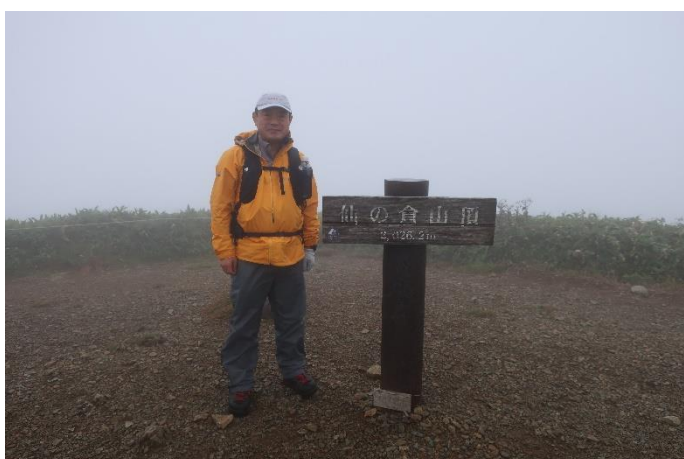
仙ノ倉山山頂到着 谷川連峰最高峰 標高 2,026.2m 晴れていれば、360° 絶景の展望があるらしい