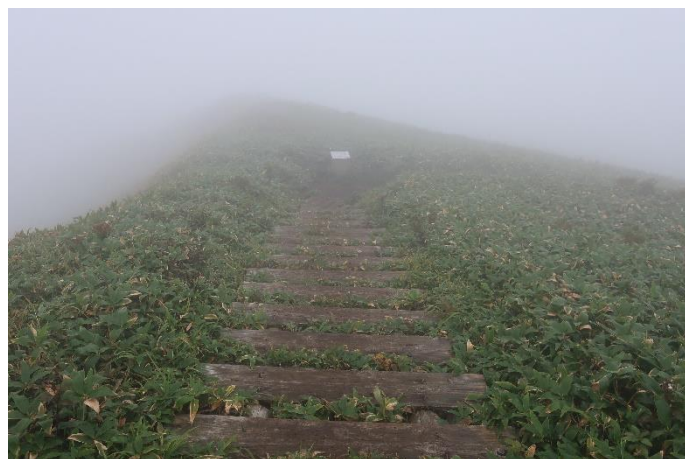
仙ノ倉山への道は整備された尾根道 風が強く、小雨も降ってきた