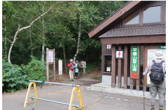
駐車場には立派なトイレがある 横手に靴洗い場もある