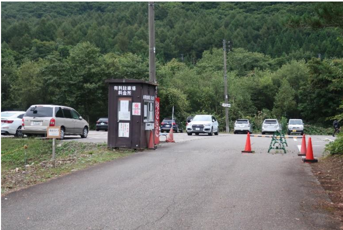
平標登山口 元橋駐車場 バス停もある 駐車料金は1日600円

苗場浅貝に前泊・後泊し、日帰りでお花畑で有名な平標山と谷川連峰最高峰の仙ノ倉山へ登った。ただし、今はお花の季節ではなく、紅葉にもまだ早い。つまり、ハイシーズンを外し混雑を避けてトライしたのである。本日は、関東は雨だが新潟地方は晴れという天気予報だった。しかし、やっぱり山の天気は難しい。