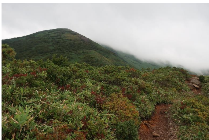
六合目を過ぎて森林限界を過ぎたあたりで あっ、山頂に右（南）から雲がっ！