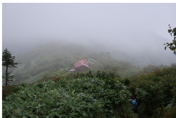
平標山ノ家が見えてきた