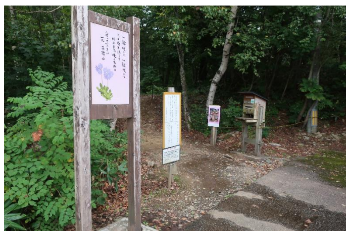
平標山登山口 元橋駐車場に下山 お疲れさまでした！