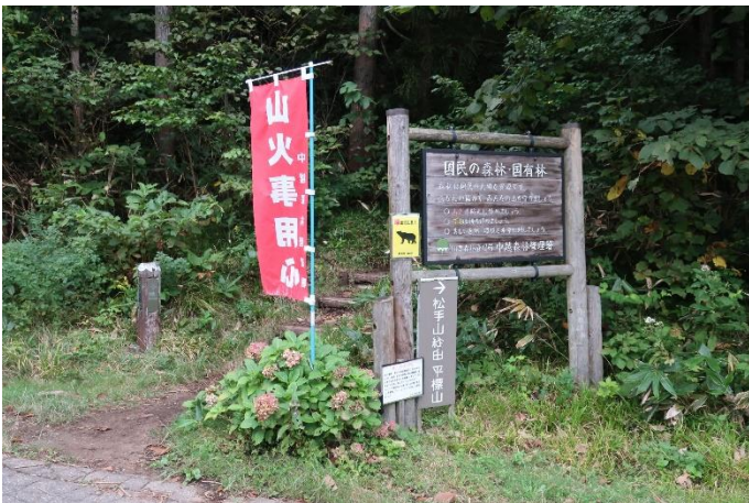
平標山登山口 (松手山経由)