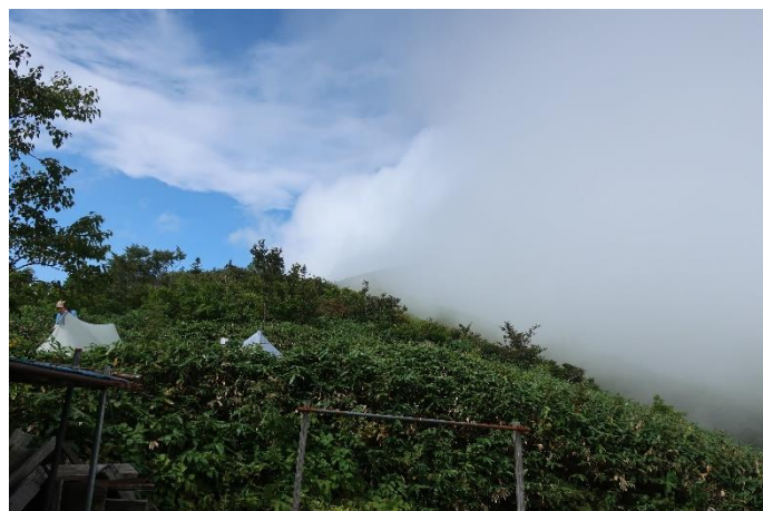
お昼を食べていたら晴れてきて強い日差し 見上げると、山頂も晴れつつある