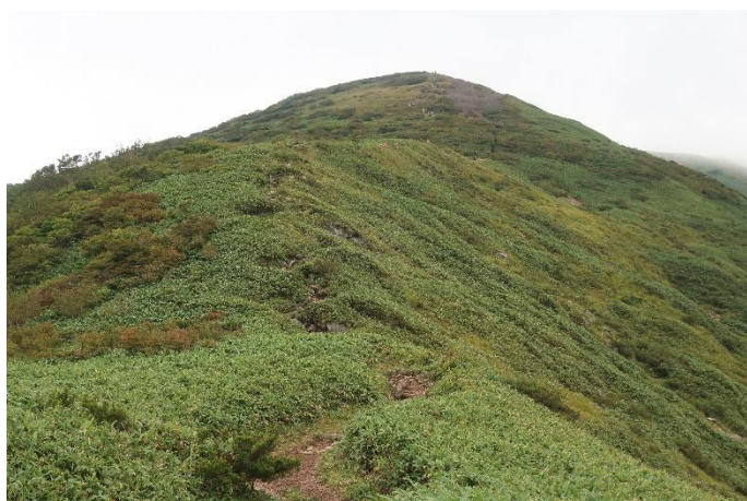
ニセピークまでは晴れているが、 その奥の山頂はすっかり雲の中に