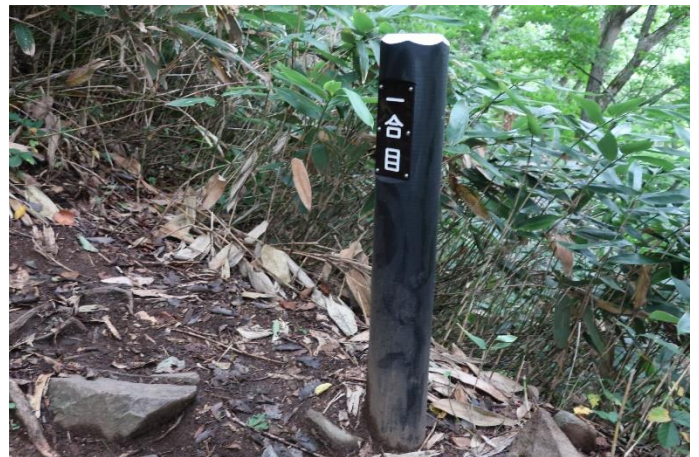
平標山まで、1合目毎の標識がある