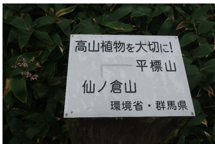
ここは、新潟県でなく群馬県なんですねぇ