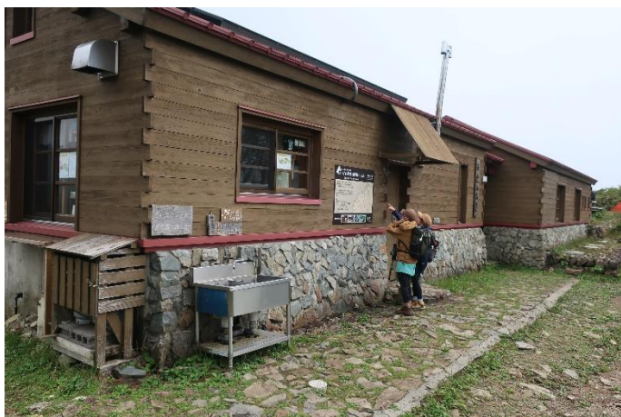
平標山ノ家 トイレもきれい