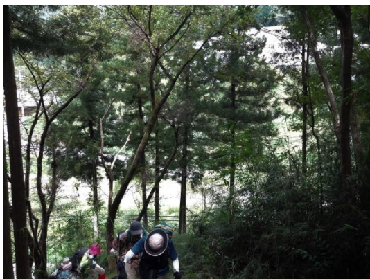
すこし頑張っの登り