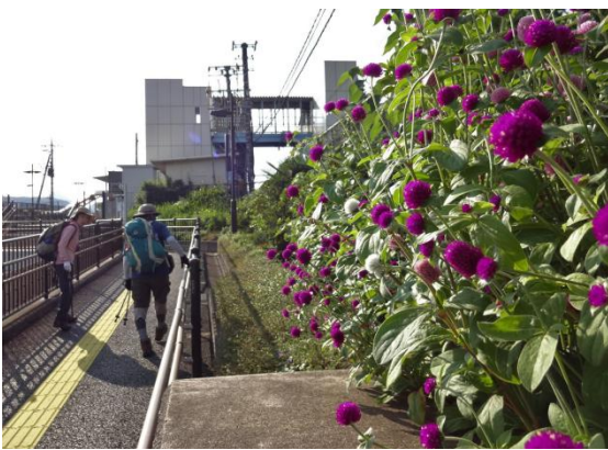
線路沿いを藤野駅へ