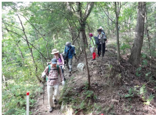
これより小さなアップダウンを繰り返しながら藤野駅へ