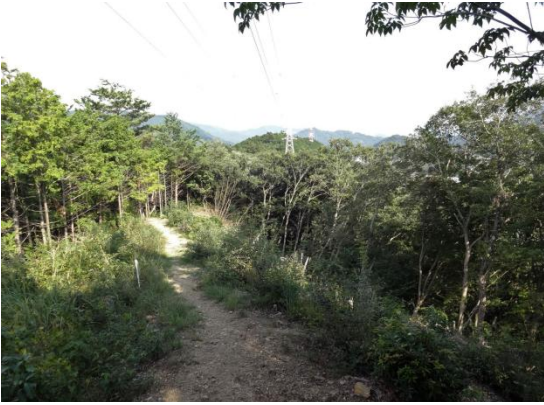
明るい尾根道を行く