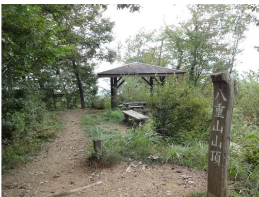
またもやアップダウンして八重山石碑