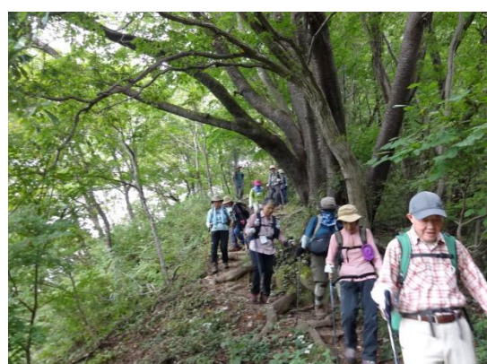
石碑の裏から県道へ向かってバリルートへ