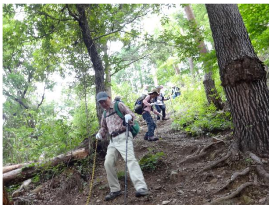
桜並木の気分の良い尾根道歩き