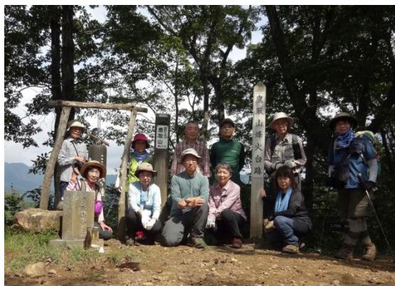
見通しの良い鷹取山で