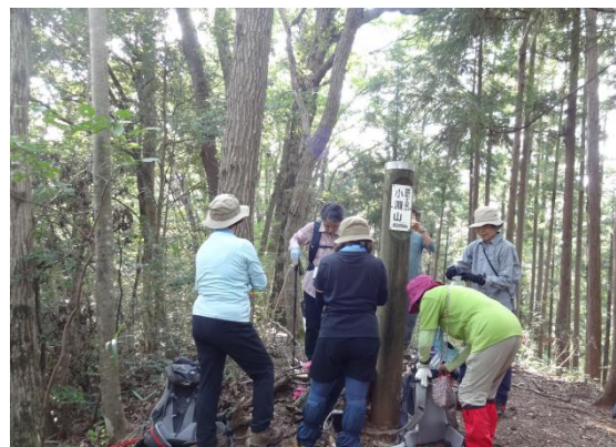
これより小さなアップダウンを繰り返しながら藤野駅へ