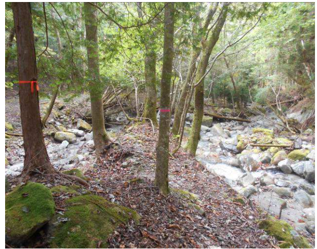
渡渉ポイントの手前でのテープがある