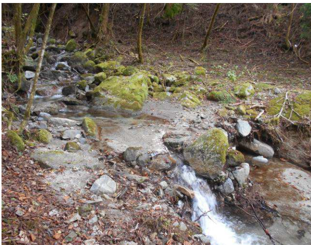
この場所が渡渉ポイント簡単に渡れる