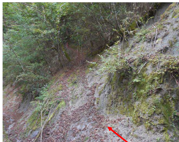
標識の反対側が登山道