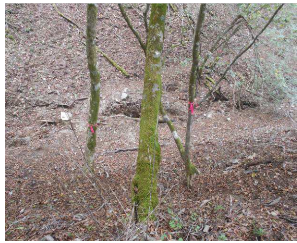
木に赤いテープがあり方向を示している