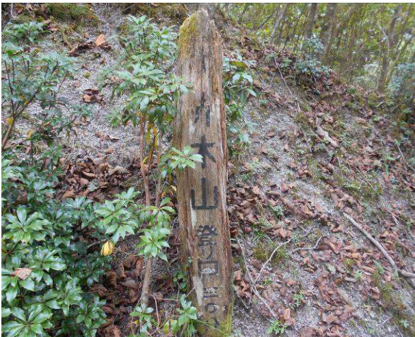
大界木山 登山口の標識

8月に計画し途中でコース変更を行った 恋路峠-野外活動センター間のコースに行く事にした、今回はコースが短い為 畦ヶ丸避難小屋の完成を見に行く計画も追加した、室久保林道を浦安峠まで行、そこから大界木山へ向かう、浦安峠までは、林道で、石も多く歩きにくいし、モトクロス用バイクの通行がある、浦安峠-大界木山の間は晶文社地図では破線となっています、登山道の入り口は、不明瞭で登山道入り口の反対側道路脇に古い大界木山の標識があります、入り口はザレタ急な登りで、周囲の立木を利用して登るその先は踏み跡はありますが、少しの間は狭い急な九十九折のコースです、その後は緩やかな登りとなりますが、途中で別の尾根との合流箇所があり登りでの使用では、問題ないが下山での使用では、コース間違いを起こしやすいので、注意が必要、その後一般ルートの合流し約10分位で大界木山に到着、展望は無い、ここからモロクボ沢ノ頭に向かう途中の恋路峠があるが、標識はない、ここを通り過ぎてモノクボ沢ノ頭に、この場所は白石峠からのコースと合流する、後は畦ヶ丸避難小屋を目指して進む、途中一か所鎖場があるが登りでの使用は問題ないが、下りの場合は注意が必要、今回避難小屋の工事を終了していると思い避難小屋での昼食を考えていたが、工事中の為、作業者の許可をとり、内部の写真撮影を行った、ここでの昼食は諦め、先ほど通過した、モロクボ沢ノ頭に戻り昼食タイムを取った、ここにはベンチが2台あり、良い休憩場所です、その後今回の山行の主な目的なコース、恋路峠-野外活動センターに向かって下山した、恋路峠の場所は標識が無いのでGPS等で場所の確認が必要、ただし、コースを良く見ていると一番低い場所が峠なので分かり安い、そこからは、コースを表す赤のテープが沢山あり又踏み跡もあるので、コース間違いの心配は無い、又コース事態も緩やかで、登山道もやわらかく歩きやすい道です、コースを下って行くと、標識があり、畦ヶ丸ハイキングコースと表示されていた、その後渡渉を2回行い、室久保林道にでますが、林道には、何の標識もありません、このコースを使用すれば、畦ヶ丸まで約2時間30分位で行けます、ここからは朝来た林道を駐車場まで戻った。