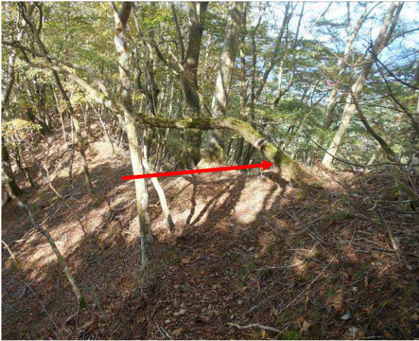
下山注意する分岐矢印の方向が正しい