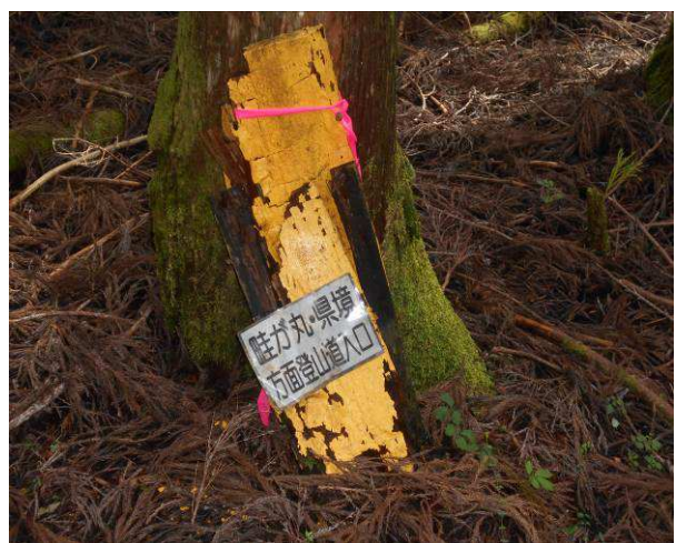
登山道入り口の標識こんな場所に あってもわからない 林道に設置してほしい