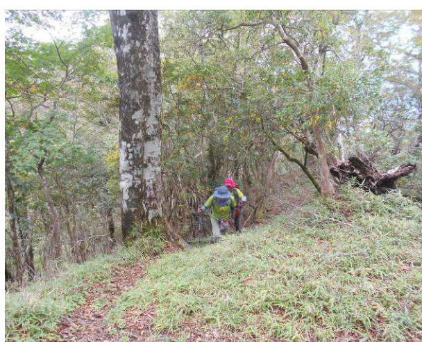
避難小屋前最後の登り