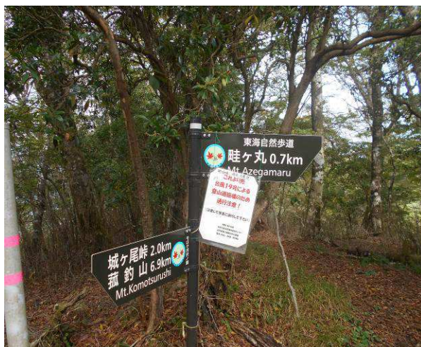
モロクボ沢ノ頭 (大滝橋方面崩落の注記)