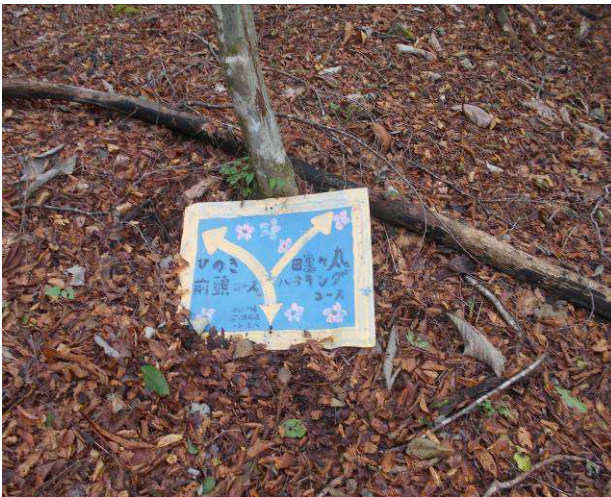
この看板に畔ヶ丸ハイキングコースの表示