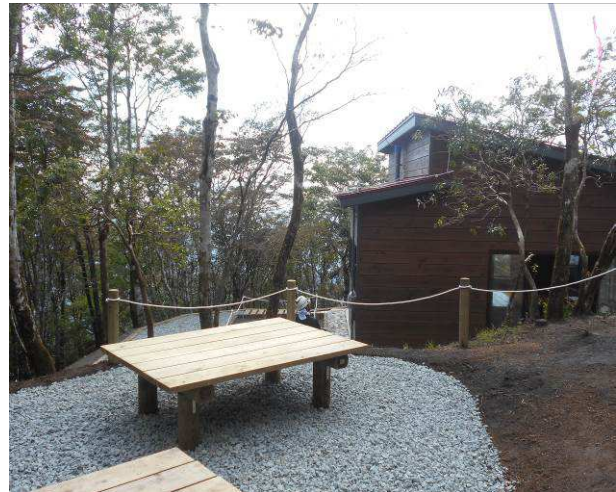
ベンチの部分にも碎石が引いてある