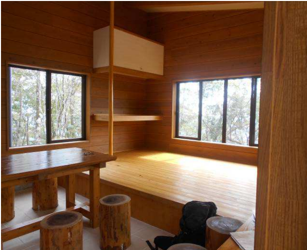
内部は窓も大きく明るい