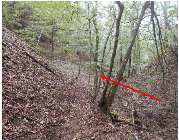
少し分かり難いがテープが目印