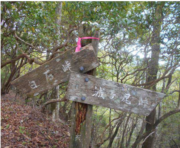
尾根ルート of 標識 畔ヶ丸の表示が無い