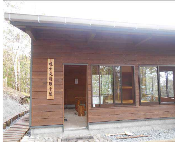
避難小屋に到着まだ工事中 作業者に確認したところ 10月末には使用出来る様です