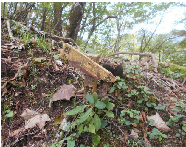
恋路峠 道端に小さな看板が