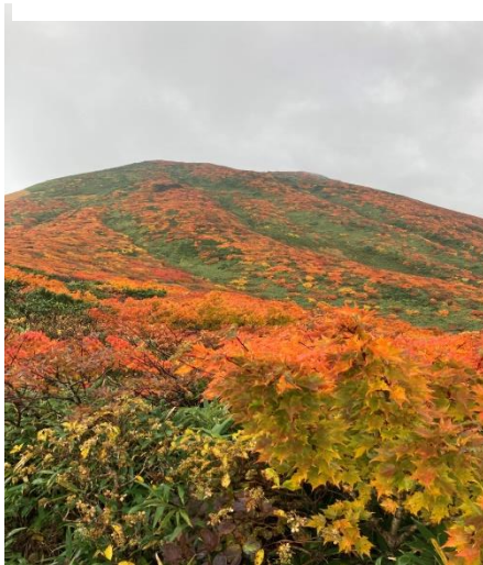
下山途中一瞬ガスが消え紅葉風景が見えました