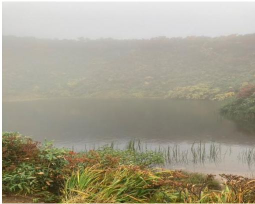
産沼もガスってました