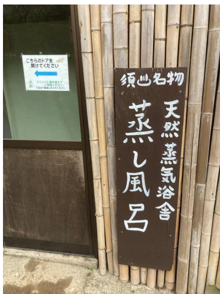
須川温泉名物蒸気風呂