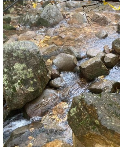
三途の川も水量が増えてました