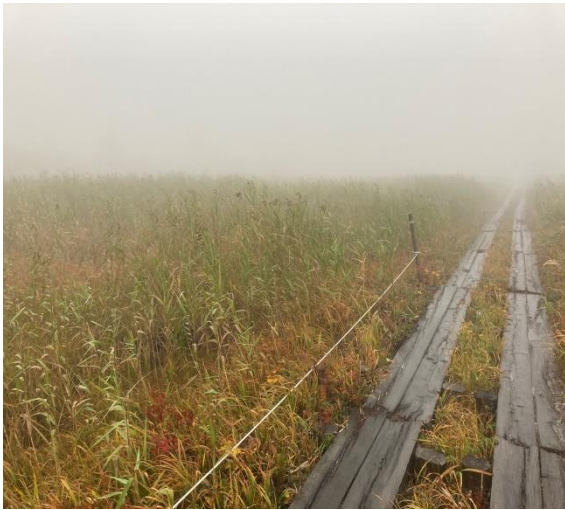
自然観察路の雨中の木道は滑りやすいです