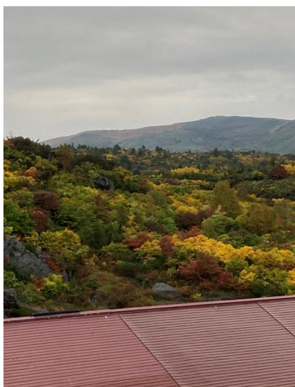
早朝は霧雨でしたが・・・