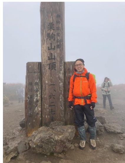
撮影後雨と風が強くなり、天満尾根方面を断念してピストンで下山