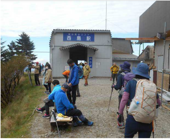
西島駅に到着後はリフトで下山