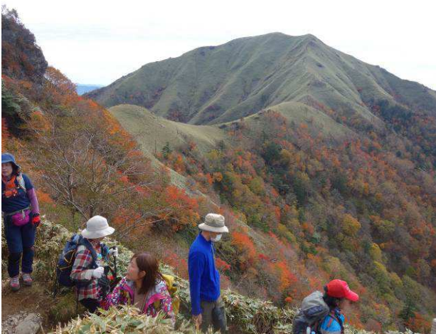
次郎笈を見ながら