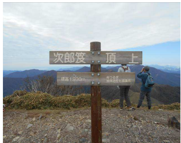
次郎笈 山頂 多くの登山者が昼食中