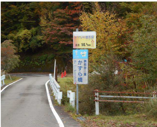
駐車場 二重かずら橋の看板を見つけた

剣山登山口見ノ越まで国道438号線 別名剣山ドライブウェイを使用する、この国道は道幅が狭く、カーブも多い又集落を通過する場所では、車1台分の道幅しかないその為登山口までの時間は多く必要です、登山口の標高は約1400mありますので、気温は低い、この日は紅葉のシーズンと重なり、駐車場は満車で、登山口より約2Km下った場所に送迎用バス駐車場があり、そちらに駐車した、歩いて見ノ越駅(リフト乗り場)へ今回は時間及び同伴者の事情によりリフトを使用し西嶋駅に向かった、徒歩の場合急な登山道を約60分で西島駅に到着します、西島駅の標高は約1700mで山頂までは標高差約250mハイキングレベルで登れる山です、多くの家族連れ団体ツアーの片が見受けられた頂上ヒュッテは本来食堂もありますが、コロナの影響でテイクアウトのみの扱いでしたし宿泊は通常通り泊まる事はできます、山頂は大きな広い場所ですが高山植物の保護の為木道が設置されていた山頂より次郎笈 三嶺方面が良く見える 時間に余裕があったので単独で次郎笈往復を行った、コースは笹原の尾根道で、一度次郎笈峠まで下り登り返すコースで、登り返す、見晴がよく景色を見ながら楽しめるコースです、剣山に戻り昼食タイムを取った、下山は、剣山の裏側を西嶋駅へのコースとした、途中紅葉の綺麗な場所がありました、西嶋駅よりリフトで見ノ越駅へ降りた、そこから駐車場まで車道を歩き約20分位で到着、そこで二重のかずら橋の看板があり、時間も早いので、かずら橋の見学に向かった、距離は看板で5KMの表示ですが、道幅の狭いカーブの多いので、時間が掛かったが、かずら橋の見学ができた、2本のかずら橋はあり、女橋、男橋の名前で女橋の方が川底からの距離は短い、観光客は数名いたが、ゆっくりと見学ができた。