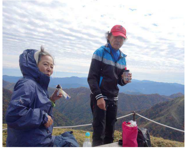
戻ってきてからの昼食（剣山 山頂）