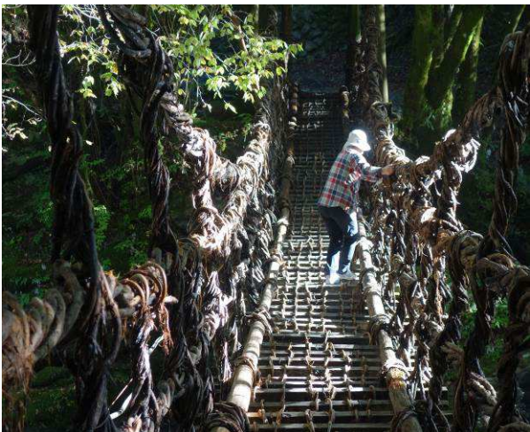
頑張って渡っています この場所は、観光客が少ない (二重のかずら橋)