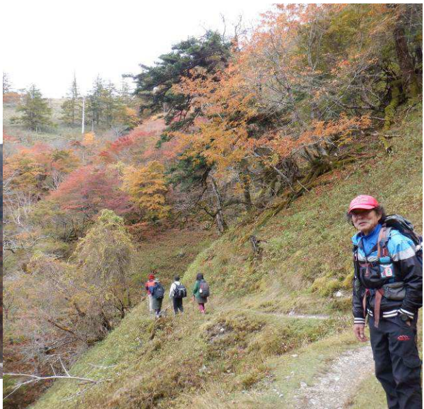
紅葉をバックに記念撮影