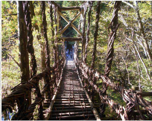
かずら橋渡る準備中