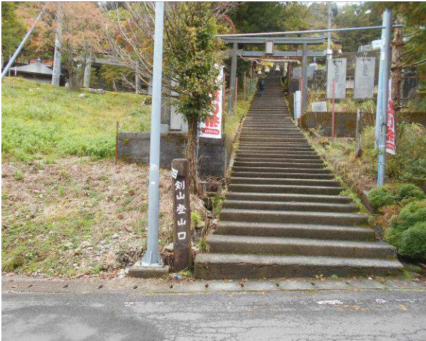
登山口ですが今回はリフトで登る