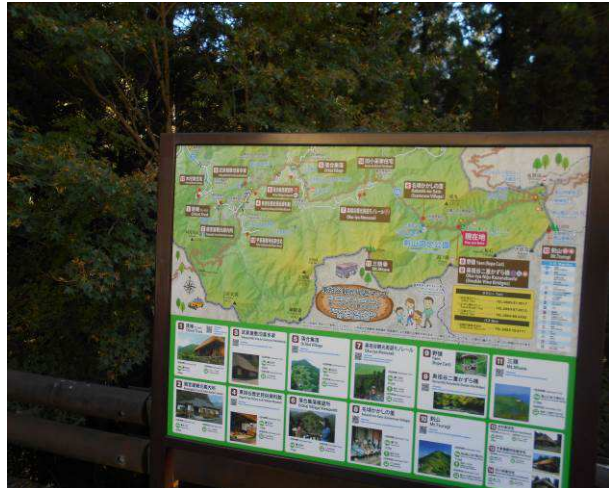
東祖谷観光周遊マップ