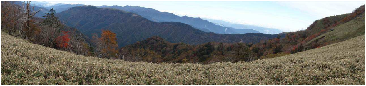
ジロウギョウ峠よりの パノラマ