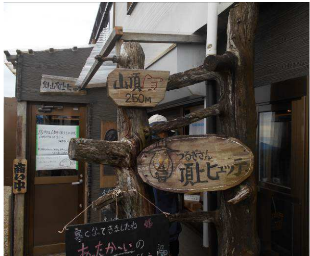
コロナの影響でテイクアウトのみでした