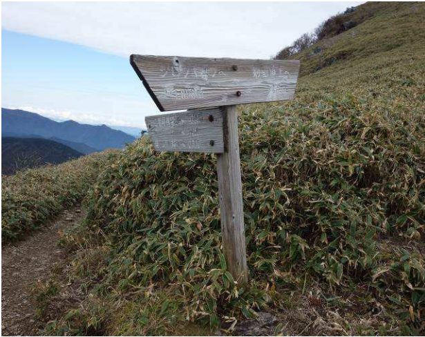
二度見展望台分岐