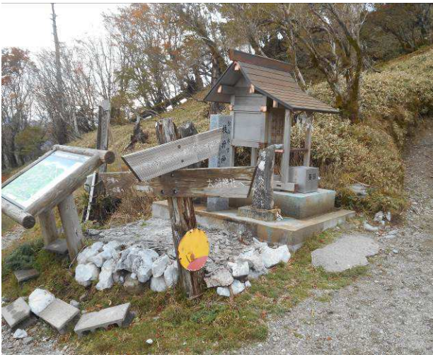
刀掛の松 (大剣神社分岐)