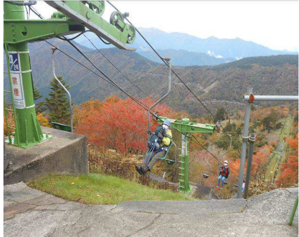
西島駅に到着 海拔約 1700m