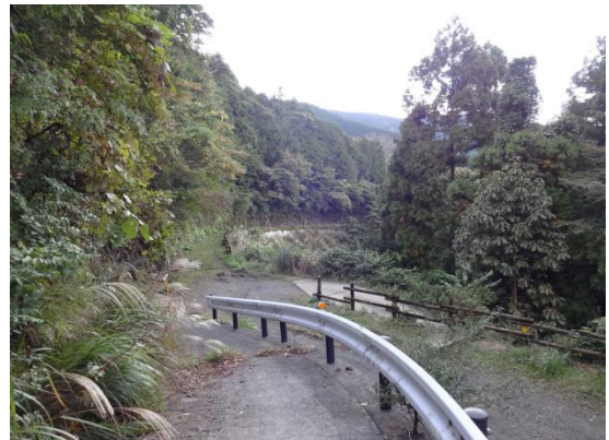
菩提地区は丹沢遠山茶の産地