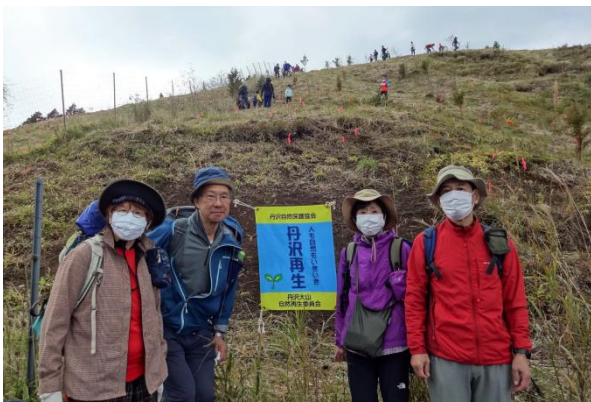
作業を終えて記念写真