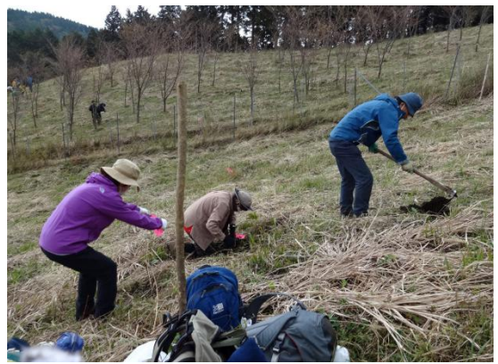
周囲の草原地が今回の植樹エリア