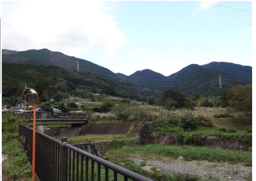
振り返ると菩提峠が見えていた