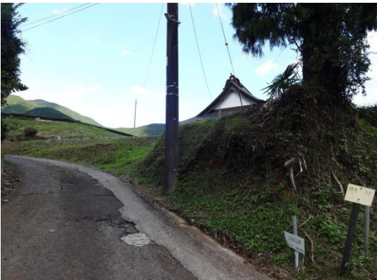
菩提峠から僅か 80 分で菩提東園寺へ降り立つ