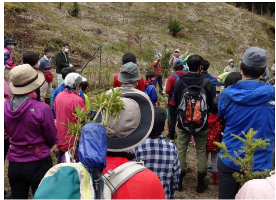
周囲の草原地が今回の植樹エリア