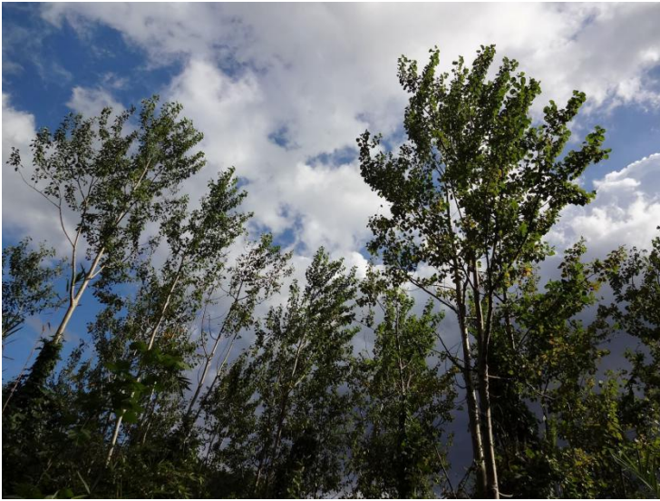
思いもかけず「ポプラ」の樹