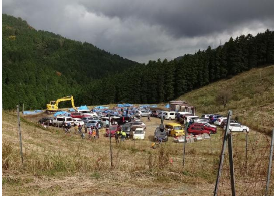
総勢 200 名を越え家族連れも多かった