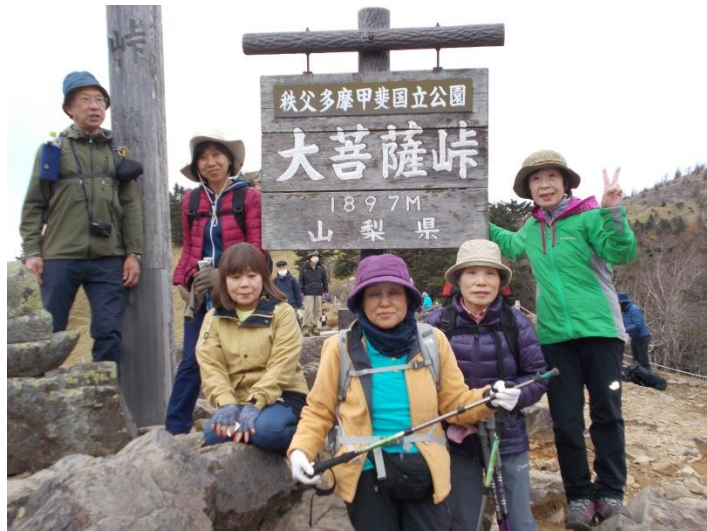
大菩薩峠にて再度記念写真