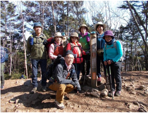
大菩薩嶺にて記念写真、眺望はなしです