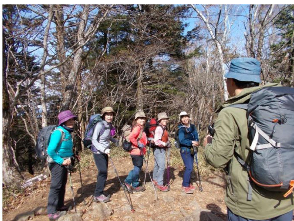
唐松尾根の登りにて休憩