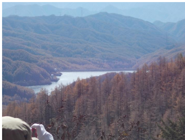
大菩薩湖（人造湖です）