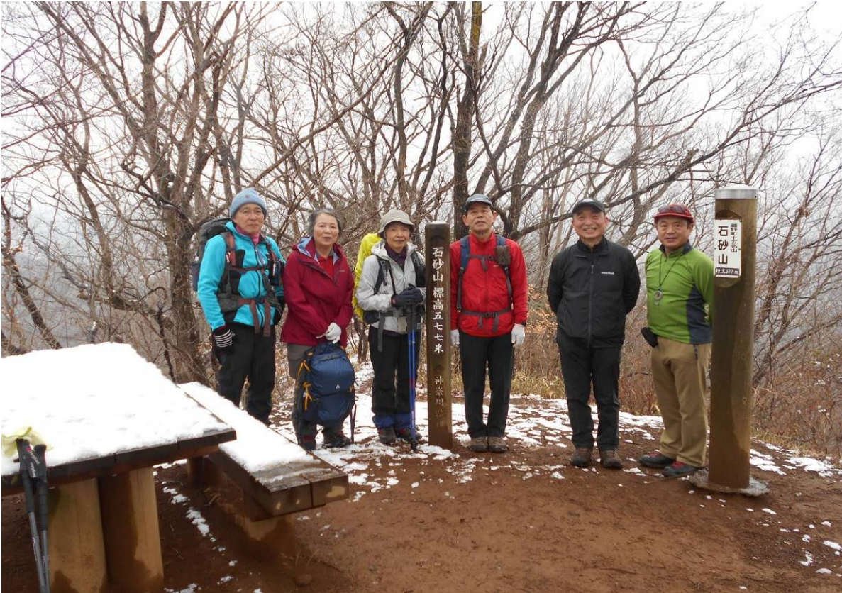
石砂山山頂 今日初めての登山者に会い 写真撮影を依頼した、この場所で昼食タイムを取る予定でしたが、小雪が舞いだしたので、早々に下山を行った。