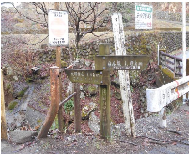
分岐には標識があり迷う事は無い