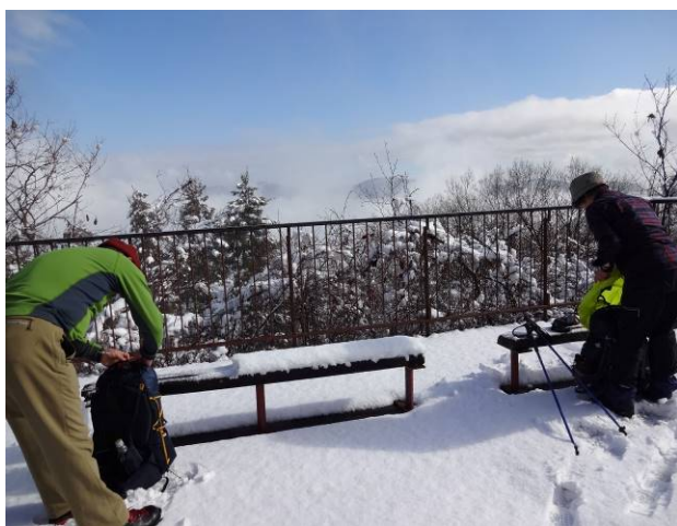
大明神山展望台昨日の雪が6-7cm積もっていた 遠くの景色が美しい