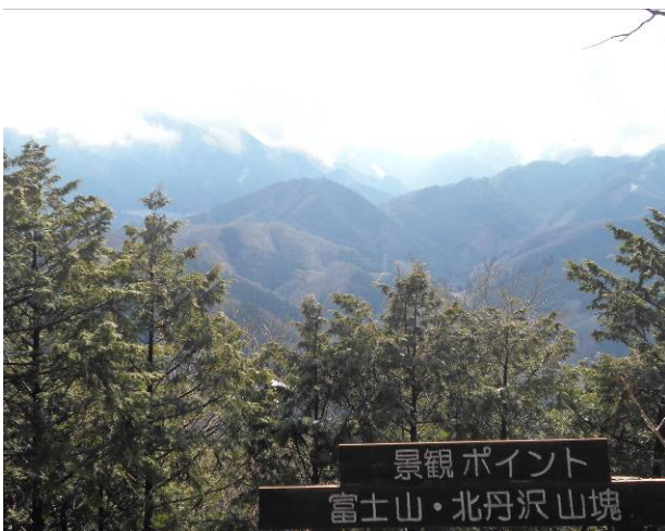
景観ポイントですが曇りの為 富士山は見えません