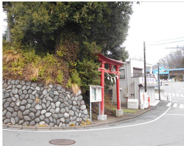
プレジャーホレストバス停より出発した、