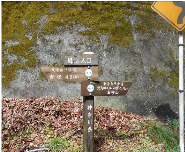
峰山入口に到着ここから急な舗装路が始まる