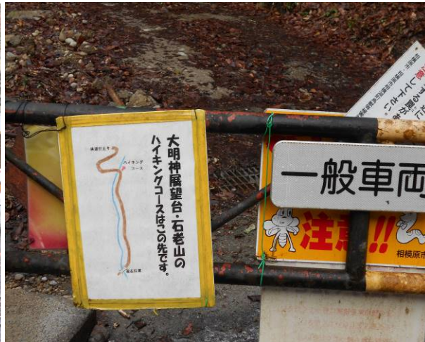
ここが林道の入口 ハイキングコースに崩落個所の表示があった