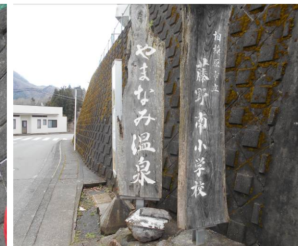
やまなみ温泉バス停に到着 温泉は4月1日まで臨時休業中