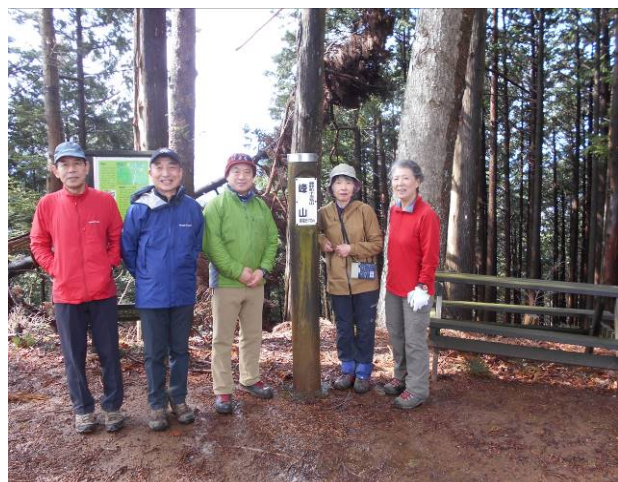
峰山での記念撮影です だれも居ないので 交代での撮影