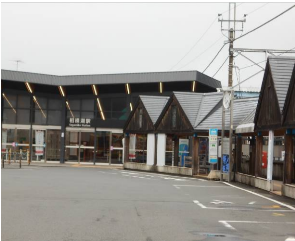
相模湖駅ですが人がいません 1番乗り場の三ヶ木行きのバスに乗ります

今回の山行は、石砂山を中心に相模湖駅より藤野駅までの縦走が目的で計画をしたが時間の関係より相模湖駅からプレジャーホレストとやまなみ温泉から藤野駅はバスを利用した昨日の雪の影響で登山者は、いなかった 大明神山までのルートは去年の台風の影響で道が荒れていた、又2か所の崩落箇所もあるので、利用には注意が必要。