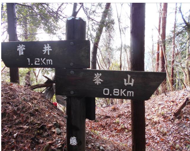
分岐後の標識ここから先急登が始まる