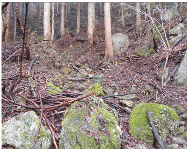
ここからが本格的な登山道