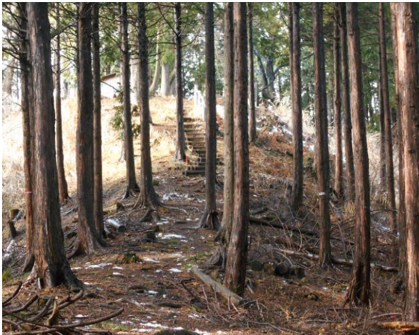
ここが峰山への最後の階段