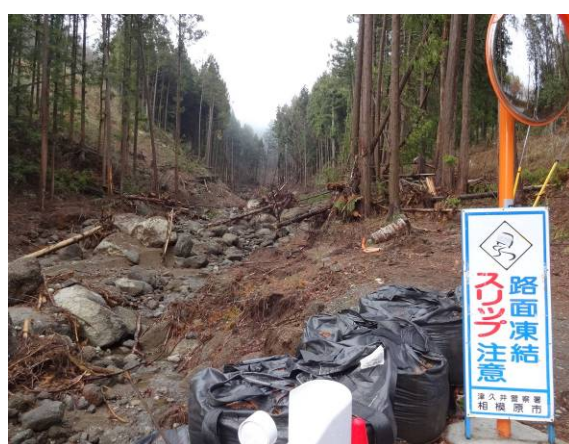
去年の台風につめ跡 被害が大きい