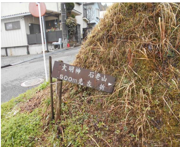
民家道路わきに標識がある