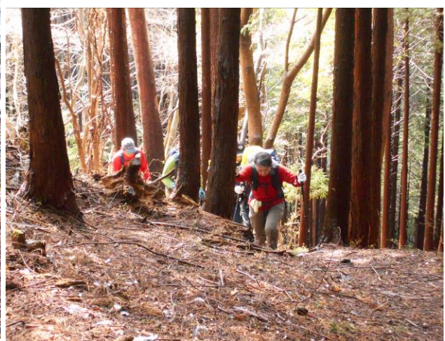
人口林の直登コース