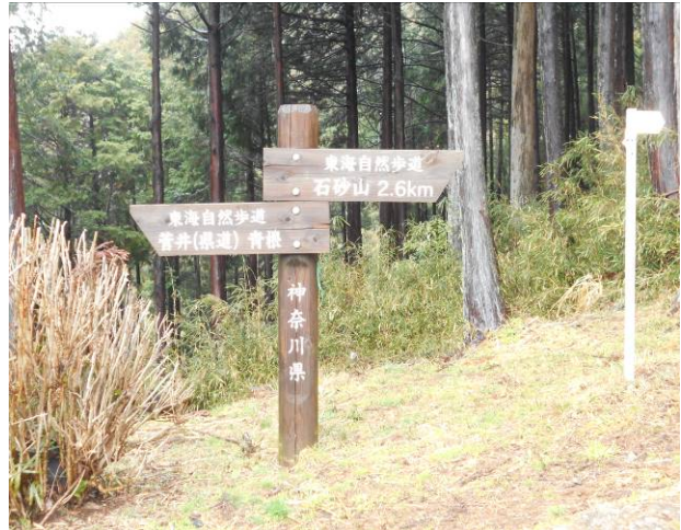
菅井集落にここから峰山入口までの間はルートミスをしやすいので、注意が必要