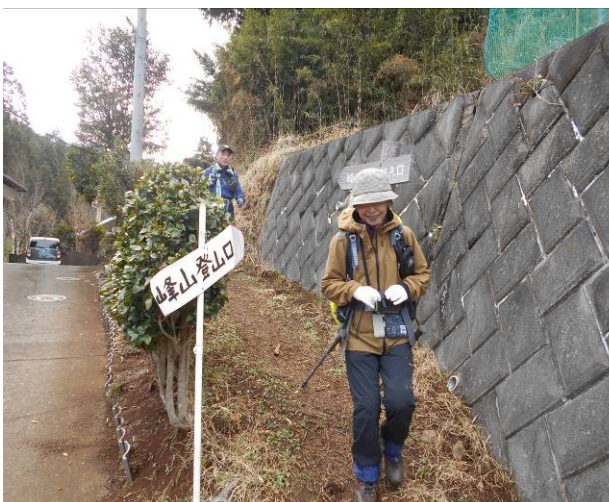
峰山登山口に到着