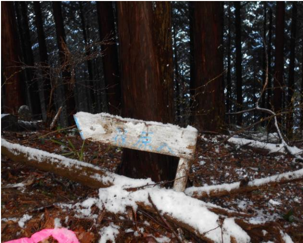
篠原バス停への下山道入口 小さな標識があった