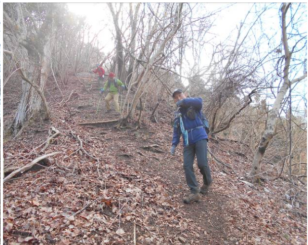
峰山よりの下山雪の為湿っていて滑りやすく又急な下りの為立ち木につかまり降りた