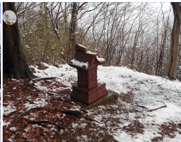
大明神山山頂 小さな祠が