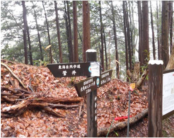
伏馬分岐 本来は菅井方面に行くのですが 登山口方面に誤って進み間違いに気づき戻った