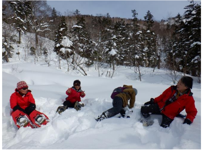
よいしょ！どっこいしょ！