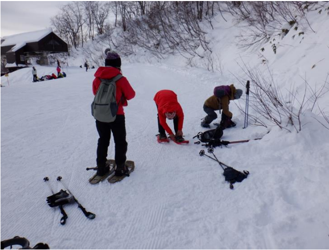
ゴンドラリフトイブで柵の森迄20分の 空中散歩。直ぐにスノーシュー装着