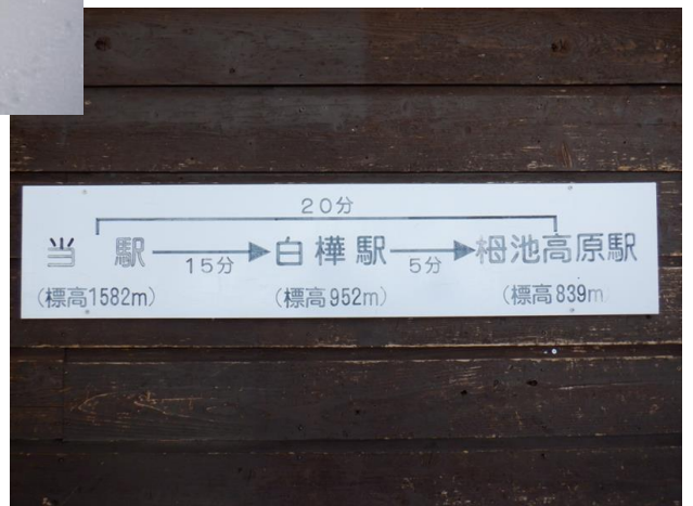
1582mつがの森での雪遊びの半日でした