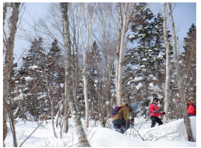
天気予報に反して青空も見える。