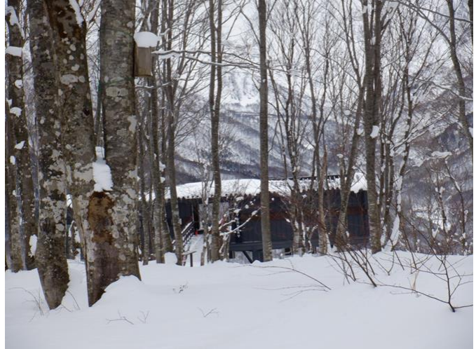
此処までパンを買いに来る程人気 が有ると言うパン屋さん