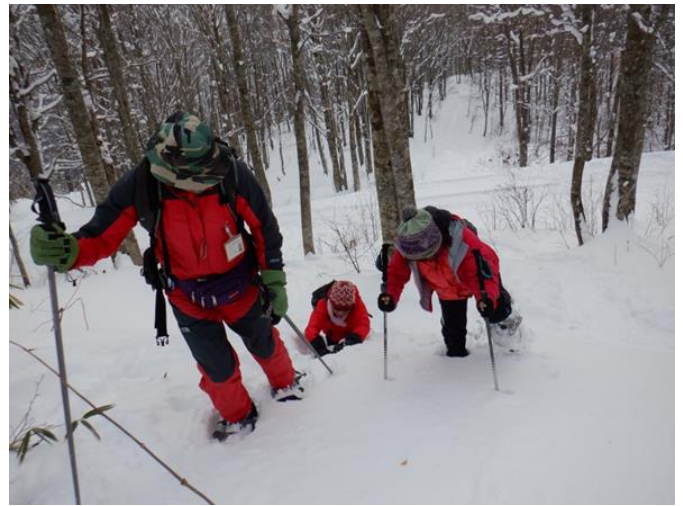
登りは辛く…失敗…深く潜りました