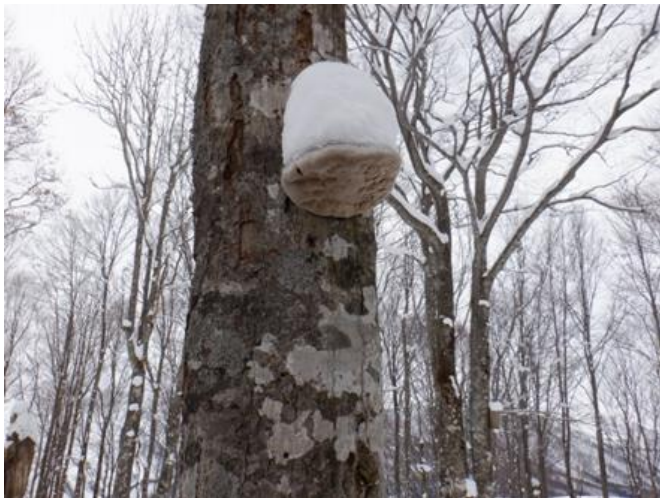
雪帽子を被ったサルノコシカケ 一時期癌に効くと大流行りだったが・・・