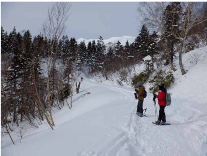
林道に降り立つと白馬鑓（中央）がくっきり見えた。