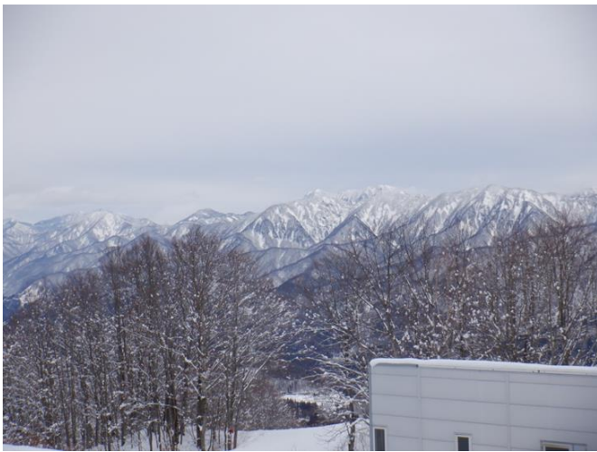
直ぐにガスが切れ、眺望が良くなった