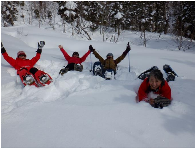
ポーズ間違い一人。すぐには直せず