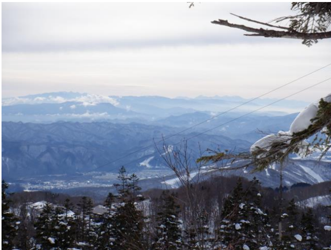
写真では解かり難いが、左端八ヶ岳