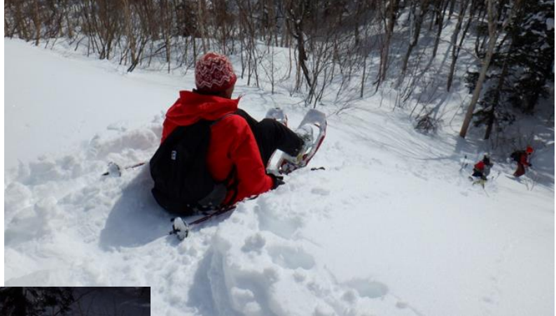
意を決して尻シェードスタート！