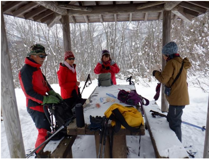
あずまやでホットタイム