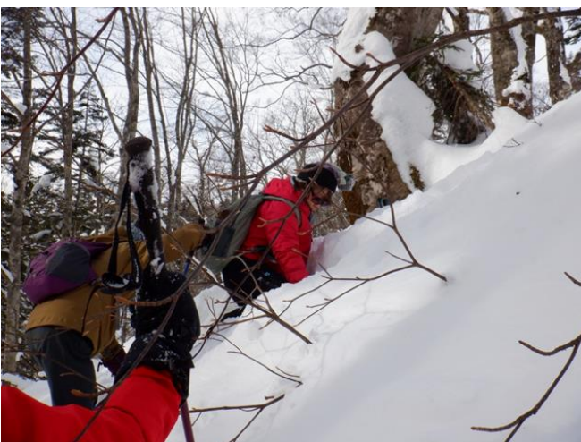
潜ると立ち上がるのは大変です