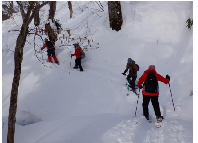
ガイドさんに付いて行くので誰も居な くても安心です