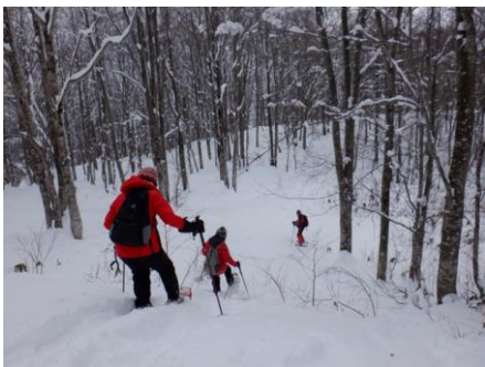
下りは登るより怖い