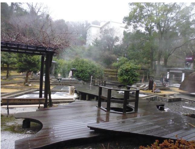
独歩の湯 足湯を楽しむ