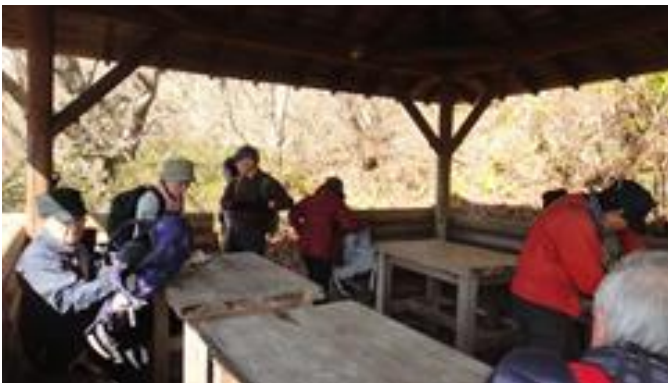
あずまやにて休憩