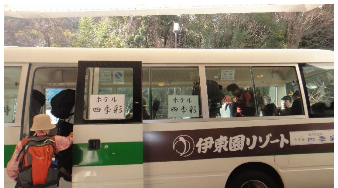
旅館前から湯河原駅へ