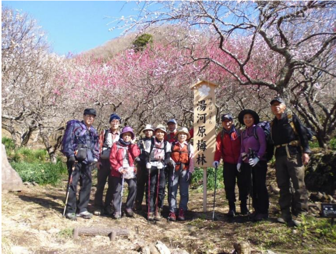
幕山公園内での集合写真