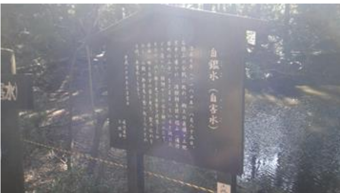
自鑑水のいわれを書いた看板