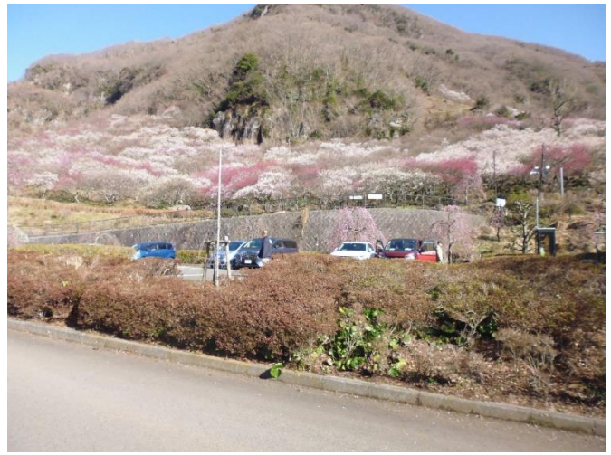
梅はすでに7分咲きです