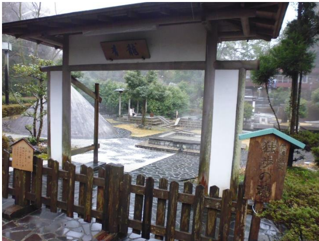
万葉公園内 独歩の湯入り口