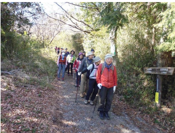
まもなく一般道 長い降りが続く