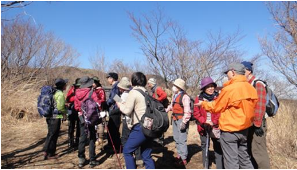
南郷山山頂 女性4人Gと一緒に なり、会に入会しませんかとPR