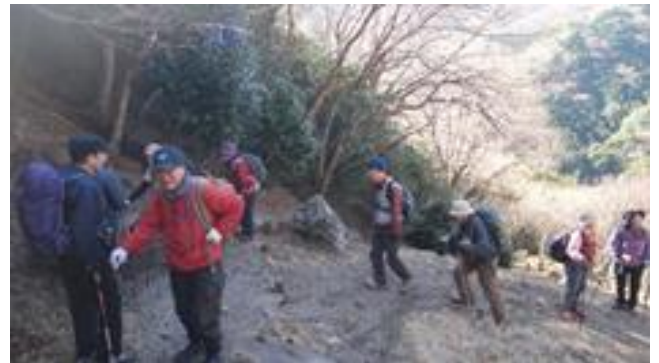
あずまや手前の登り