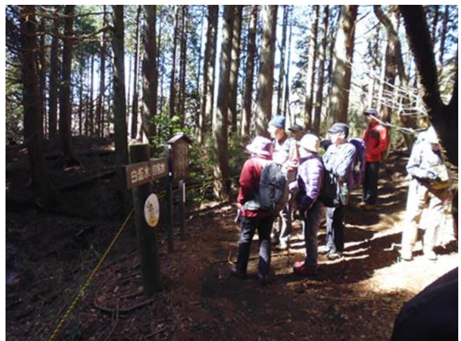
池を眺めてい皆さん