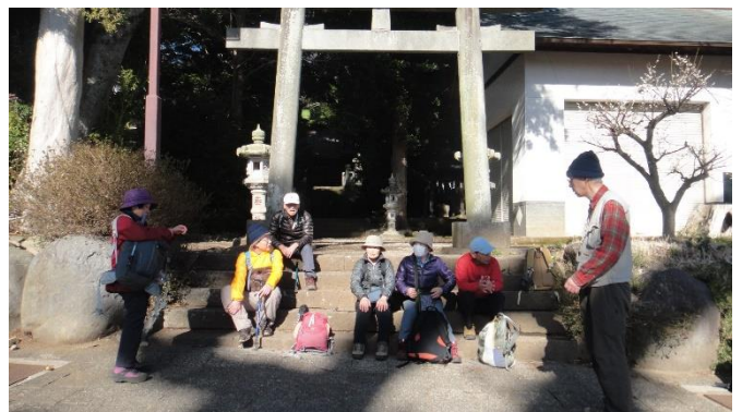
鍛冶屋バス停前（五郎神社） 30分ほど待つ湯河原駅へ