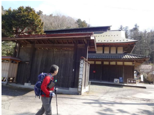
平井橋たもとの久保田酒造へ降り立つ