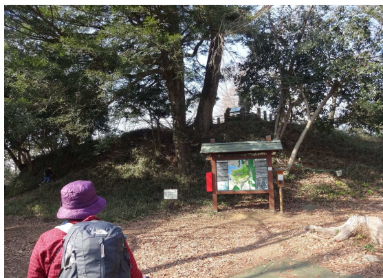
城山山頂(本城曲輪)へようやくたどり着いた