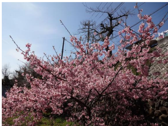
日溜まりの早咲き桜は今は満開