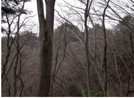
ギザギザに尖っていた大山三峰を振り返る