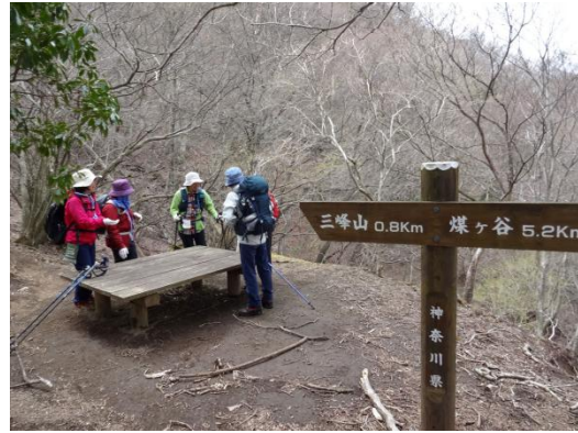
緊張感から解放されてしばし休憩