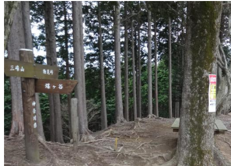
この注意の看板は登山道入り口にも設置すべきでは？。物見峠へのトラバース道は廃道になっていた