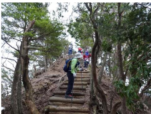
アップダウンを繰り返してさらに先へ 丸太の階段路でようやく一息つけたが