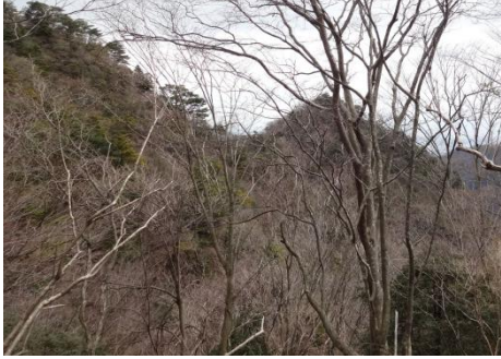
行く手には最初の三峰の一座、七沢山が見えている