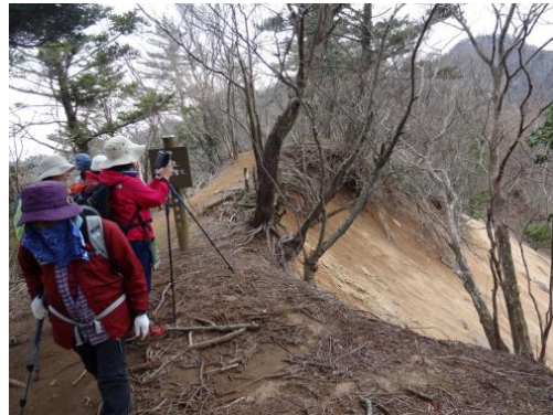
風雨にさらされ土砂が崩落してより痩せ尾根になってゆく