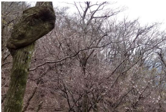
緊張感を和ませてくれたマメザクラ