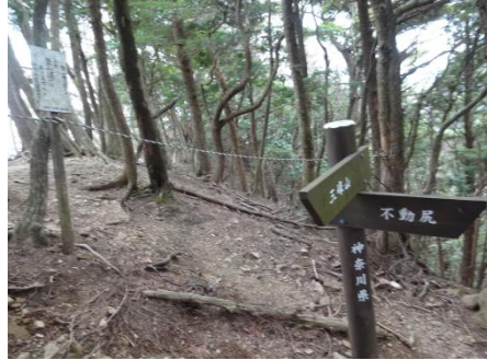
南峰の七沢山には今は山頂の標識はなし