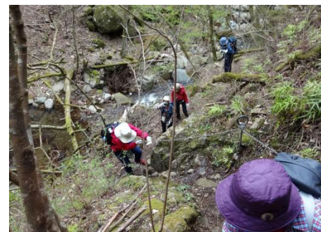
登り始めて1時間ちょっとで稜線へ出、ここでランチタイム