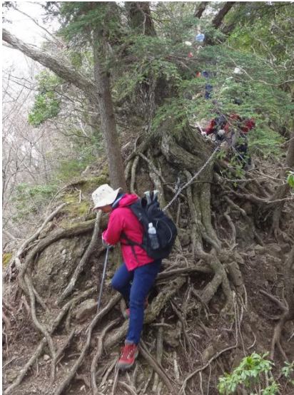
いよいよ三峰山への登山開始となる