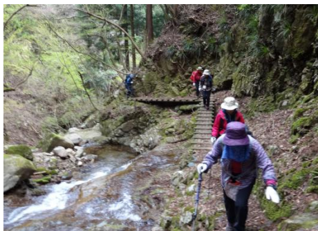
渡渉が一ヶ所あり

沢に沿っているでおかしいと思った時には時すでに遅し、ショートカットして行くことに