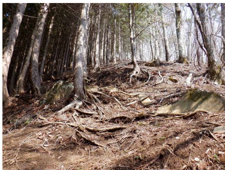
山頂直下の有れた登山道。