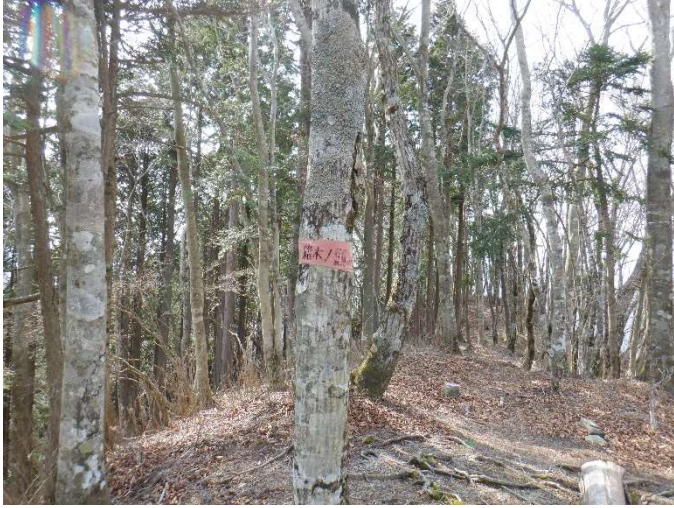
ブナの木に張り付けられた雑木ノ頭ガムテープ標識