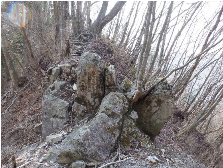
この岩は巻いても登っても良い。