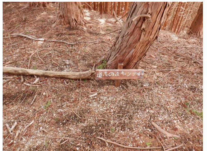
調子に乗ると直進する可能性あり。立ち入り禁止の横棒と小さな標識有り。