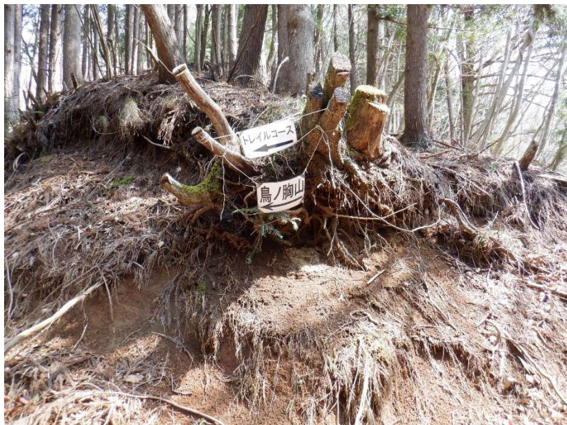
急遽作られた感があるノミネートされた紙の案内板。