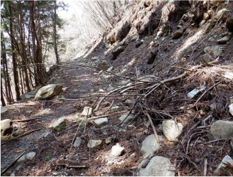
ゲートから直進の林道と合流する。