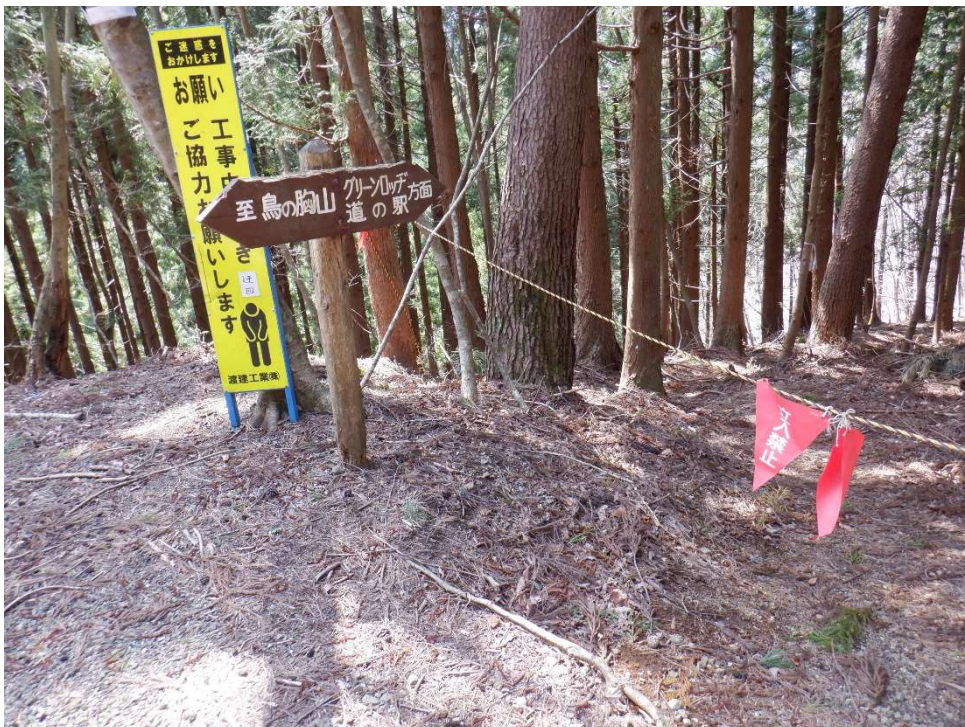
通行止めの登山道。