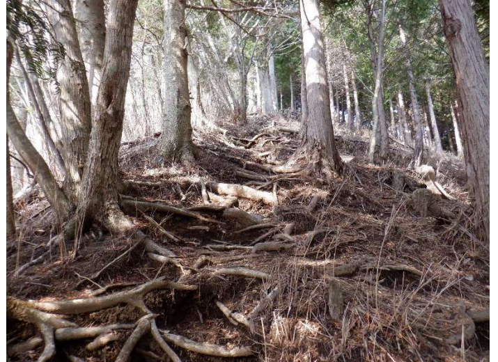
道志の森キャンプ場に向かう登山道