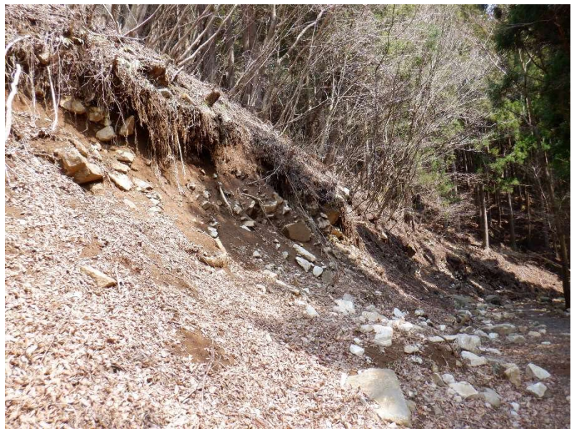
台風被害の大きさを感ずる。