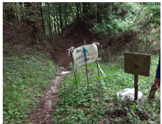
虎御前石ルートで足柄絵へ