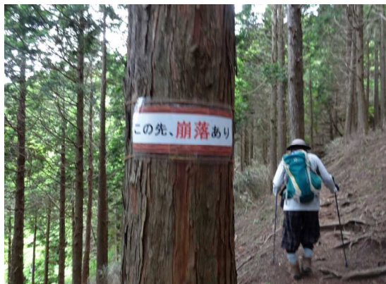
山伏平から足柄峠へ