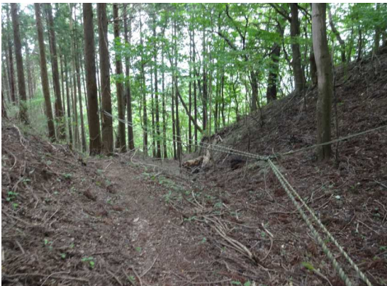
歩きやすい道である