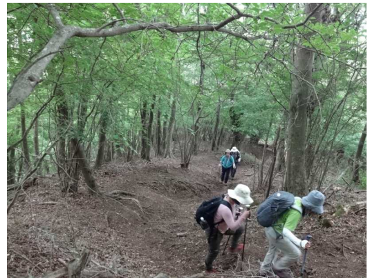
2 時間ほどで矢倉岳山頂へ