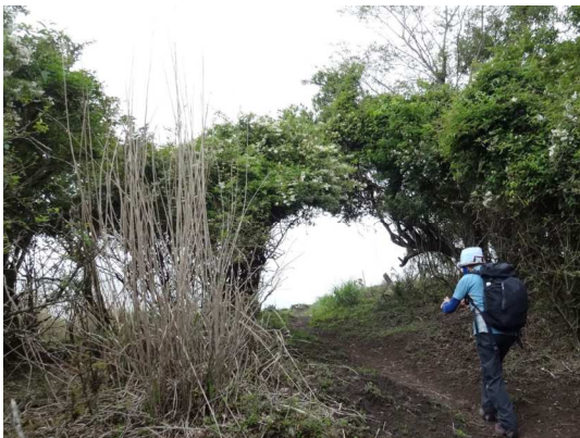
アーケードをくぐると