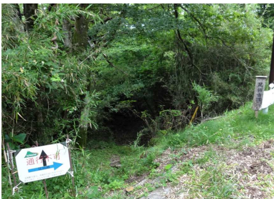
赤坂古道は台風の影響で現在も通行止め