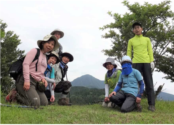
足柄砦、金時山をバックに