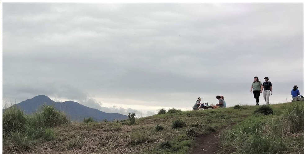
あいにくの曇り空で展望はイマイチで富士は雲の中