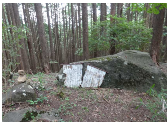
虎御前石に立ち寄り