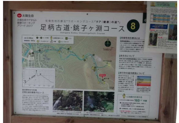
頼光対面の滝は時間的に余裕なく立ち寄らず