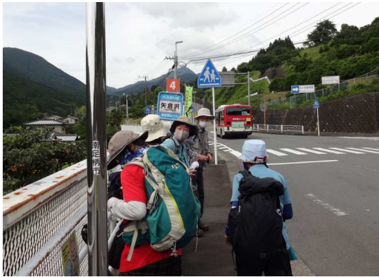
新松田駅からのバスは貸し切り状態