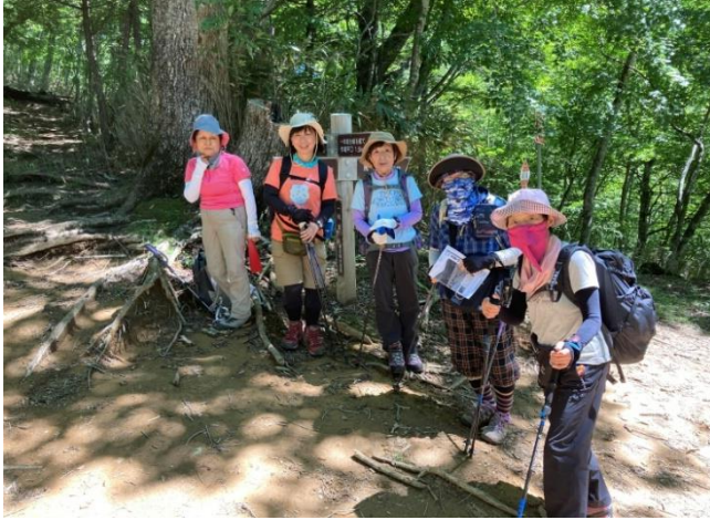
ヤブ沢峠にて 1 回目の記念撮影