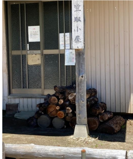
小屋の前は広く平坦です