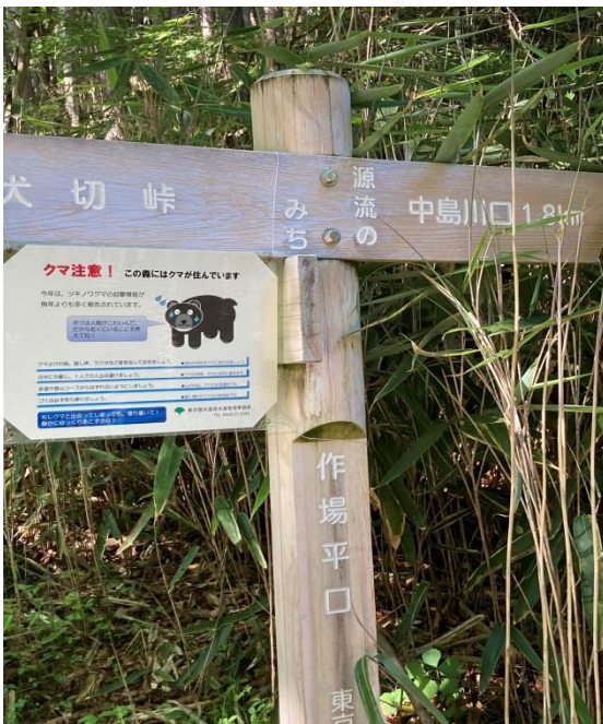
お疲れ様、ゴールです