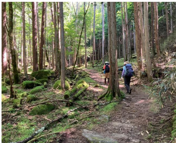
一休坂に向かう登山道