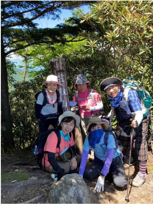
ここが 1953mの笠取山頂上にて