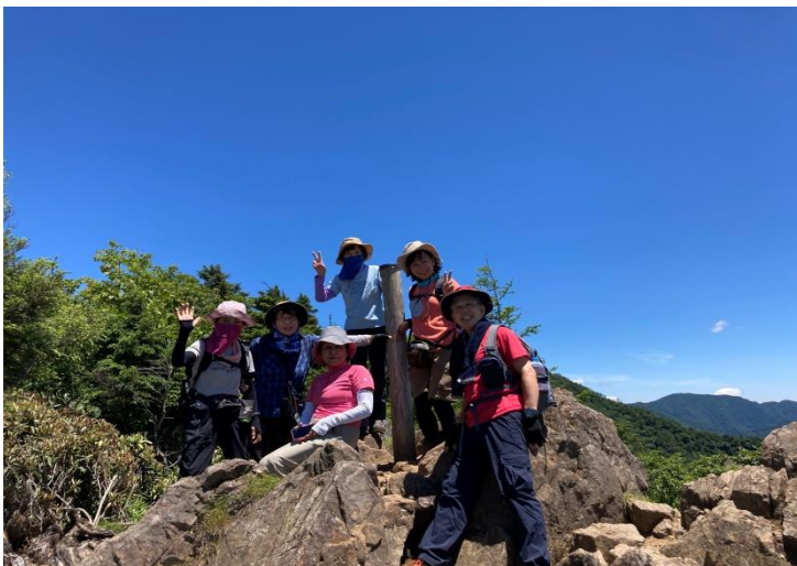
笠取山頂上にて(山梨百名山)