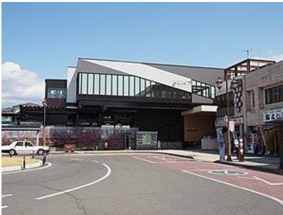
塩山駅も閑散としている

塩山駅はシーズンであれば、大弛峠や大菩薩峠に向け登山客で混むが、真夏の今はちらほらで、コロナ禍も災いしてる様子であろう