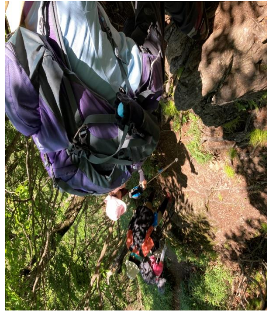
これは写真の間違えでなく急下降で下りです