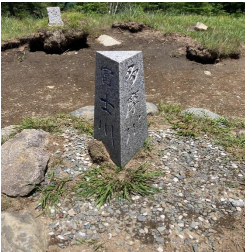
南は多摩川,西は富士川,そして 荒川へ雨滴が流れる分水嶺