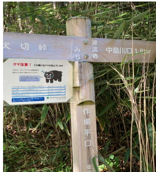
作場平口の登山口