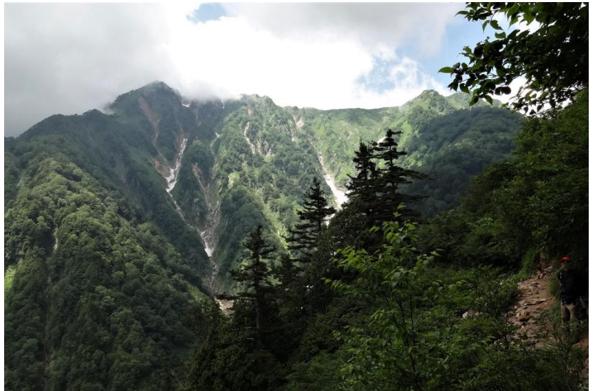
足場の悪い石畳がつづく