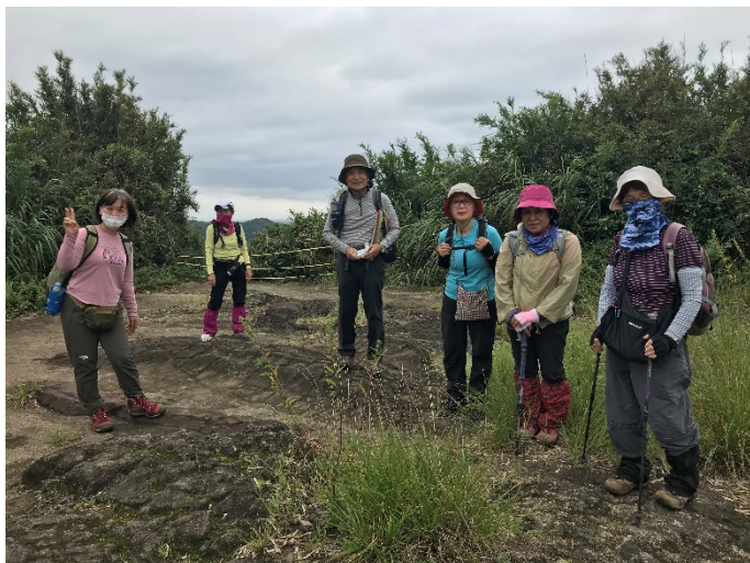
鎌倉カントリー前広場で ANさんがサプライズ合流