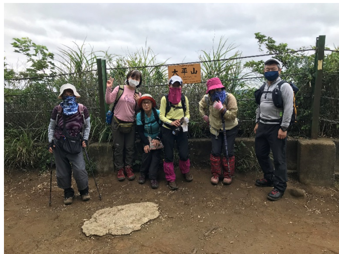
大平山で集合記念写真