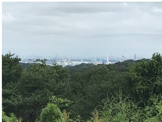
見晴し台から磯子方面を見る