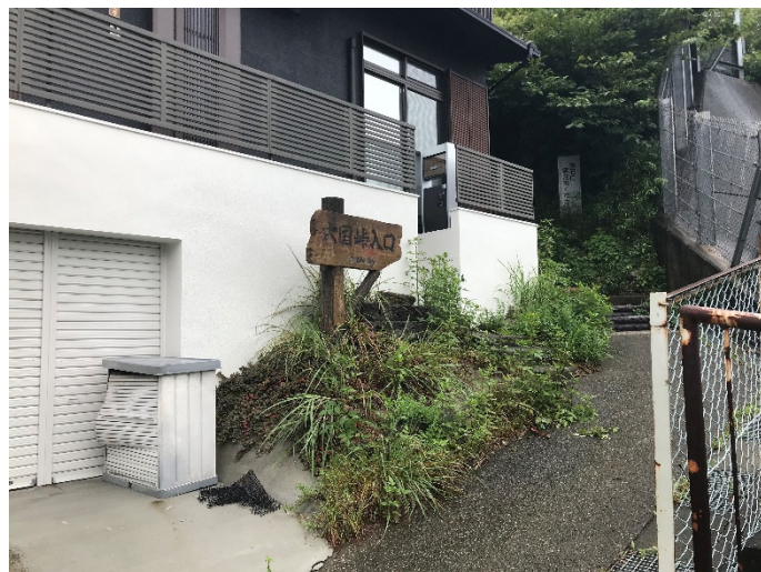
六国峠ハイキングコース入口