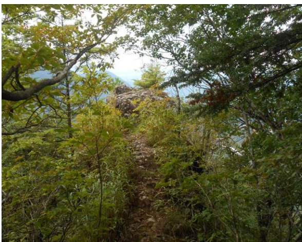
真っ直ぐは、展望台 場所が狭いので注意