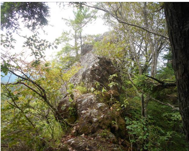
ここはめまい岩 この先へは行けない