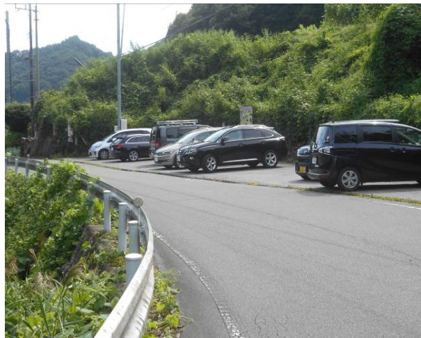
駐車場に到着 全て車は他県ナンバー