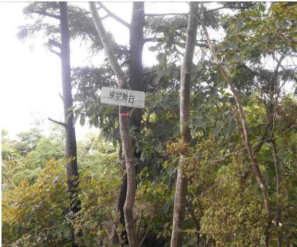
山頂手前の展望台