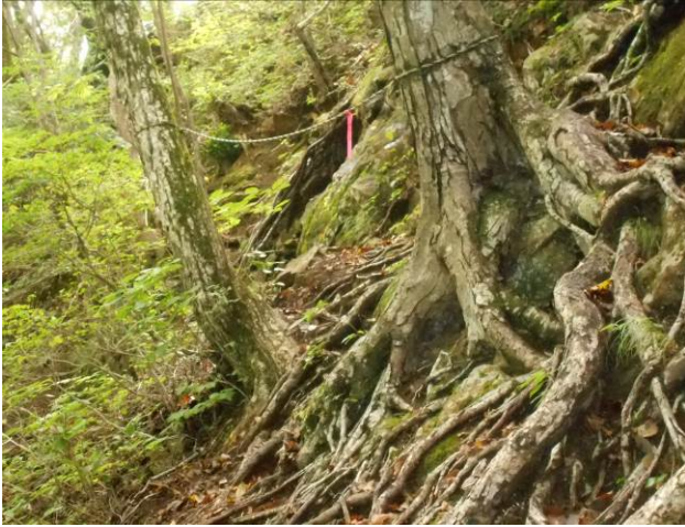
巻道を下から見た所