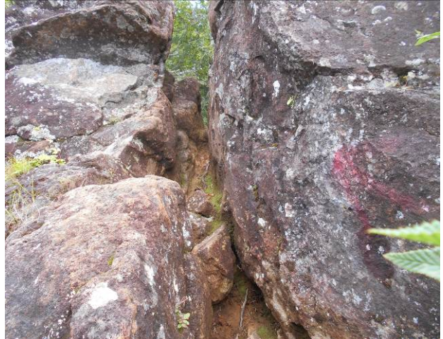
次は狭い岩の間を通過