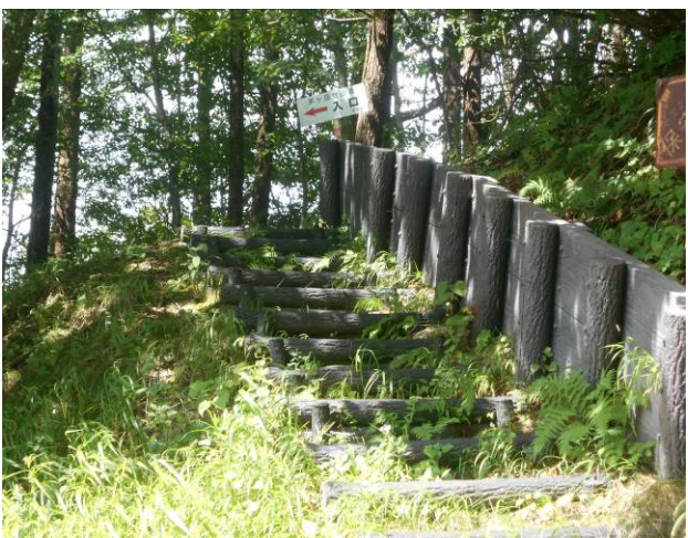
茅岳登山口 (この山もアクセスは大変)