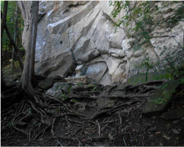
ここが鉄岩と思われる小さな祠が