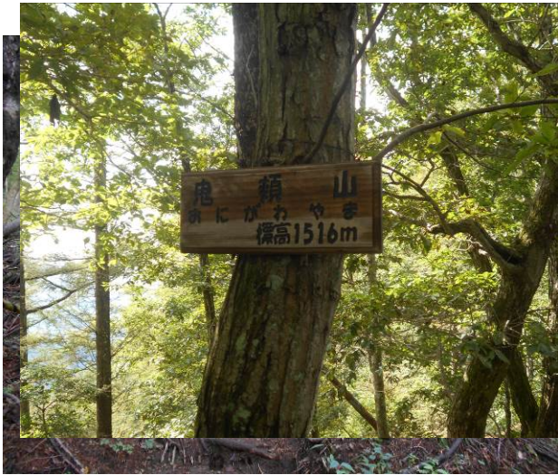
鬼類山 (おにがわやま)