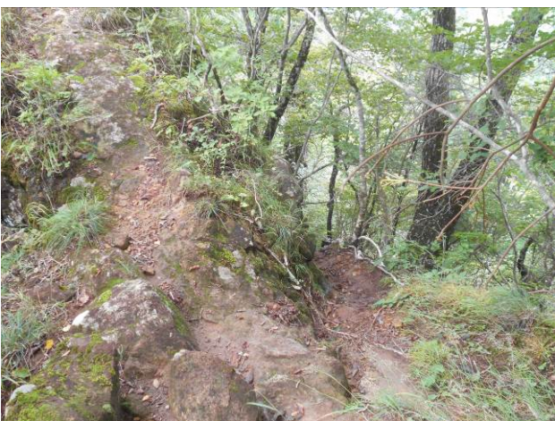
展望台手前を右側に降りる