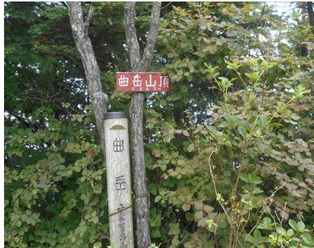
曲岳 山頂 場所は狭い視界は無い