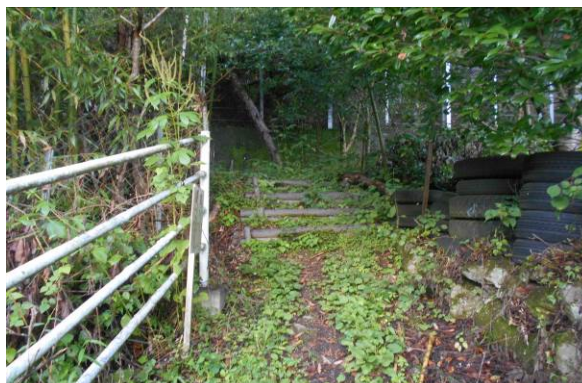
この先が登山道 すぐ先に鹿柵がある