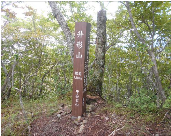
升形山 山頂実際の山頂は直ぐ傍の岩の上