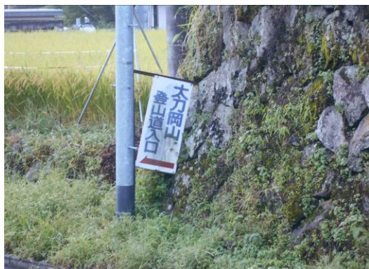
登山口 この先尾廃屋の間を

山梨100名山4座を歩く、登山口は韮崎インターより車で30分観音峠方面に行くと道路脇に太刀岡山登山用駐車場がある 約10台位のスペースがある、そこに駐車朝早いのでまだ一台も駐車していない、登山口は駐車場より50m位戻った場所に大きな看板があるそこから山道までの間は道標があり民家(廃屋)の脇を抜けた場所で、鹿柵の扉があり底から入る、入り口に熊、イノシシに対する注記がある、道は人口林の九十九折でかなりの急登です、鉄岩まで続く、そこからは自然林で尾根分岐までは、緩やか登り、分岐点には大きな岩があり、ロッククライミング用の金具が岩に取り付けてある、ここから太刀岡山までは、狭い直登で急な登りが続く、山頂では、富士山方面に視界が開けている、ここから黒富士岳までは、尾根道ですが途中の鬼類山まで最初は緩やかな尾根道でしたが、すこし手前からは、標高差250m直登の急な道となる、トラロープが張ってありそれを頼りに上った、その次に標高差100mの登りが続いた、八丁峠までの道は緩やかな登りとなり、クマザサが綺麗な場所を通過し八丁峠に到着、ここから黒富士岳に向かう、道標では20分との表記、最少は緩やかな尾根を下りその後山頂に向け、登り返す山頂は狭く視界は良くない、ここで本日初めての登山者に出会う、次の升形山へ向かう、一度八丁峠へ戻り分岐を曲岳方面に進む約10分位の場所が升形山への分岐点で、この山へのルートもほぼ直登のルートで山頂は岩で狭いが、視界は良い山名標識は一段下がった場所にあった、ここには3名の登山者がいた、分岐点まで戻り今回最後の山曲岳に向かう、曲岳直下までは、緩やか尾根道で、歩きやすいが、直下は他の山と同様で、直登で急な登山道です、山頂の手前に展望があり、朝付いた駐車場方面が良く見えるここからは、山頂までは数メートルで到着、この山名標識は他の山には、こうふ開府500年記念の標識は無かった、ここが今日最後の山なので、昼食タイムを取った、ここから観音峠方面に下山をしたがこのコースは、途中に鎖場やロープの有る場所があり めまい岩の通過には、注意が必要でしたその後観音峠 曲岳登山口に到着、ここからは車道歩きとなる、約5分位下った場所に茅ヶ岳登山口があった、駐車場まで車道を約1時間歩く、駐車場には10台位車があり全てが他県ナンバーの車でした、今回のコースは 甲斐市観光協会の関連もあり、コースにはピンクリボンが沢山あり道迷の心配はないが、コースは一部荒れた箇所もありました。自然林のコースで新緑や紅葉の季節には、良いハイキングコースです、但しアクセスが悪いので、移動には車が必要。