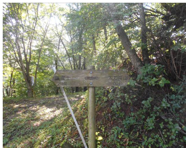
越道峠 黒富士まで2時間