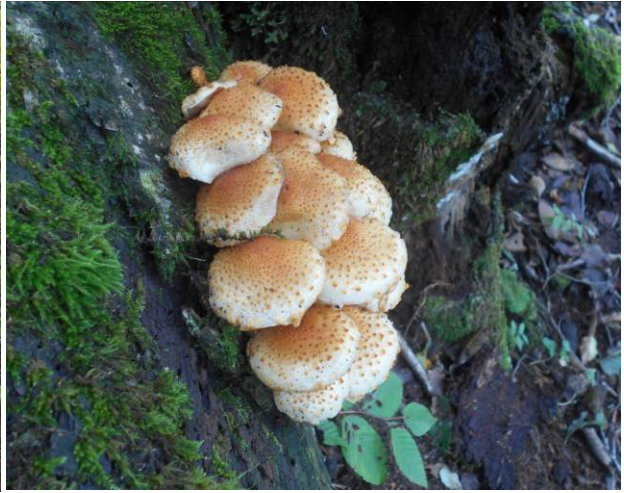
キノコの群生地 食べられるキノコであれば沢山収穫できる