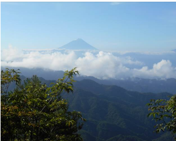
太刀岡山よりの富士山