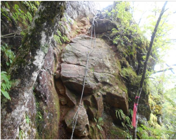
展望台の岩を巻く