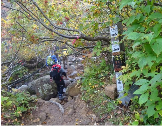
渡渉点2 三途の川 渡り難く慎重に渡る。