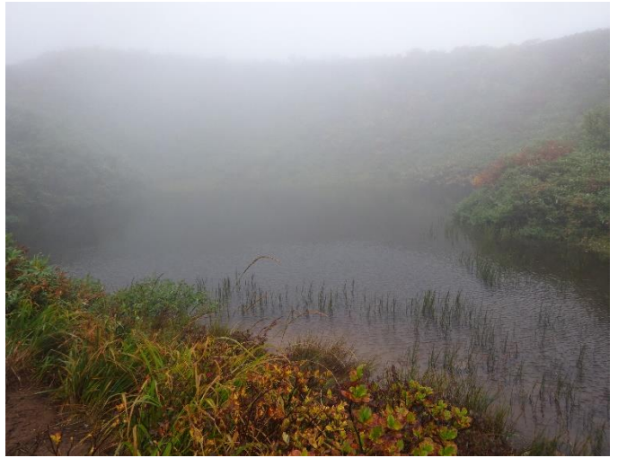
うぶ沼 小さい沼だ あと300m登る。階段、泥濘が多い。