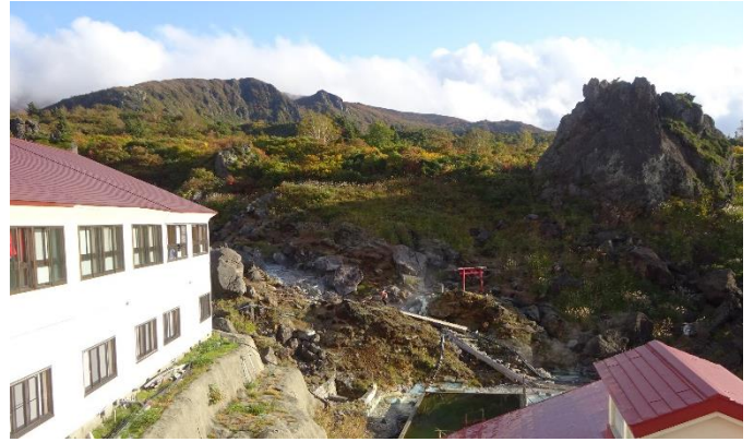
3階窓からの眺望 （後方）栗駒山、（中央）温泉源泉、（右）大日岩