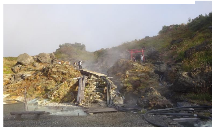
早目に出発。源泉脇から登山道に入る(写真は前日) うぶ沼コースを500m登る。