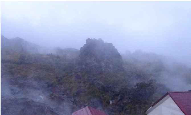
翌朝、天気予報から「晴」の文字が消えていた。