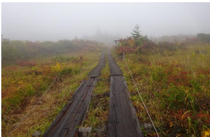
すっかり草紅葉の名残ヶ原 ガスってきた。雨具上着を着る。