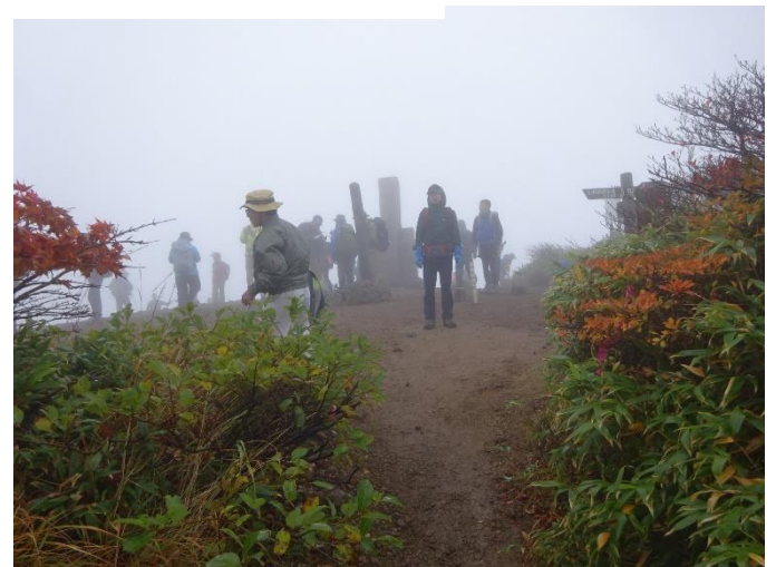
山頂に到着。既に多くの登山者 濃いガスと冷たい風。眺望全くなし メガネに水滴が付く。見えにくい。