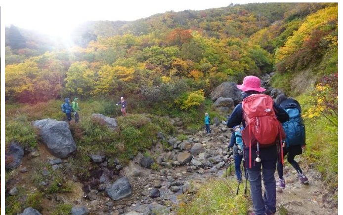
渡渉点1 セッタの渡り 山北側のカラフルな色彩の紅葉が下りてきている。