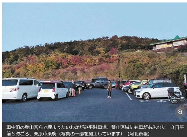
車中泊の登山客らで埋まったいわかがみ平駐車場。禁止区域にも車があふれた = 3日午前5時ごろ、栗原市栗駒（写真の一部を加工しています）