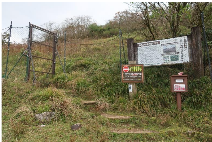
東登山道コース入口