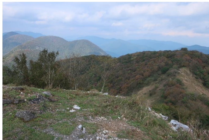
駐車場から北アルプス方面を見る 晴れ渡れば、右は御嶽山、 中央は北アルプスの山々、 左には加賀白山が見えるらしい