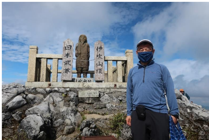
山頂 日本武尊の像