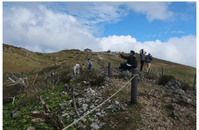
もう山頂が見えた