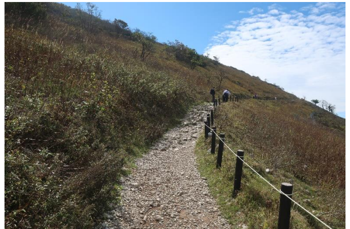
整備された登山道