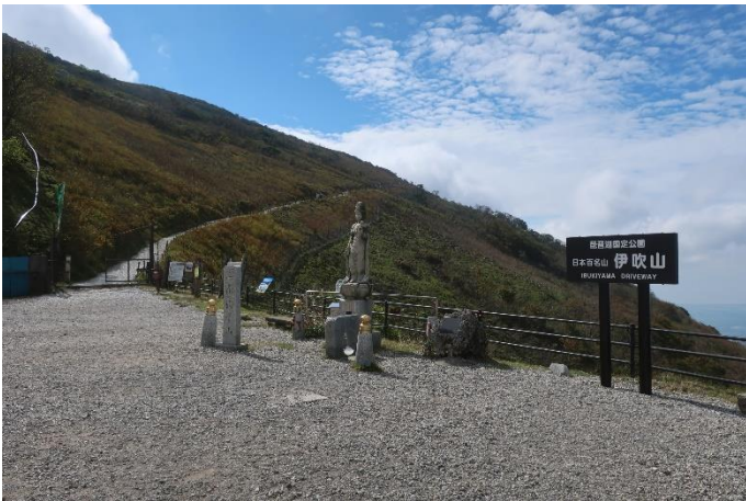
西登山道コースへ出発

駐車場から小一時間とお手軽に行ける印象の伊吹山である。しかし、関東に住んでいるとなかなか行けず、今回、貴重な機会を得た。JR 大垣駅北口でレンタカーを借りて西に向かう。関ヶ原古戦場の辺りから北上して伊吹山ドライブウェイに入り、1 時間余りで伊吹山スカイテラス駐車場についた。標高は既に 1260m。