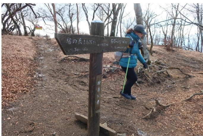
下りは小丸尾根経由です