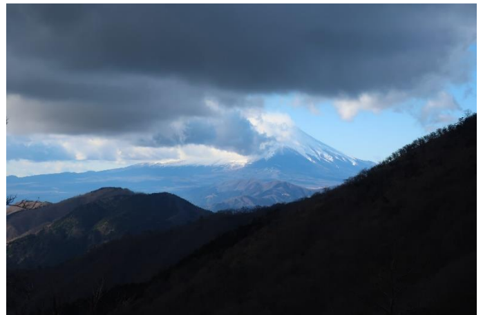
富士山は見えるけど、なかなか雲が切れません