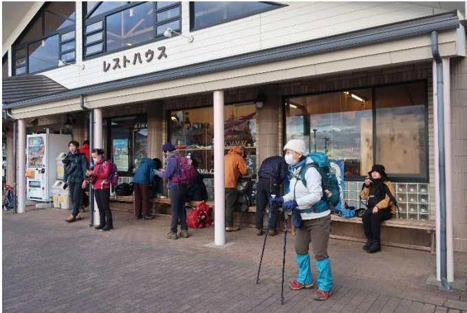
大倉を出発 気温は 4℃