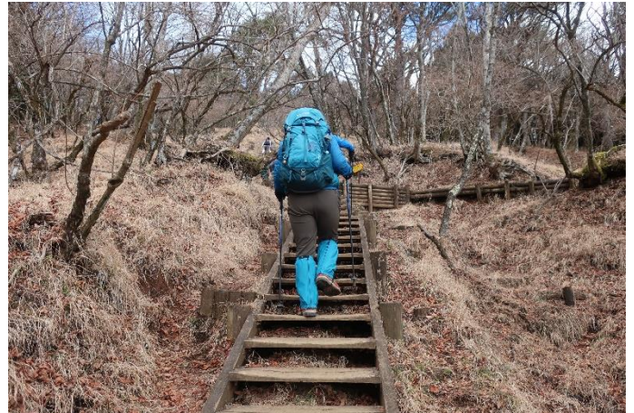
花立山荘を過ぎました まだまだ