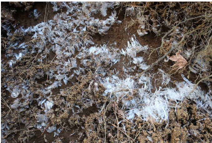
大分冷えてきたと思ったら、霜柱の花