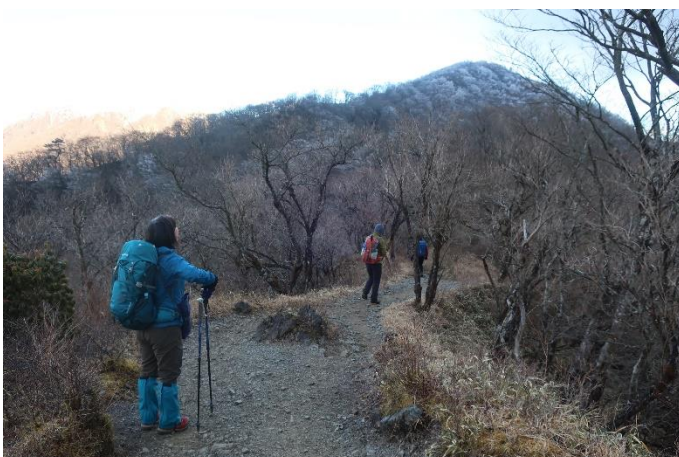
金冷し手前の尾根 山頂の木々には霜が付いています