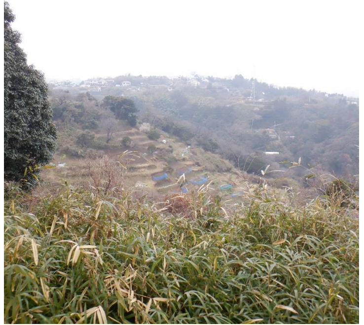
鹿島台に上がるが富士山見えず。散策を終わりにし田浦梅林に向います。