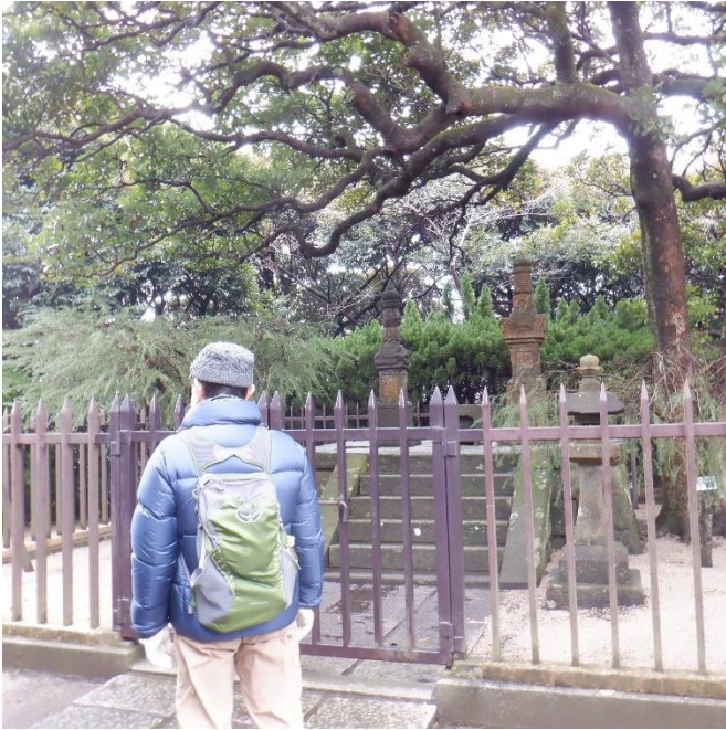
三浦按針夫妻の墓所