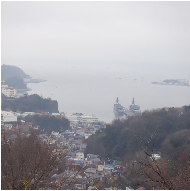
塚山公園内散策 見晴らし公園からは眼下に長浦港（？） 田浦の段々畑