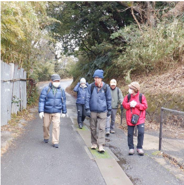
十三峠を目指し下ります。