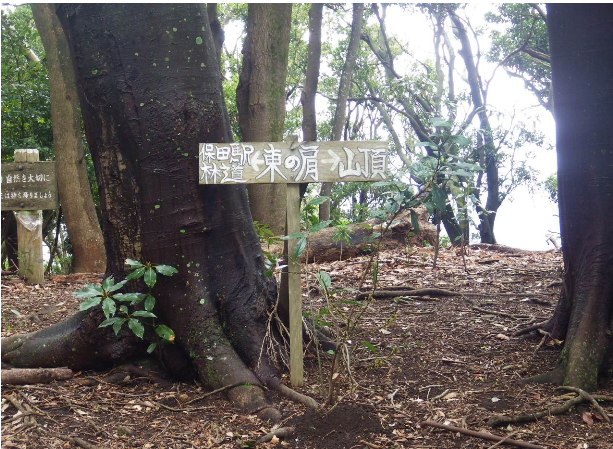
鋸山東の肩 ここで通常の登山道に合流（この場所にはベンチもあり良い休憩場所）