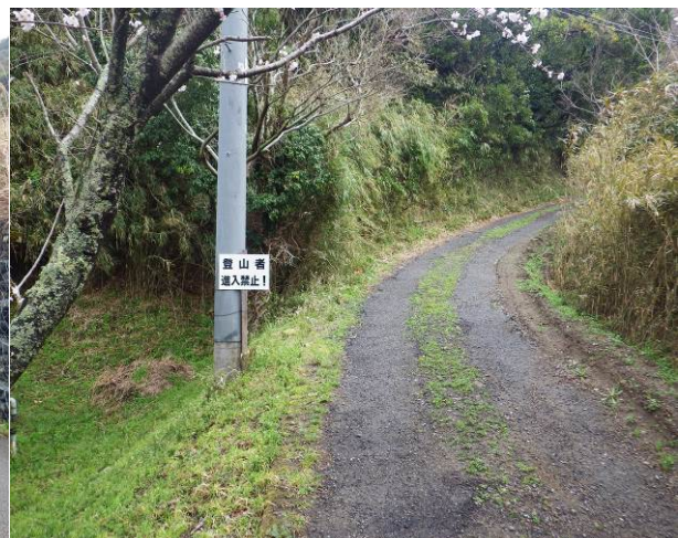
入口に登山者侵入禁止の標識