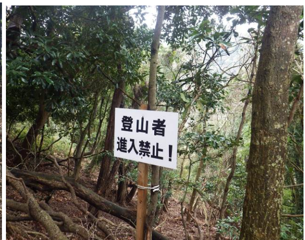
沢コースとなっているが 現在は通行禁止