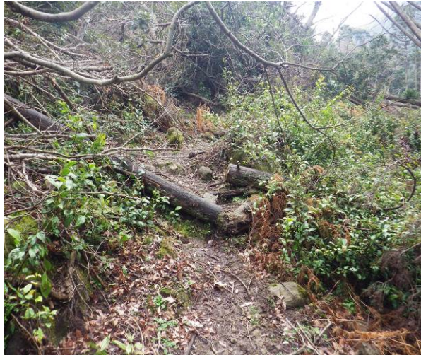
一部倒木の撤去も行われています。