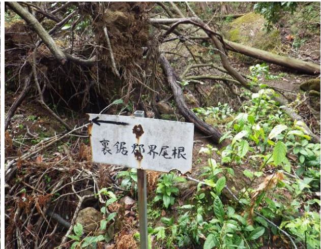
古い裏鋸境界尾根標識 この先に手掘りのトンネル入口