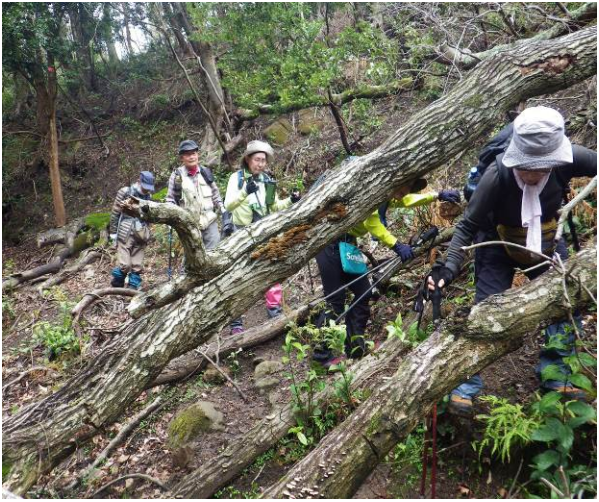
台風 19 号の影響で倒木で塞がれている