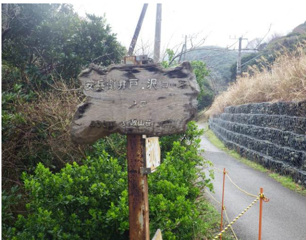
沢コース入口（保兵衛井戸。沢コース）

約1年位前に行った沢コース友人の案内で行くことにした、コースが短いので何時もより遅いフェリーで出発、平日ですが、乗客はかなり多くいた、浜金谷駅で身支度をして出発、沢コース入口には去年は、通行禁止の表示があったが、今回は無くなっていた、昨日の雨の影響で、コースは抜かるんだ、登山道の一部はイノシシが掘り返した後もありぬかるみがさらにひどい状態でした、倒木は相変わらず撤去はされていない、倒木の間、下を潜りながら進む、去年は途中より尾根に上がった為にもっと通行は楽であった気がする沢の終点より杉の倒木が多い場所になり、ここから先は、ピンクリボンが多く、取り付あるこれは去年の状態と同じです、通行する人は少ないので、登山道は柔らかく雨の後はぬかるみ、滑りやすい、沢終点より10分位の場所に、昔の標識で鋸山裏コースがありその先がトンネルの入口である、リボンが多く、取り付あるので、入口はわかる、トンネルは短い中は位、途中の横穴にはコーモリのいる、トンネルを抜けると杉の樹林帯になるが地面は赤土なので、滑りやすい、コースはリボンに従って進めば問題は無い、途中尾根に上がる部分でロープ設置個所が2-3か所あるが、ロープを使用すれば問題はない、尾根筋の上がりその先に高さ4-5m位の岩場があるが、ロープがあり、問題なく通過その後東ノ肩までは、急登になるが約10分位で東ノ肩に到着、ここまでがバリルートです、バリルートですが、リボン、ロープが、取り付あり、注意して通過すれば、問題は無いと思われ、登山者は少ないので、静かな山行が楽しめます、ここからの鋸山、車力道、観月台のコースは一般登山道なので、説明は省略します。