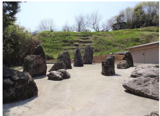
枯山水庭園が民家内にあり、つい引き込まれて 林道を上って行ったのがミス元