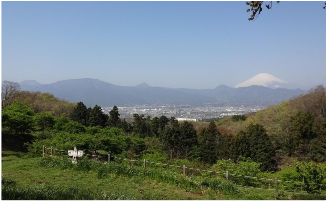
足柄平野が 眼下に