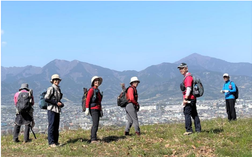
最後のピーク八国見山