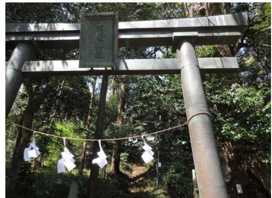
大井町篠窪集落の鎮守様三嶋神社