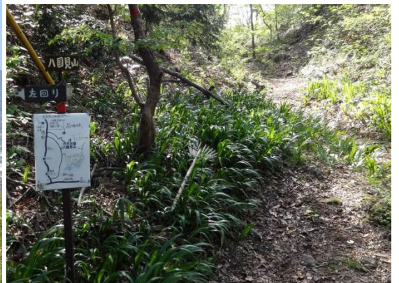
山頂の前には大規模霊園が開園していた