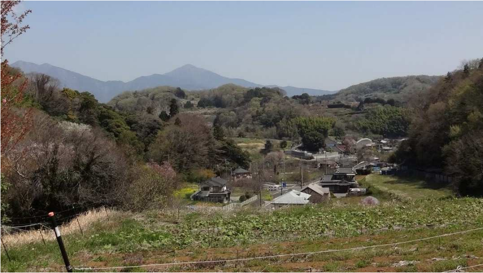
渋沢丘陵の向こうに 二ノ塔、三ノ塔、大山も