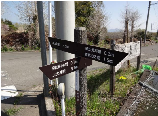
しだれ桜が満開に