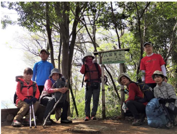
渋沢丘陵を降って一直線に渋沢駅へ