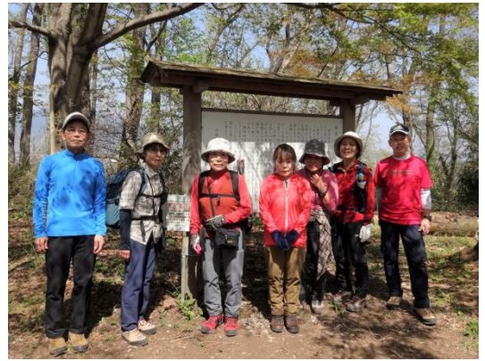
八国見山への途中で丹沢表尾根をバックで