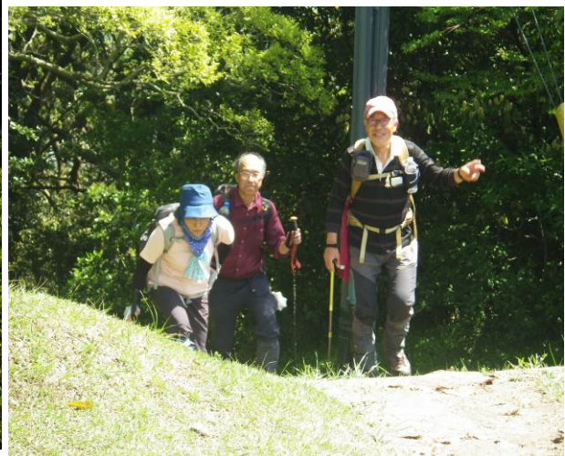
230 段の階段を登ってきた