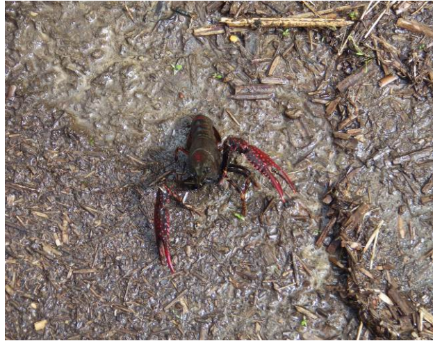
昨日の雨で池が増水しザリガニが 挨拶