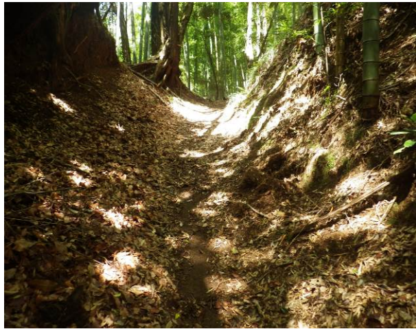
登山道は竹林の中の道