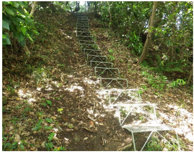
この階段の先が乳頭山