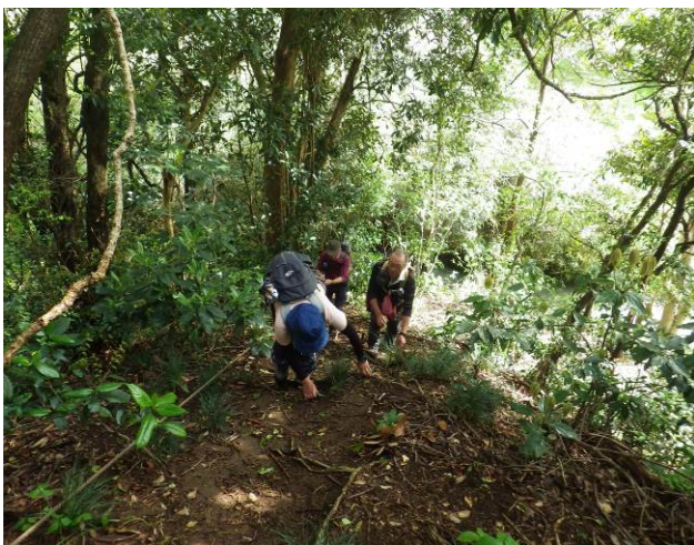
急な登り 雨上がりで滑りやすい