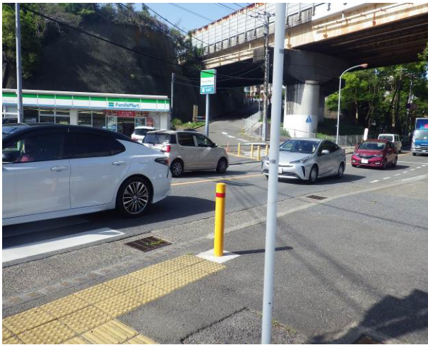
ファミリーマート奥へ進む