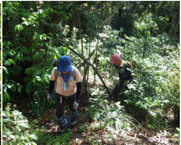
途中の分岐 通行止めの印