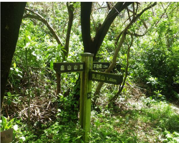
島山手前の分岐 乳頭山へ 1.4Km