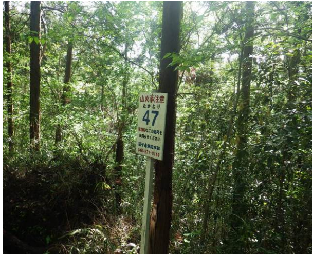
緊急時の連絡番号