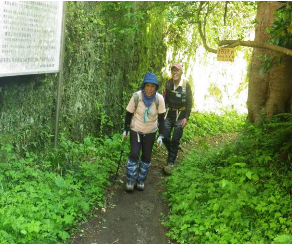
長い距離お疲れ様