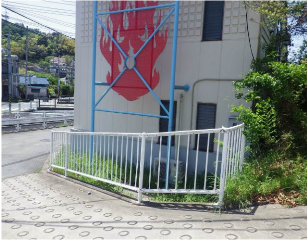
消防所の角に標識がある