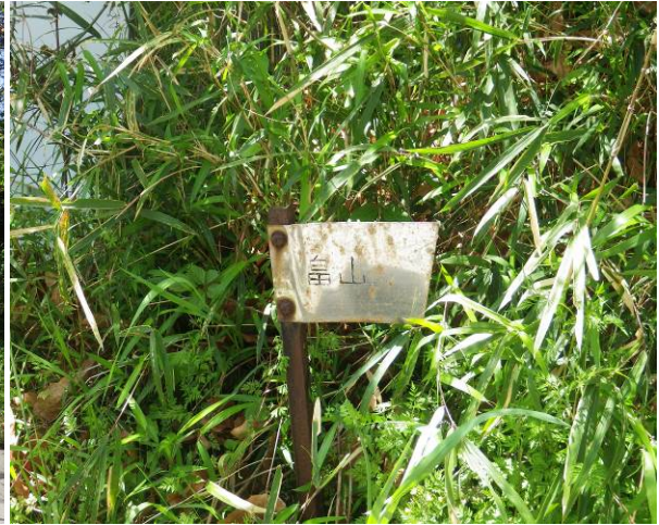
その標識小さいので見落としやすい