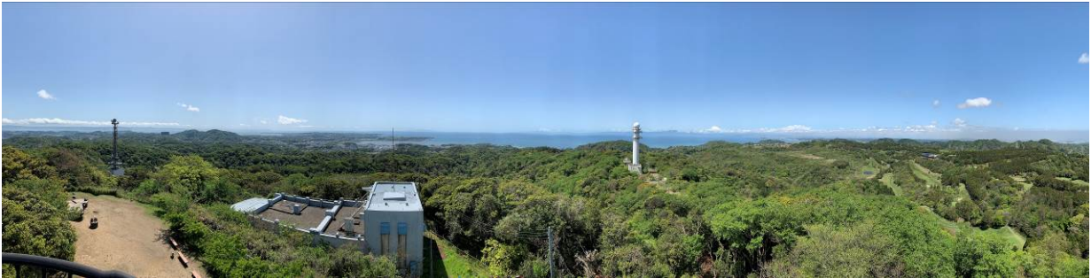
展望台よりのパノラマ写真