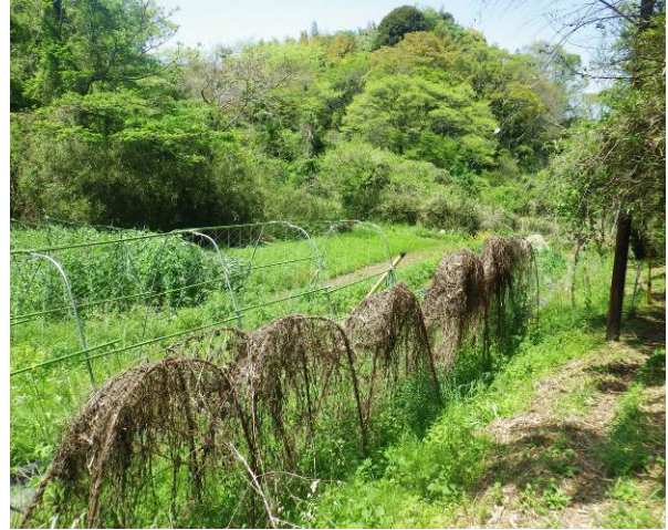
木古庭橋通過後の 畠山へのルート 入り口は個人住宅入り口となっていた