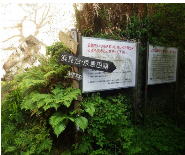
鷹取山 公園傍に到着