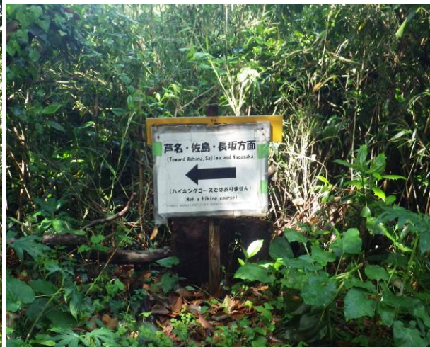
分岐のあった標識 長坂古道はハイキングコースでは無い