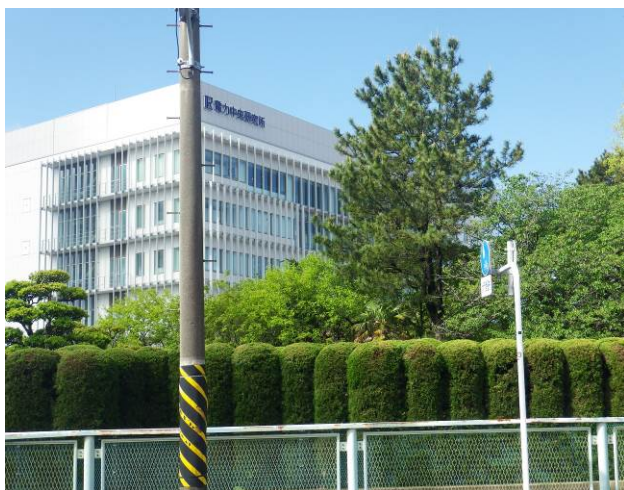
鹿島バス近くの電力研究施設

今回のコースは、大楠山コース、畠山・乳頭山コース、鷹取山コースの3コースを繋いだコースでコースの接続部分は市街地を通過する為地図読みが、必要となる、また一部不明瞭な登山コースとなる、スタートは鹿島バス停で逗子駅より長井行きのバスで長井の終点の手前まで約60分位かかる、ここから沢山池までは市街地をのため、標識は無い沢山池の先に棚田・長坂古道の標識があり、急な尾根を登る、昨夜の雨のため、滑りやすいので設置ロープを使って登る、尾根道を登ると長坂古道に合流長坂古道は一部狭い石の道で雨の影響で滑りやすい、長坂古道入口でこのコースはハイキングコースでは無いとの標識があった、大楠山へはゴルフ場の脇が登山道となっていて、急な階段を230段で大楠山に到着平日の為、登山者は誰もいなかった、展望台よりの景観は360度見え三浦半島、横須賀の町並みがよく見えた、ここから次の畠山へは、阿部倉温泉の市街地を通過する為、コースを探しながら進む、木古庭橋を越えてから次のコースの入口は個人住宅の入口と思われる個所からはいる、その後舗装道を進み消防所の角を曲がった所に小さな畠山の標識があり、住宅街の坂道を登って行くと、畠山登山口となりここからが次のコースの入口となる、急なぼりの登山道を約60分位で畠山に、ここで遅めの昼食タイムをとり次の乳頭山に向かう、このコースは急な下りや登りがあり、下りは足場が悪いので、注意がいるこの間は市街地への分岐が多くあるので、エスケープルートとして利用できる、乳頭山の手前は、急な登りの階段になり、登りきると乳頭山に到着した、ここには登山者が2名いた、本来は中尾根経由で東尾根に進む予定でしたが、時間の都合で直接東尾根に進んだ東尾根を、水道局配水場の少し手前で降り次の鷹取山へ市街地を進む、ファミリーマートの前を、住宅街方面に進むみ、住宅街の一番奥まった場所が、鷹取山への登山口となるここは鉄塔の巡視の一部となっている、鉄塔の裏を回り込み、急な下りを下ると、人家の脇を通る道になり、進と登山道となり、鷹取山への標識が出てくる、役30分位で、鷹取山の公園の傍に到着、ここで休憩をとり、下山し近くのスーパーで、ビールで乾杯をし、追浜駅へ向かった。コースは16.7Km、歩行時間は約7時間30分のコースです。