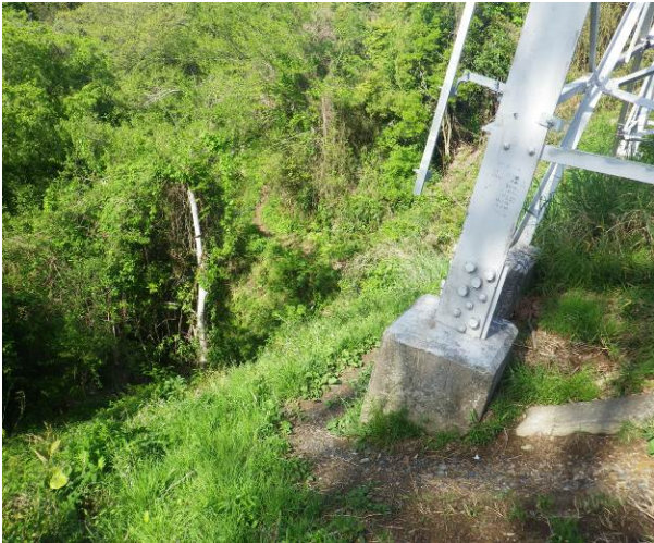
鉄塔裏の急坂を下る