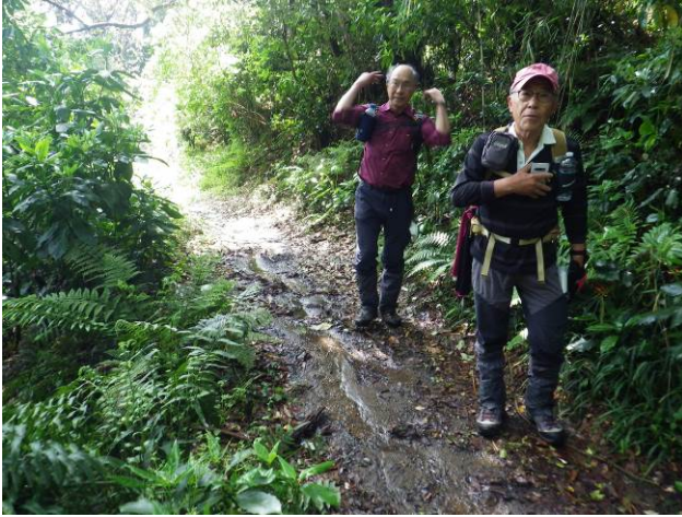
長坂古道 濡れていて足元が悪い