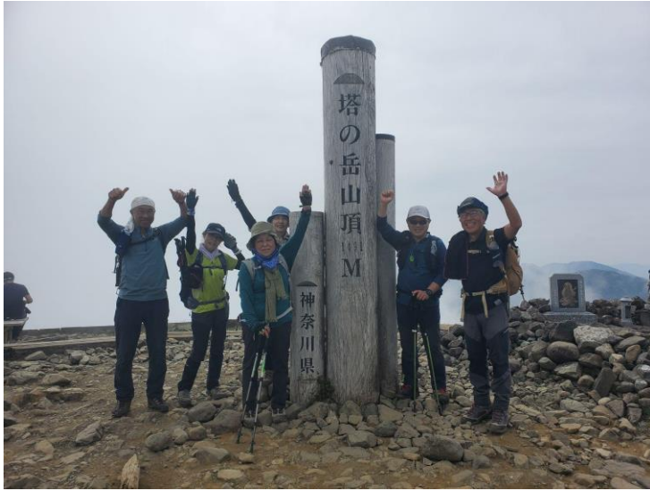
塔ノ岳に着いたころには視界はほとんど無し