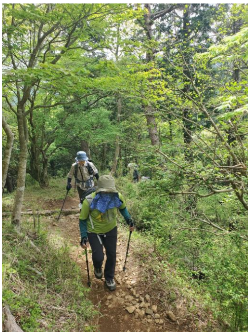
いいペースで歩き始めた