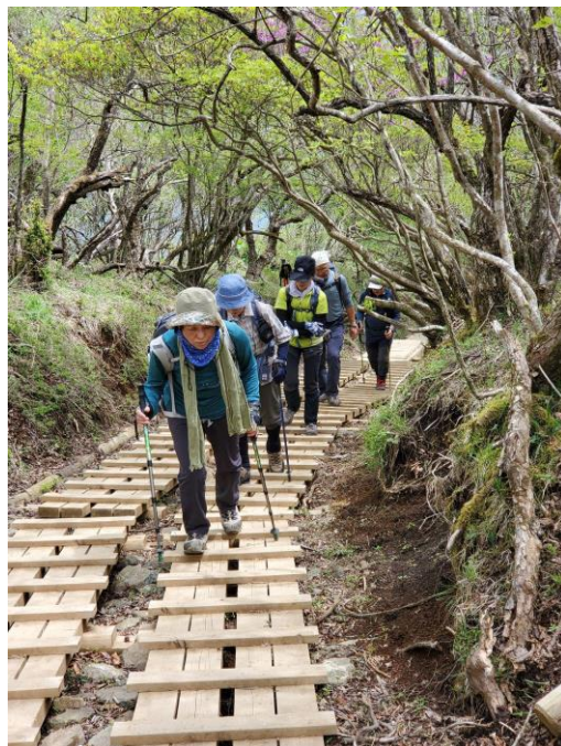
が、だんだん疲れが、、、