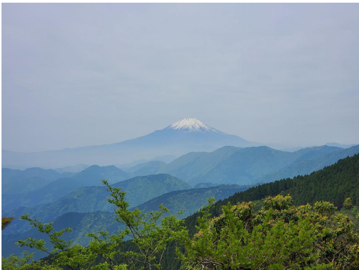
二ノ塔からの富士山は少しガスっていたお陰で正に絶景