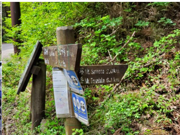
舗装路歩きを終えてようやく山歩き開始