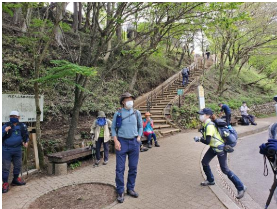
ストレッチなどして準備万端

平日のヤビツ峠行きバスの始発は8：25と遅い。平日だと高をくくっていたが、臨時便2台が出るほどの混雑ぶりだった。