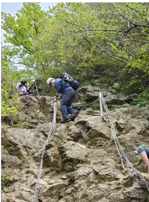
烏尾から新大日間のいくつかの鎖場はとても楽しい