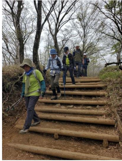
後は馬鹿尾根を黙々と、