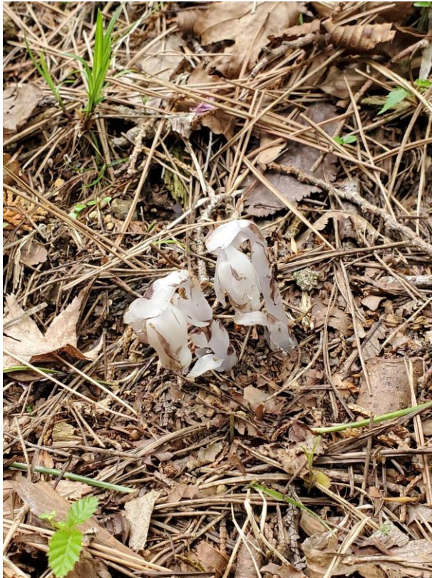
下山路に銀竜草？初めてだった。