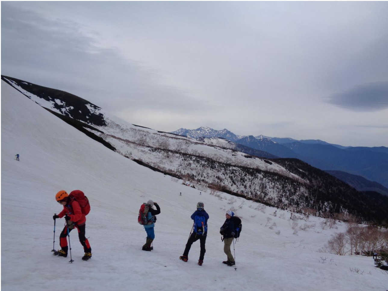
大雪渓では山頂からの滑降はあきらめて アイスパーンの雪面をガリガリと降ってくる人も