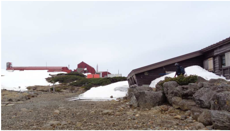
冷い強風に吹かれてへろへろ状態で肩ノ小屋に