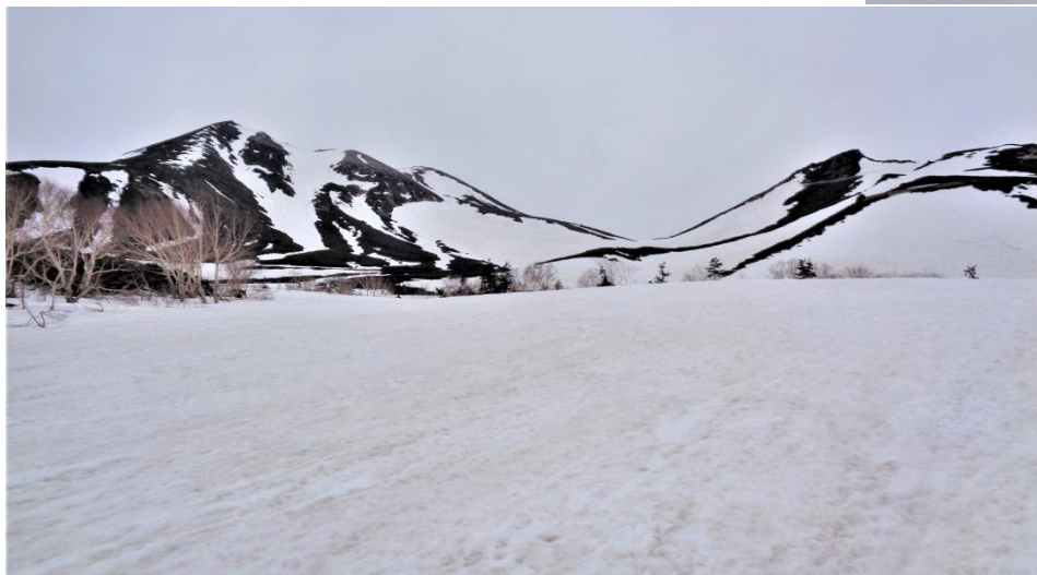
こちらはのんびりと ザクザクとアイゼンを効かせて 誰もいなくなった雪渓を降る