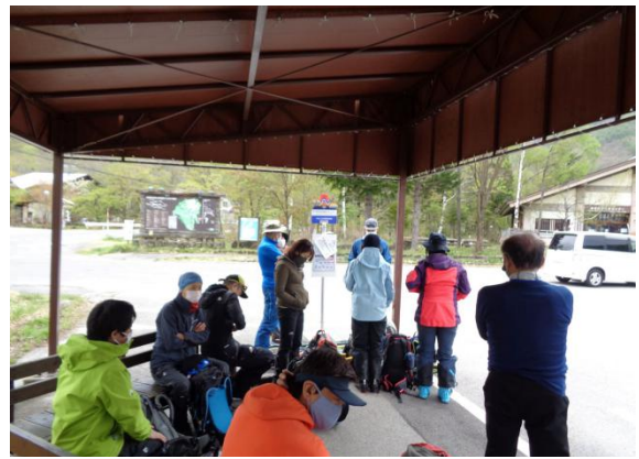
スキーヤー、ボーダー、登山者、一般客で賑わう 位ヶ原山荘終点で下車