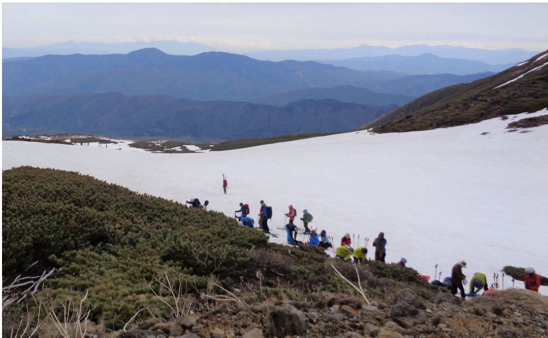
出発が遅れてしまい 最終バス 15:16 に 乗るため、ここで タイムアウト 山頂へは行けず