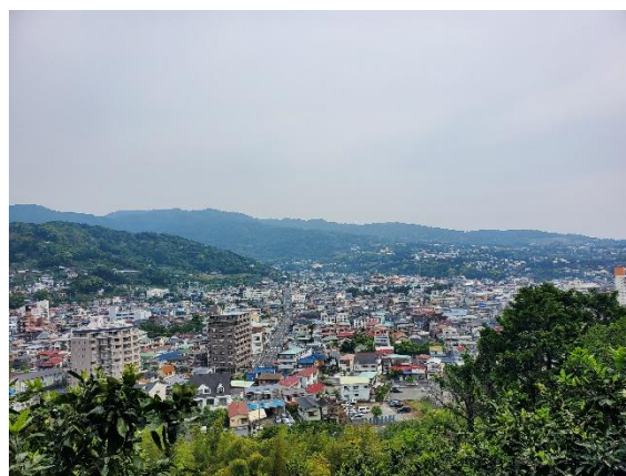
湯河原の町を右に見ながら入山