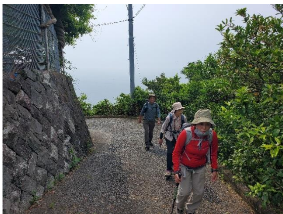
長く続く登り舗装路が結構きつい