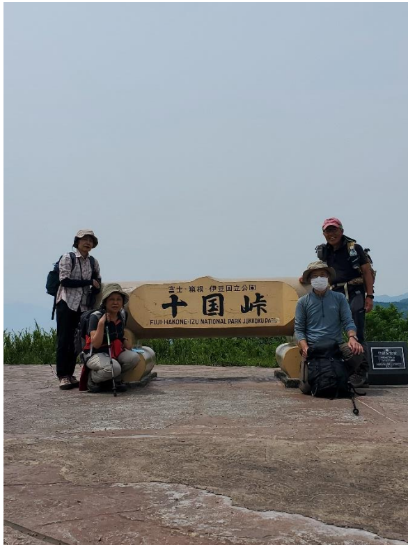
けど、結局富士山は拝めずじまい