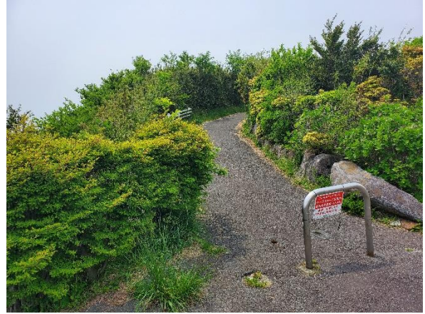
やっと十国峠へのアプローチウエイ