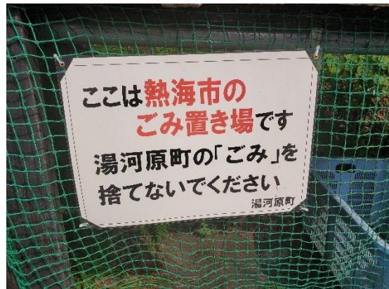
まさに静岡と神奈川の境を歩いた