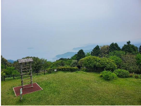
姫の沢公園で昼食を摂り、