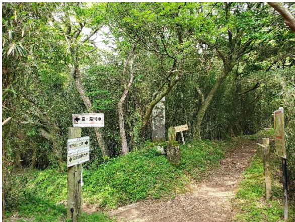
来た道に戻ってここから湯河原へ