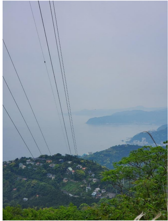
曇りだったせいで、幻想的な伊豆半島東部