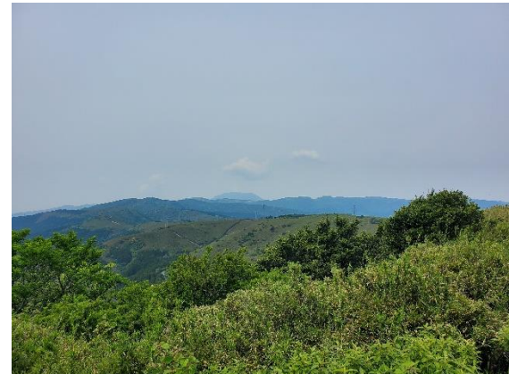
神山？までの視界だった