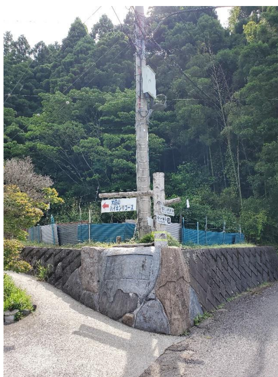
車道に別れを告げて登山道へ