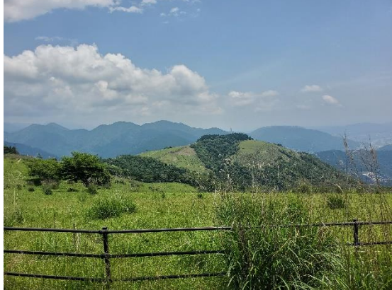
コースを外れて牧場方面に向かった