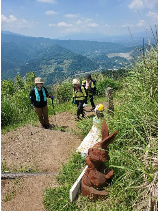
ようやく634標識に到着