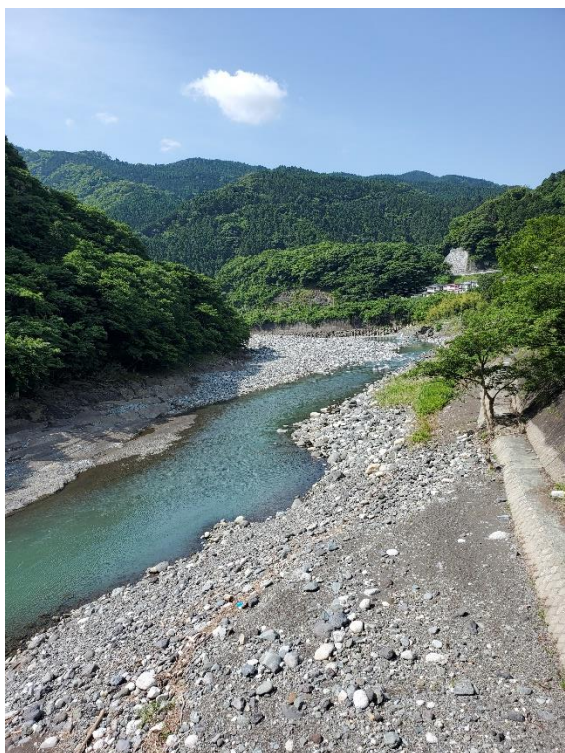
酒匂川を渡って出発

下山ルートミスってしまい、まきば館からずっと車道を歩くことになってしまった。ただ、同行してくれたメンバーのお陰で色んな花に寄り道をしながら楽しい下山になった。素晴らしい紅葉道であることもわかったので、今秋また行きたいと思う。