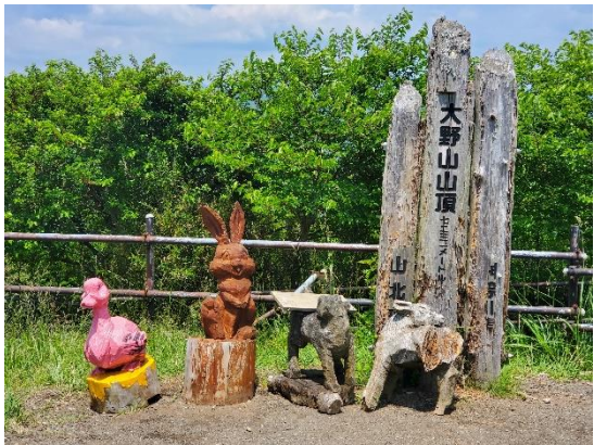
大野山頂上 ここでしばし休憩