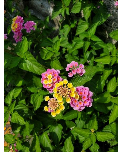
途中、いろんな花を教えてもらったりGoogleLensで調べたり。左から「トリアシショウマ」「センダン」「ランタナ」