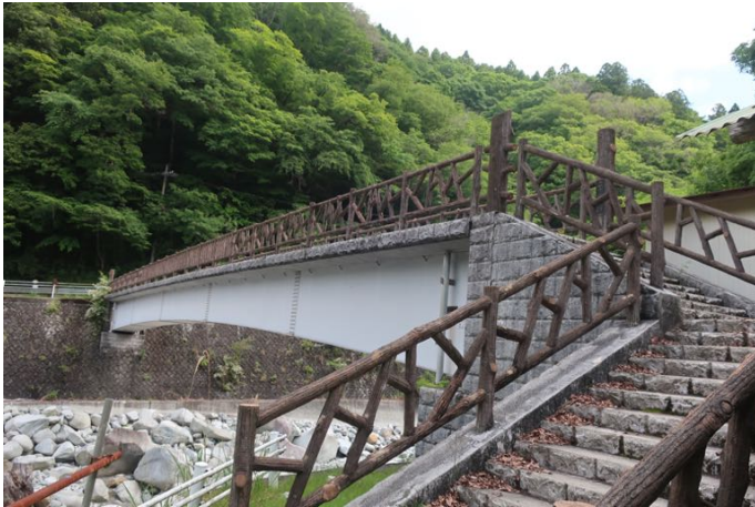
箒沢公園橋を渡って出発