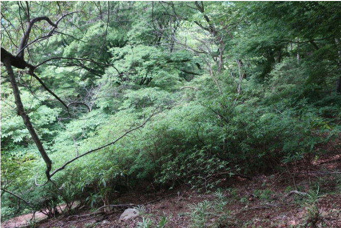
つつじ新道のミツマタ群生地も新緑に覆われ、つつじ類の花も無し、緑一色