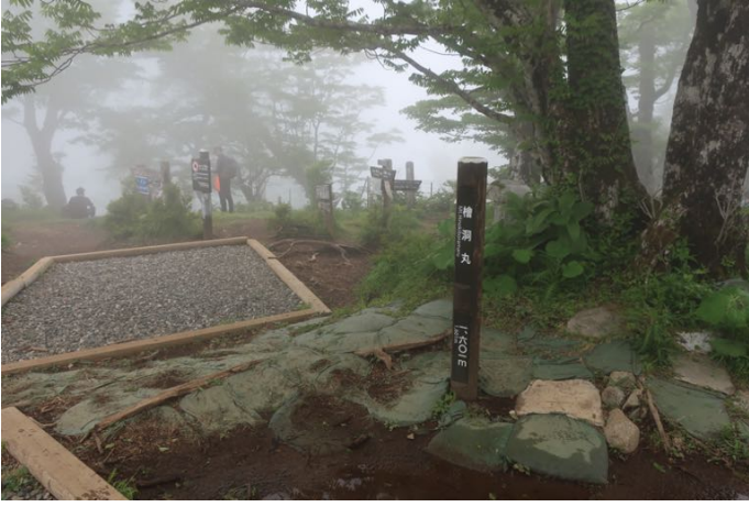
山頂到着 山頂は雲の中、展望無し