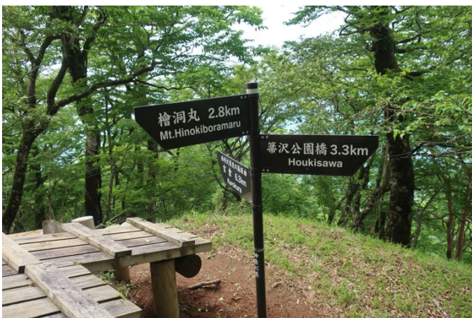
県民の森分岐 石棚山稜に乗りました