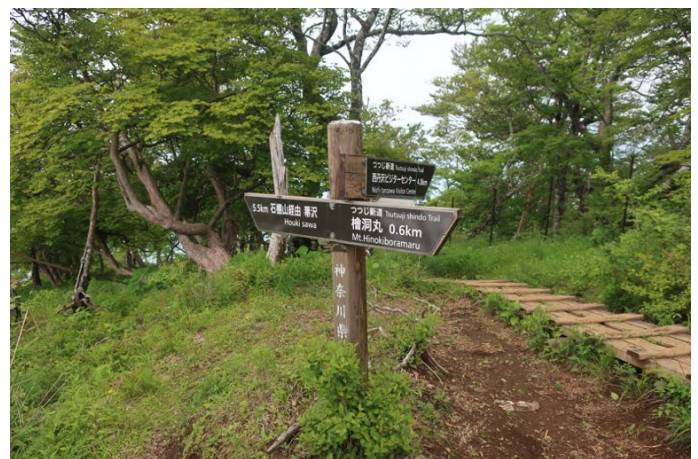
石棚山稜分岐 帰りはつつじ新道方面に降ります