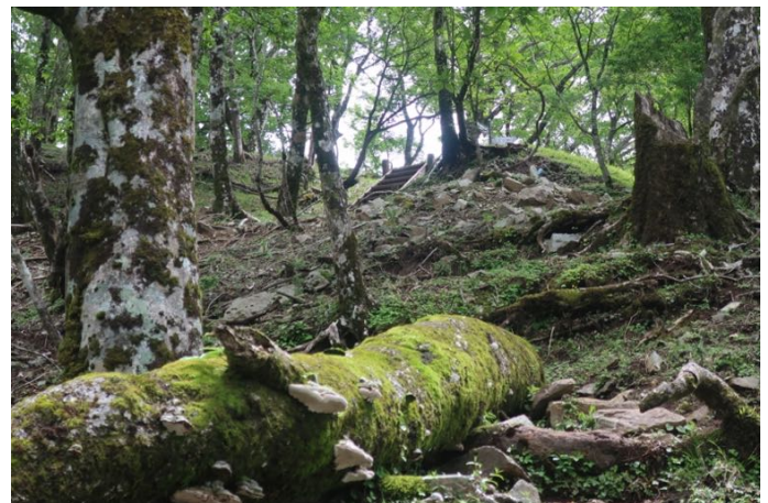
やっと稜線が見えた！