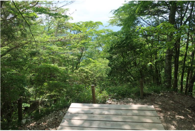
展望園地も展望無し