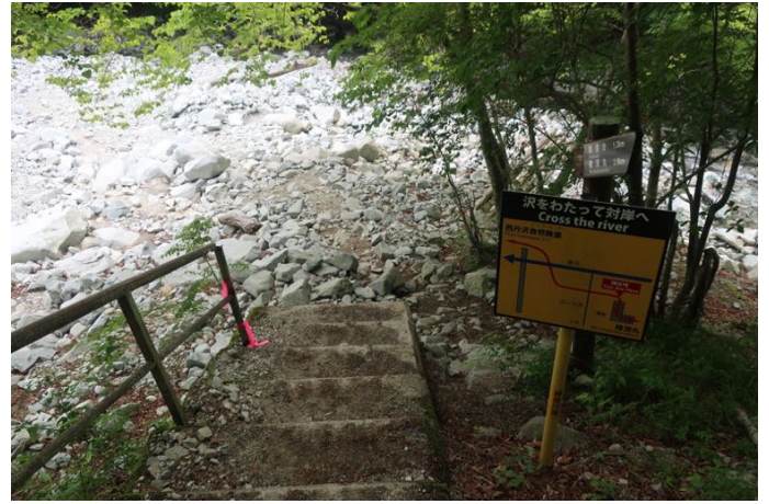
ゴウラ沢出合に到着