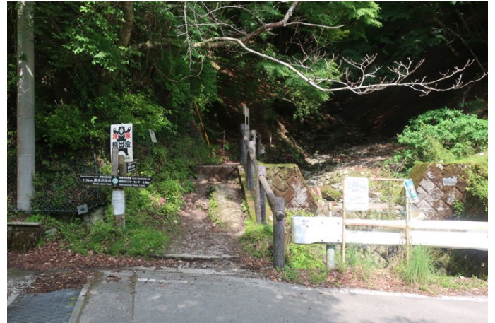
つつじ新道登山口 無事下山