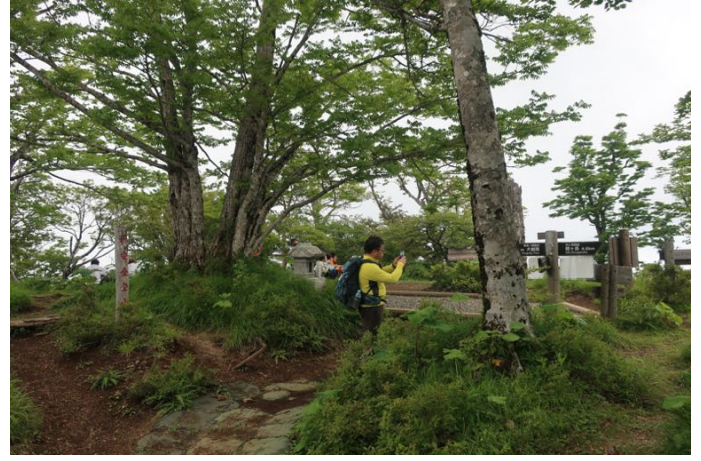
昼食後出発時まで山頂は雲の中でした