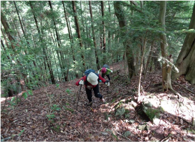
160mの急登をこなして