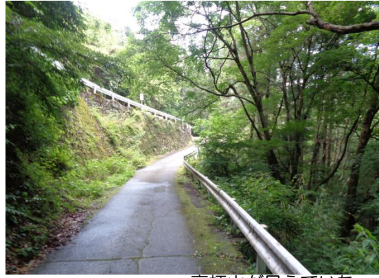
高柄山が見えていた