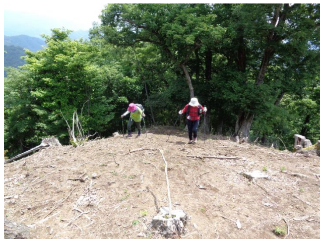
明るい伐採地の先が