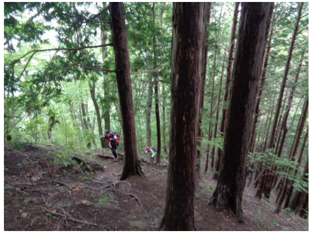
4回アップダウンを繰り返してようやく最後のピーク、高柄山へ