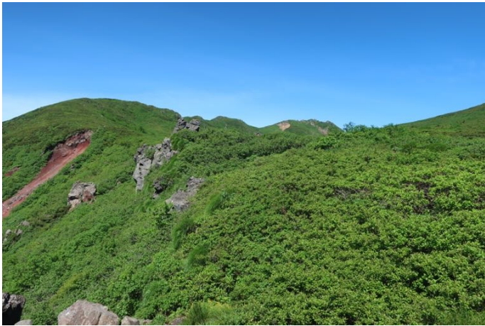
七合目から登り方面を見る まだ、山頂は見えない あの上が八合目