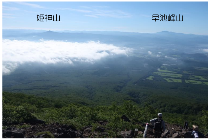
五合目付近から東南方向の展望