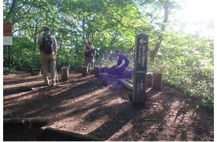
一合目 ここまでが長い