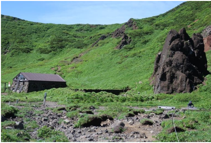
不動平避難小屋前のベンチで昼食大休止