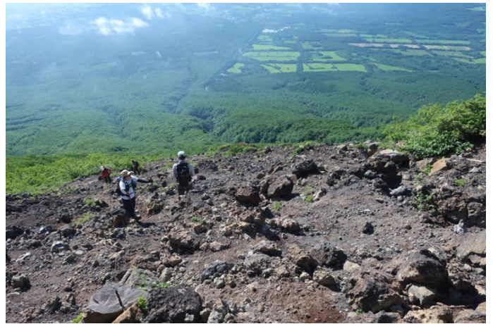
五合目の展望 日差しがとても暑いです 登りは展望の良い旧道 (Panoramic Trail) を使いました