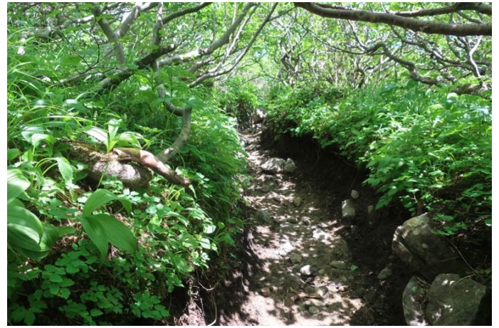
下りは日差しがきついで 新道 (Forest Trail) を使いました でも、逆に風が無いのも辛いです