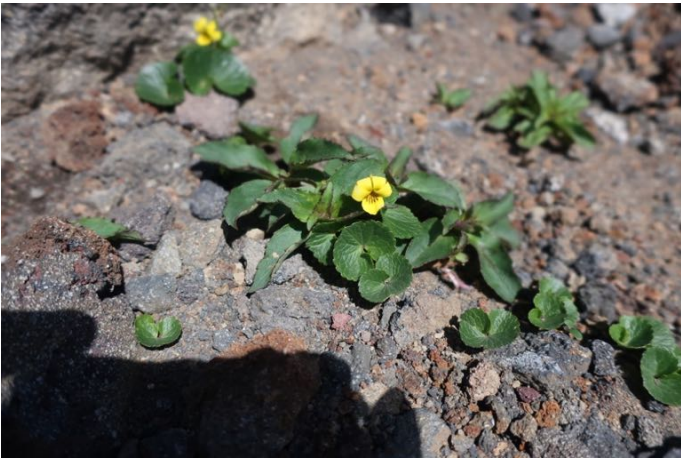
お釜のサレ場にはタカネスミレの群生