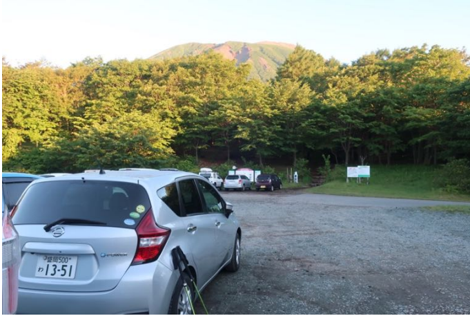
馬返し登山口駐車場に早朝にレンタカーで到着