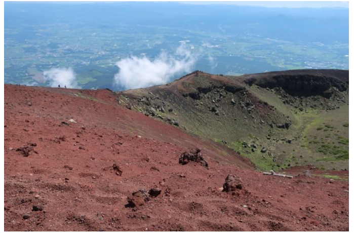
下りは右回りでお鉢を回ります