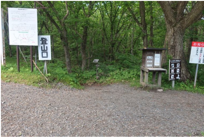
登山口に無事到着

暑すぎて、二合目付近で熱射病で倒れている人がいました。地元の方が救急隊を呼んで、ヘリコプターで救助されました。登山道は25℃位、山頂で19℃、下界は33℃でした。