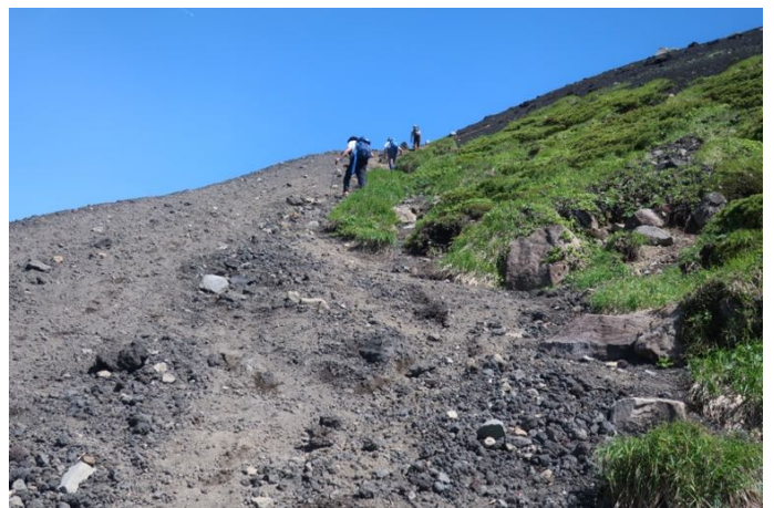
山頂まで近い左方向の道 ザレ場の急登です（富士山みたい）