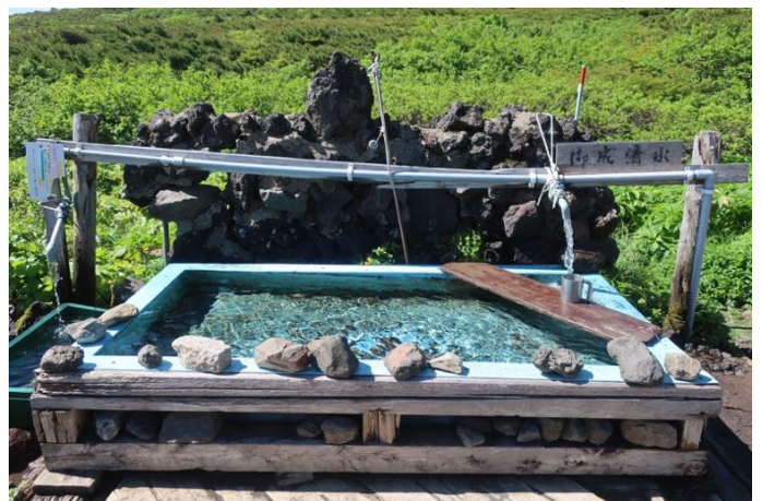
御成清水 冷たくて美味しい！ 暑いけど、生き返ります