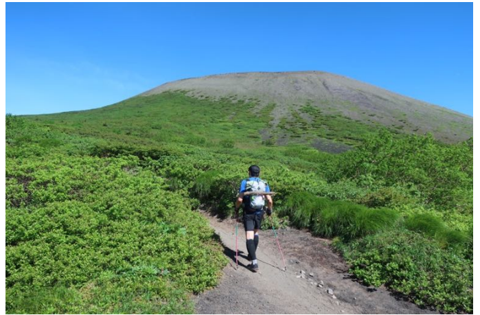
もうすぐ八合目 山頂が見えた