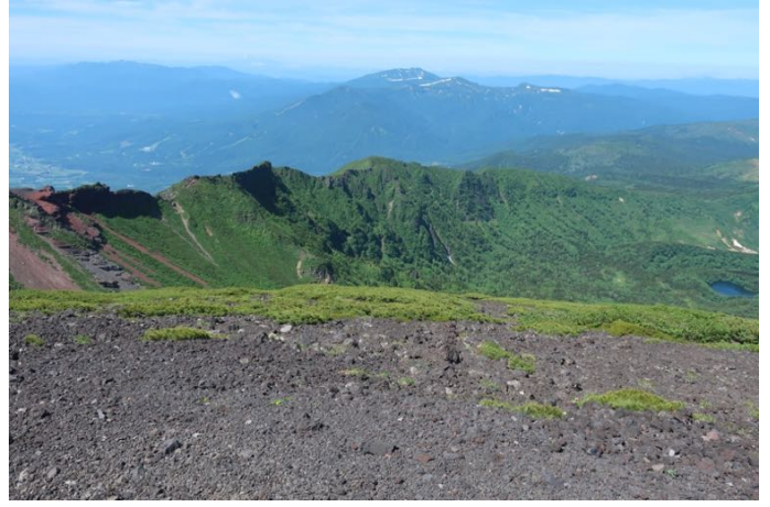
振り返ると鬼ヶ城方面の尾根が見えます