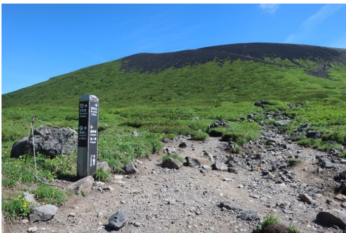
不動平 いよいよ山頂への急登