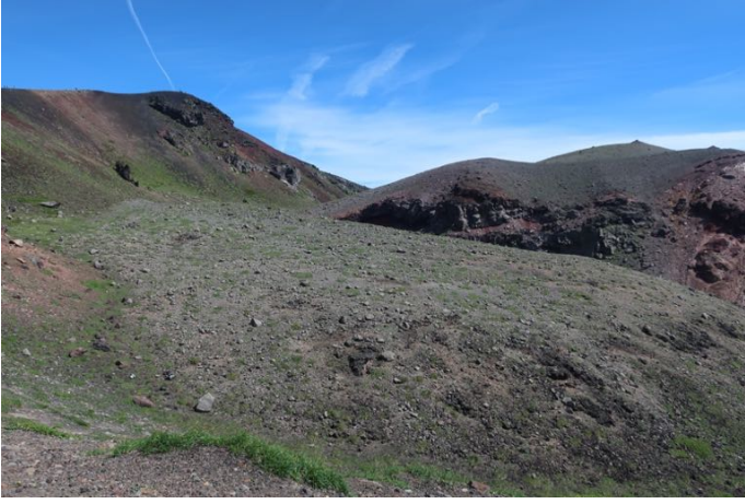
山頂が見えた！ お釜の淵に上がりました