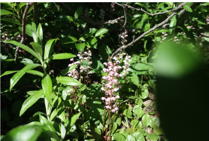
ベニバナイチヤクソウ