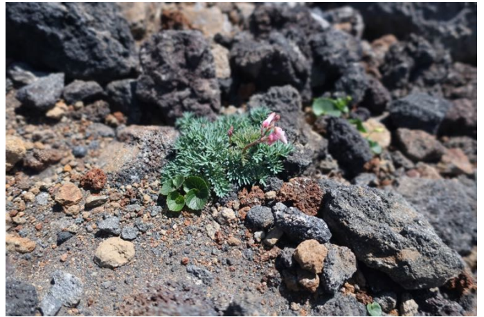
コマクサは葉はあちこち茂ってますが花はまだ早いようで1輪だけ蕾を発見しました