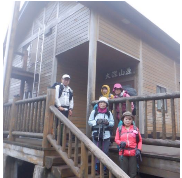
翌日は早朝に出発！