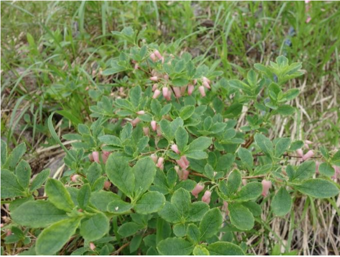
ウラジロヨウラクツツジ