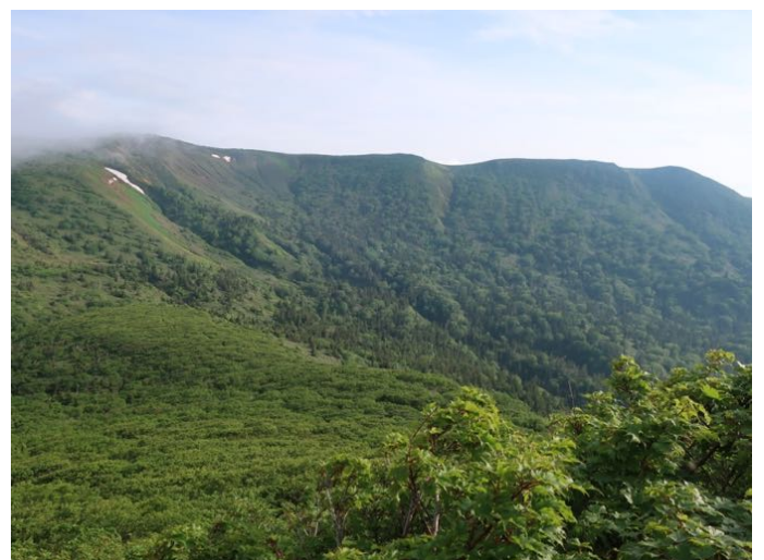
振り返ると大深岳から東方に伸びる源太ヶ岳の稜線