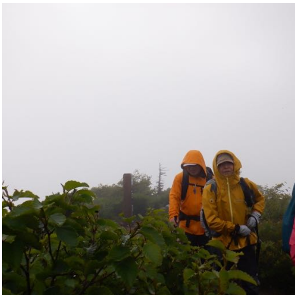
嶮岨森のピークでは雷鳴轟き急いで通過