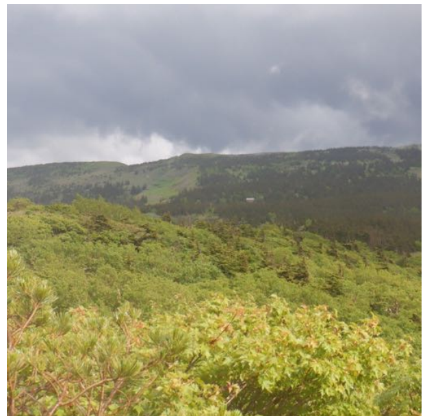
大深山荘が見えました！