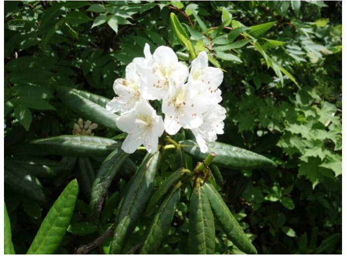
ハクサンシャクナゲ