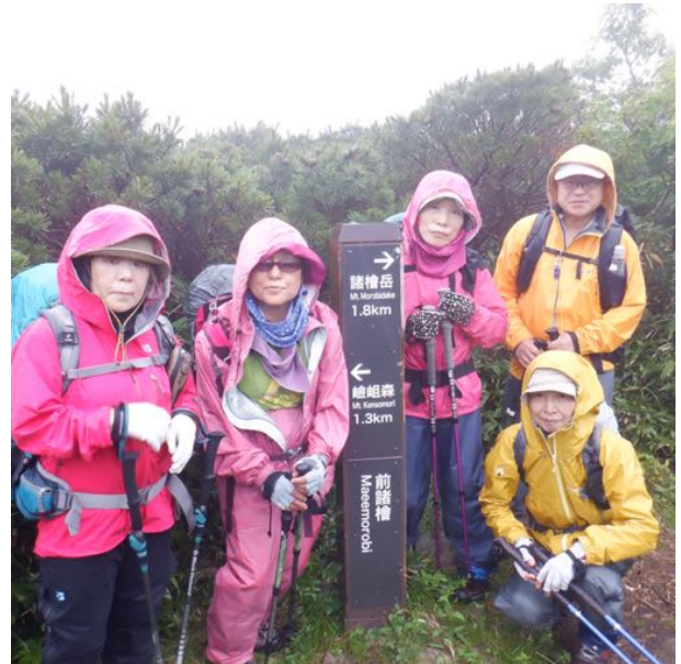
前諸岳 ゴロゴロ雷が鳴っています