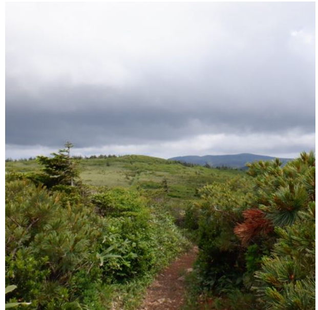
樹林帯を抜け笹原になります