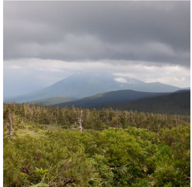
南方に聳える秋田駒ヶ岳 暗雲が出てきました