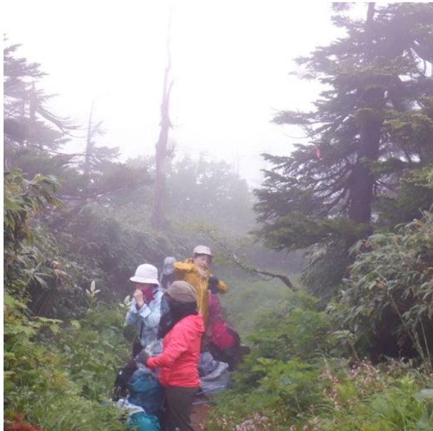
霧の中でしたが、すぐに暑くなり雨具を脱ぎます