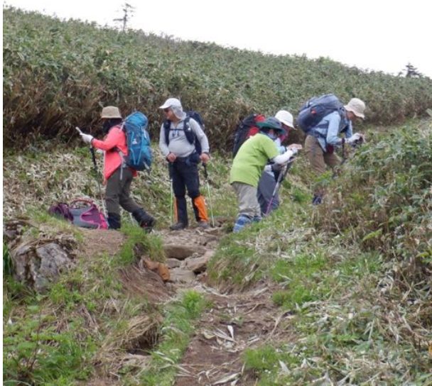
お花の撮影に余念がありません