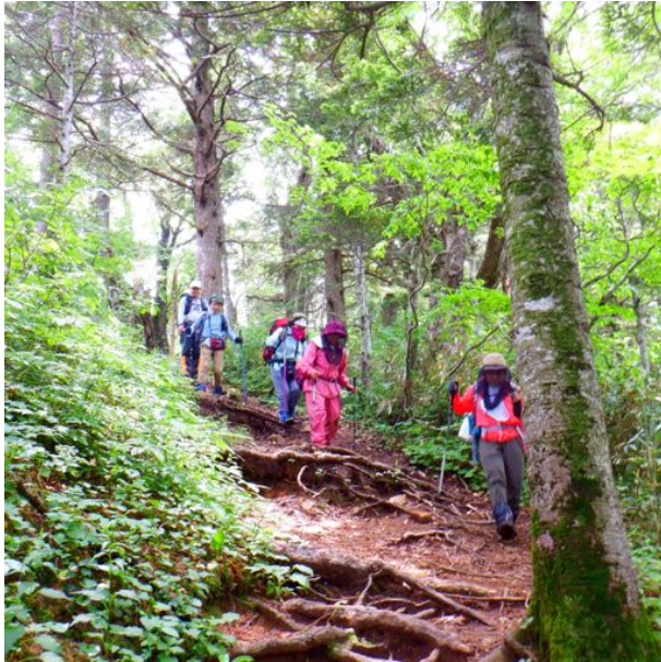
ひたすら下ります