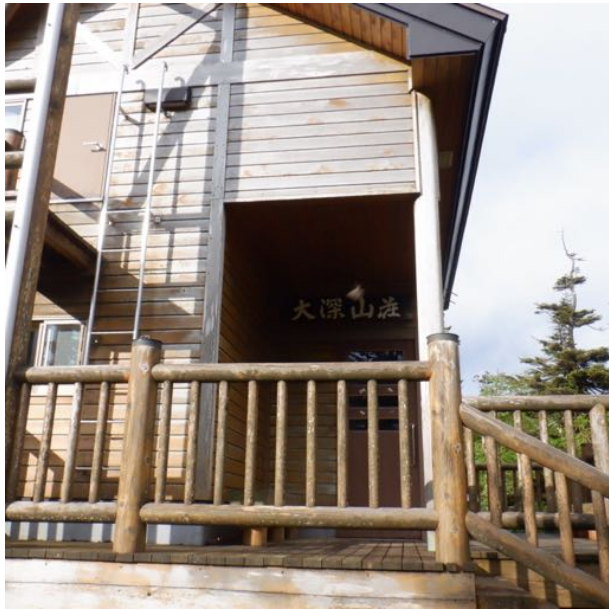
今夜の宿の大深山荘に到着 雷雨も上がりました