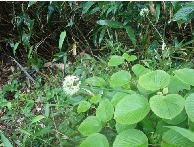
ギョウジャニンニク