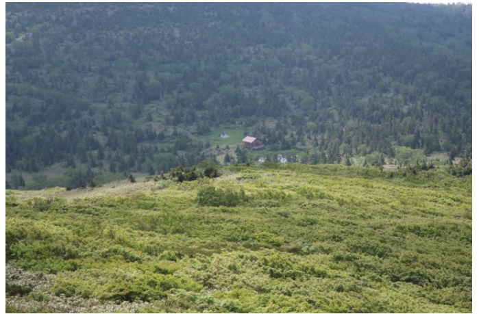
三ツ石避難小屋へ下ります