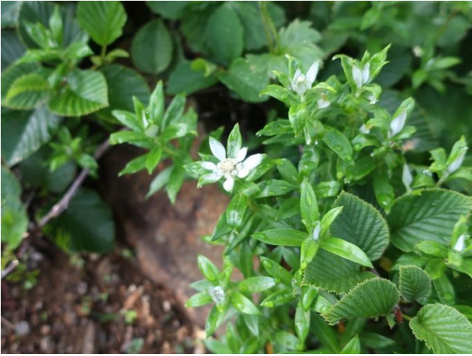
ミネウスユキソウ