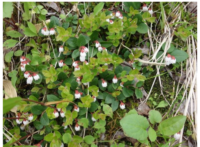
アカモノ（イワハゼ）