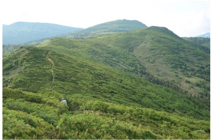
三ツ石山の山頂の岩が見えました