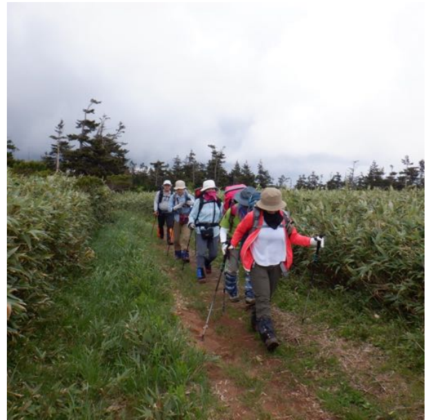
足取り軽く 曇ってきました