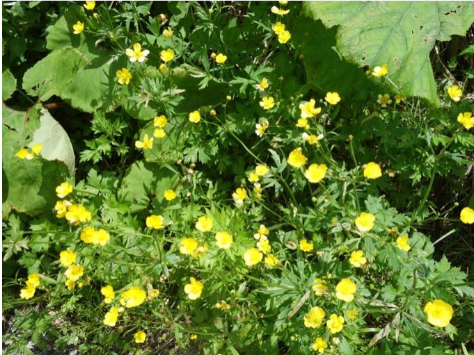
ミヤマキンポウゲ