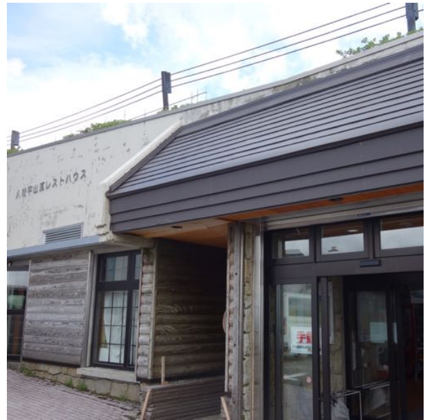
八幡平頂上バス停に到着し登山開始