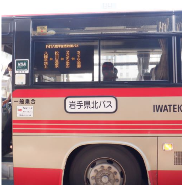
盛岡駅前からバスで出発