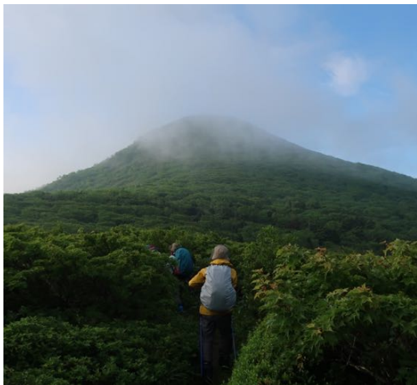
前方を目指す小畚山