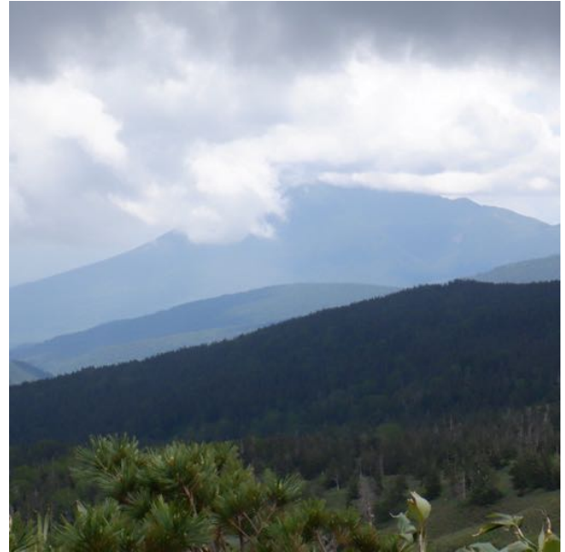
岩手山が良く見えます