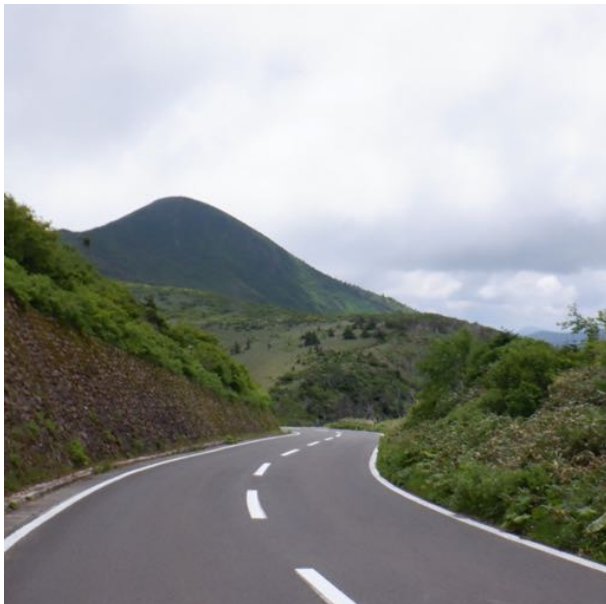
これから目指す畚（もっこ）岳