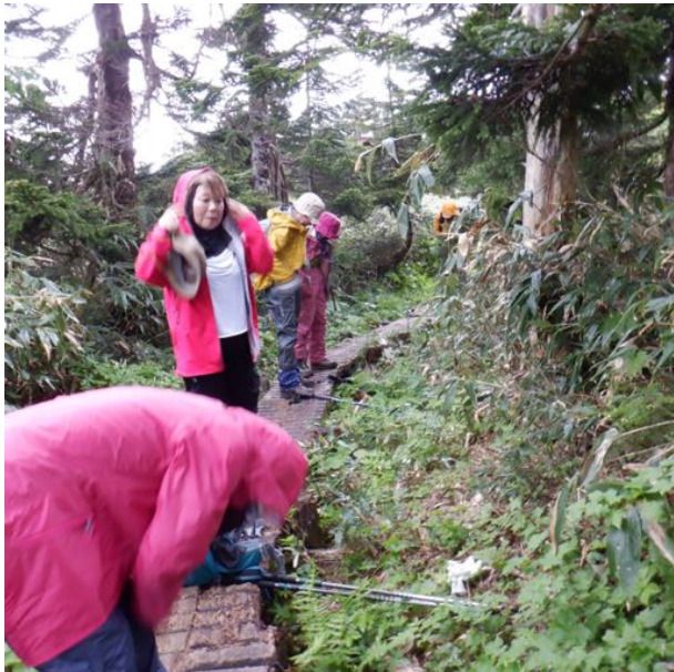
遂に雨が降ってきました 合羽装着