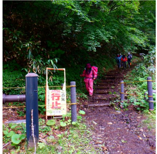
三ツ石山登山口（松川温泉）に到着！