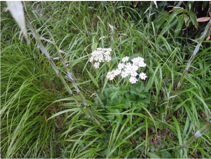
ハクサンボウフウ