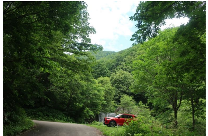
青空の中、緑茂る林道を歩く