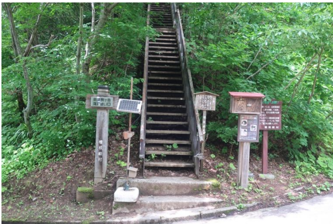
滝沢登山口 ここからいきなり急登が始まる