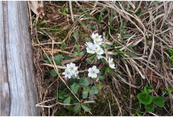
ミツバオウレンの群生 イワイチョウも沢山咲いている