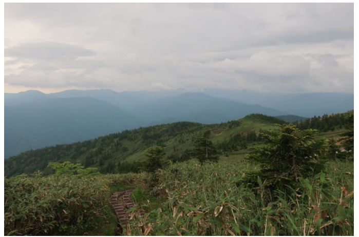
駒ヶ岳からの下り、南方を見る 燧ヶ岳は雲で良く分からない

この後、駒の小屋に戻ってゆっくり朝食を取っていると雨が降ってきた。 小雨の中ボチボチ下って行くと少しずつ雨は強くなってきたが、それでも結構な数の人が登ってきた。15人以上はすれ違った。ガッツあるなあ。