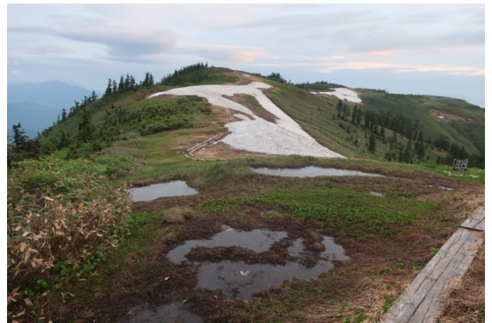
駒ヶ岳を巻いて、向こうに見える二つ目のピーク の先にハクサンコザクラの群落があるらしい