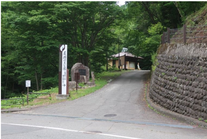
駒ヶ岳登山口 (バス停)