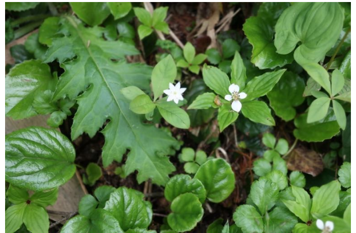
ツマトリソウ(左)とゴゼンタチバナ(右)