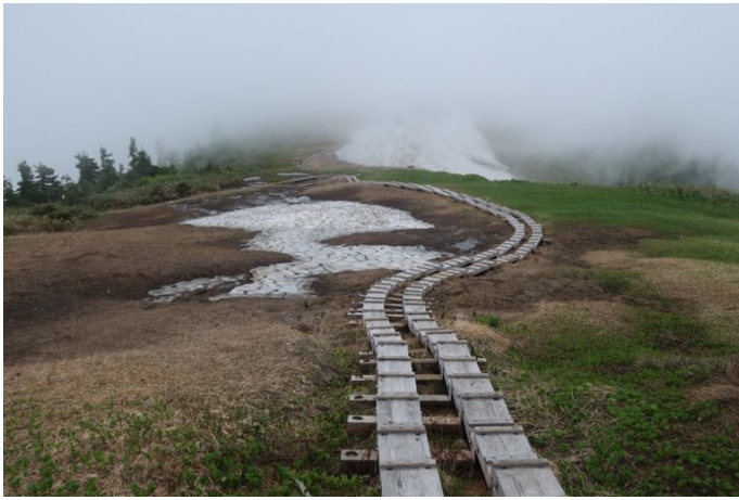
中門岳方面に下る