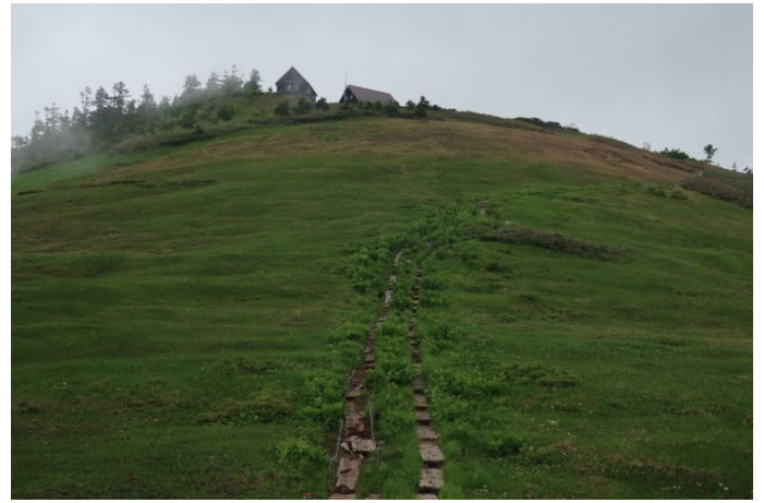
ようやく駒の小屋が見えた！