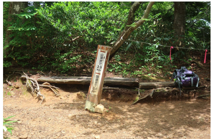
水場 中間地点 24℃程度の気温で湿度が高く汗だくで登る ここまで花もほとんど無し