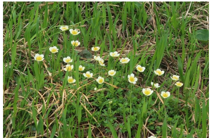
チングルマの群生