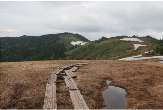
駒ヶ岳方面：途中の雪渓が凍っていて怖かったので時間がかかり、ここで引き返すことにした