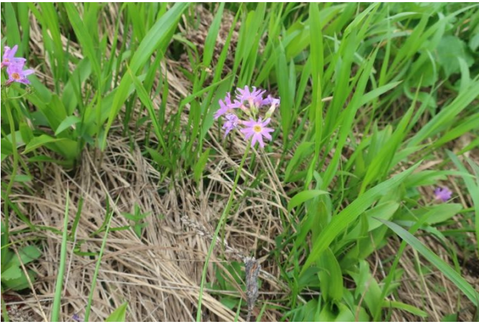
ハクサンコザクラ