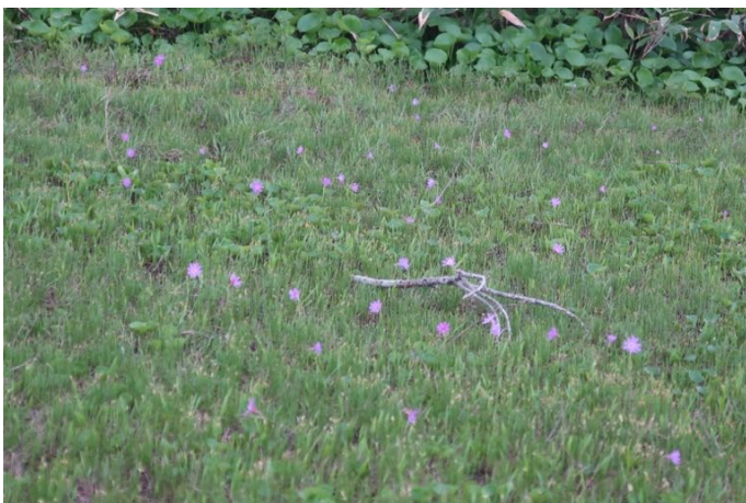
ありましたよ、ハクサンコザクラのお花畑