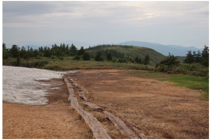
ようやく中門岳が見えた