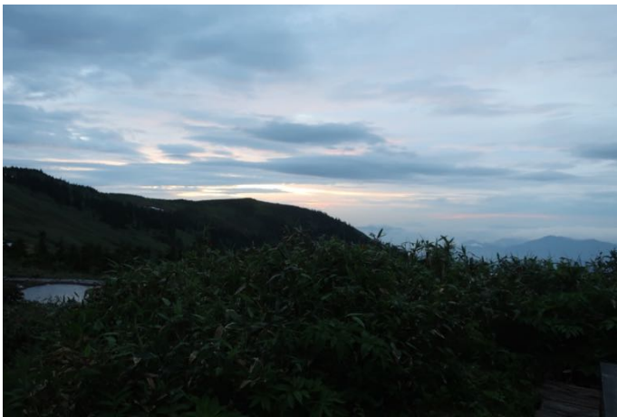
翌朝、ご来光と共に中門岳方面へ散策