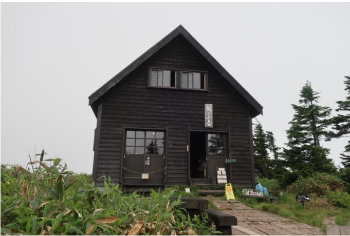
駒の小屋 受付を済ませて、山頂へ