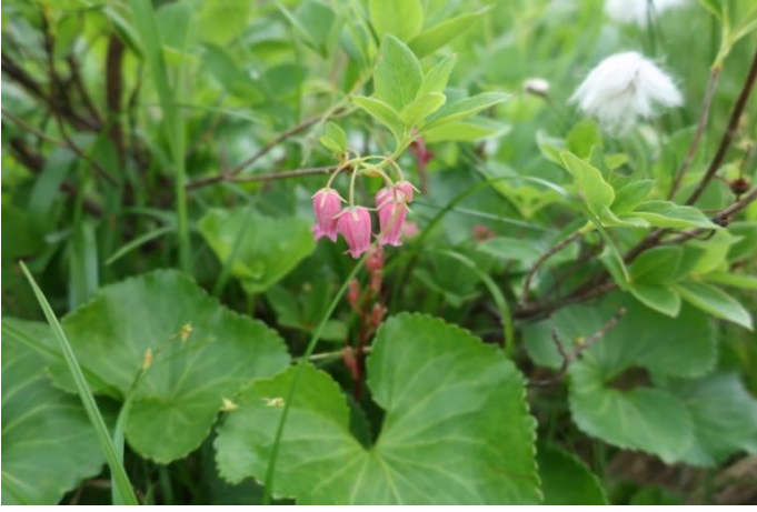
ウラジロヨウラク