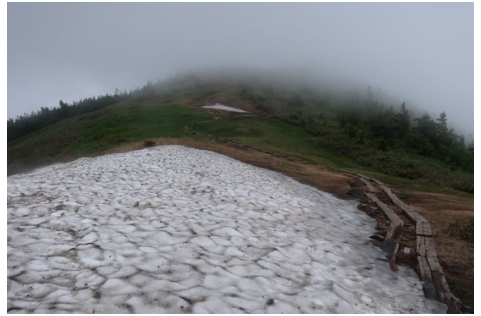
雪渓を一つ越えてみたけど花は無し 本日はこれにて小屋に戻る