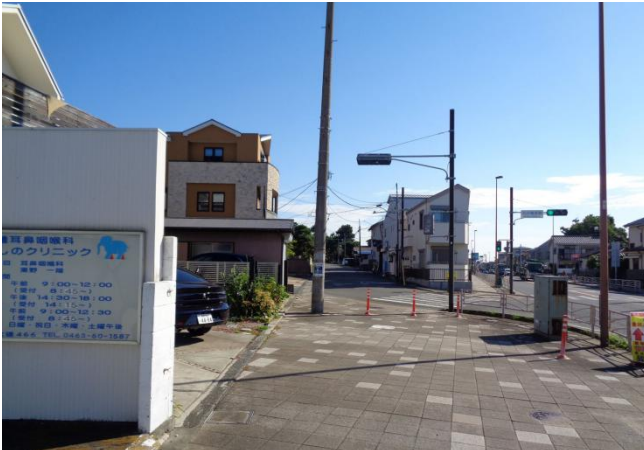
国道から旧東海道、松並木通りへ