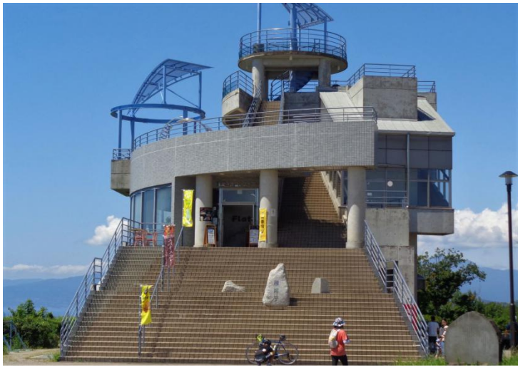
展望台レストハウスには生ビール有、今回はかき氷