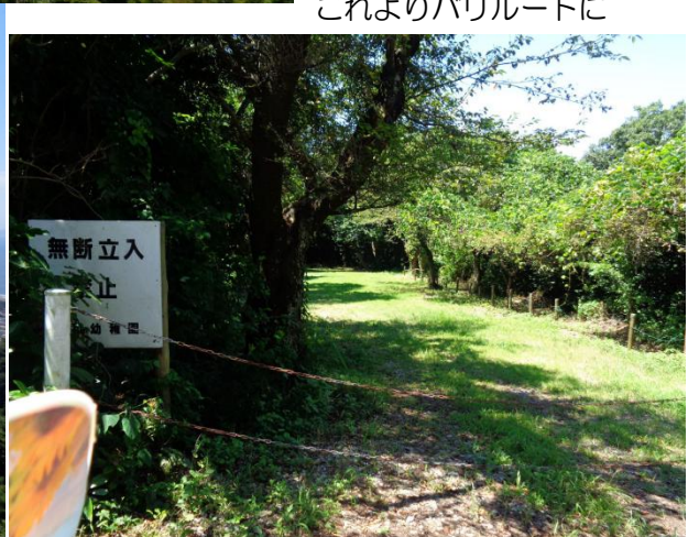
これよりバリルートに