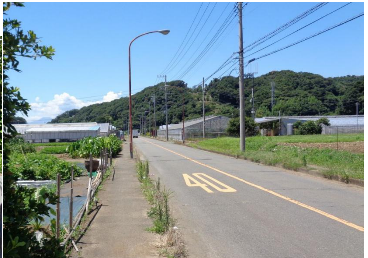
直売所でちょっと品定めして重たいけど結構買い込み