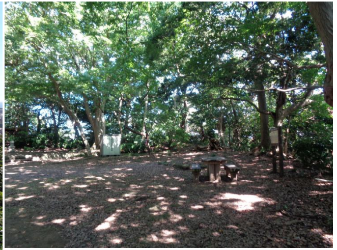
尾根道は木陰で涼しい風が吹き抜けている