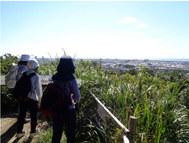
高麗山は山城址 切通しを2カ所抜けて