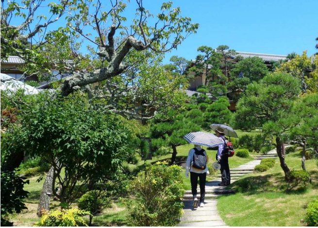
庭園内を一周して