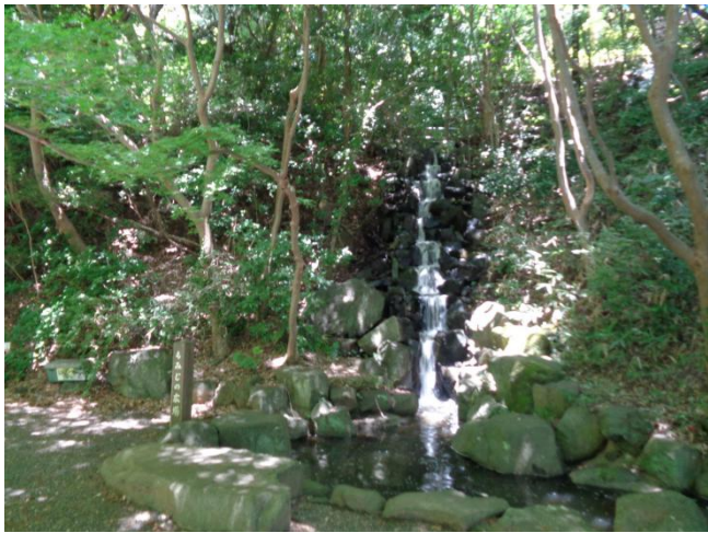
回廊をひと回りして、国道を渡って旧吉田邸散策