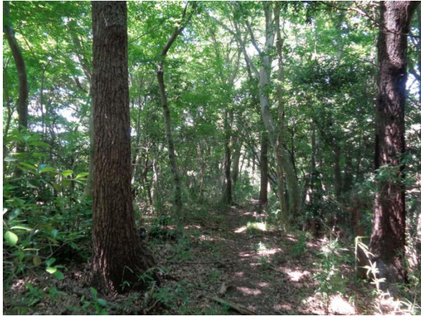
ヒノキ並木道を通して