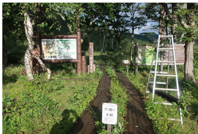
山の鼻 植物研究見本園に入る