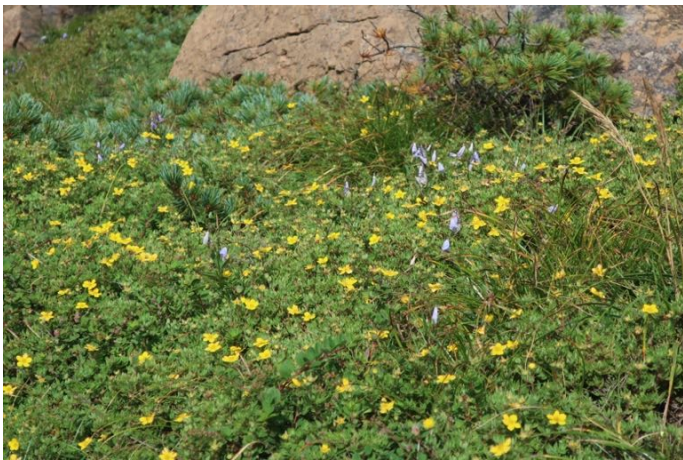
キンロバイの群生 蛇紋岩地帯に特有の植生だそうだ