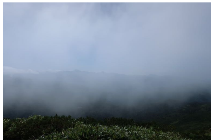
ガスって来てしまった 南東方向 正面に男体山と日光白根山が見えている