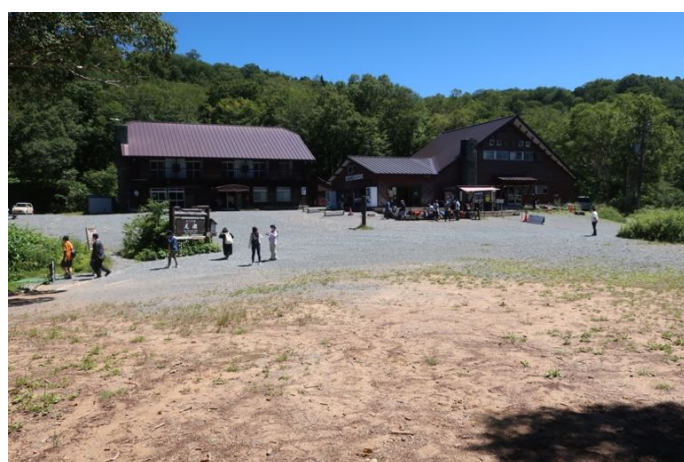
長閑な鳩待峠休憩所前

乗合タクシーで尾瀬戸倉へ下山した。ピークシーズンを過ぎた平日だったので、残念ながら尾瀬ぷらり館の戸倉の湯は休業日だった（8月後半は土日のみ営業）。新型コロナのせいで、どの民宿も日帰り入浴はやっていないのだそうだ。唯一やっていた食堂で昼食をゆっくり取り、13:30発の関越交通バスでバスタ新宿へ戻って帰宅した。