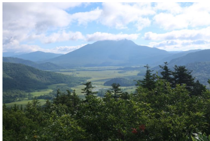
樹林帯を登り、開けたところで尾瀬ヶ原を見る 正面は燧ヶ岳