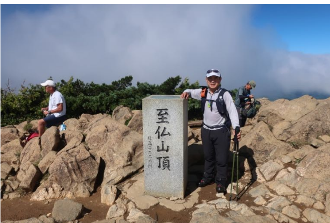
至仏山 山頂に到着