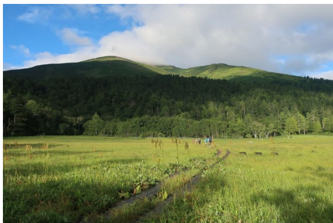
これから登る至仏山の全容 こちらのコースは登りの一方通行である