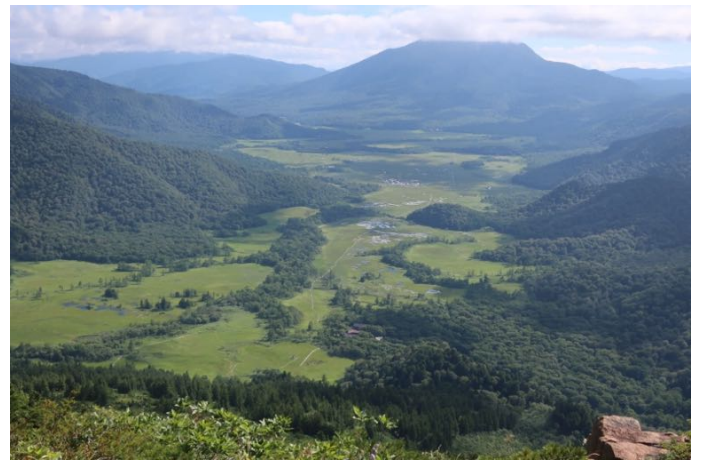
標高約 2100m 尾瀬ヶ原をかなり上から見下ろす感じになった