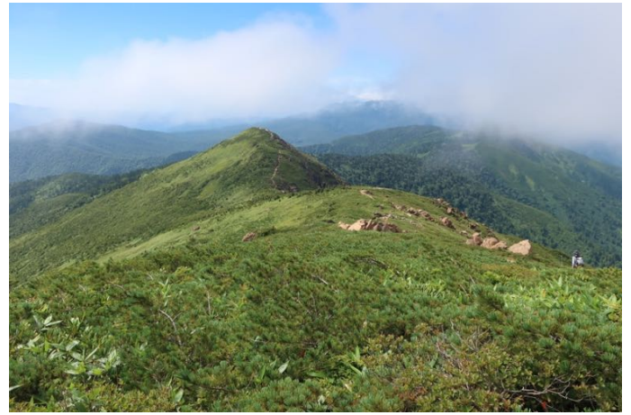
これから降っていく小至仏山方面 滑りやすい蛇紋岩で思いのほか手こずった