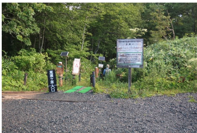
鳩待峠の登山口 尾瀬ヶ原方向へ

関越交通の夜行バスでバスタ新宿を出発し、早朝に尾瀬戸倉に到着。始発のシャトルバスで鳩待峠入りした。気温は18℃。夏は早朝の涼しい時間に出発したい。尾瀬ヶ原の入り口である山の鼻へ降りてから登る、周回コースで至仏山に登った。終日晴れていて、素晴らしい展望に出会えた。