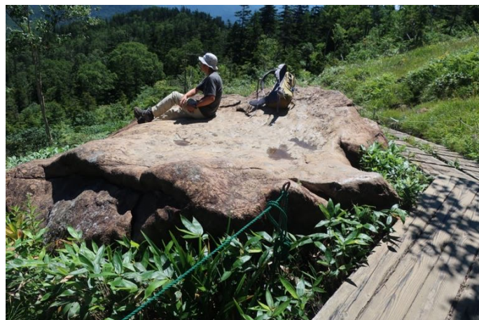
原見岩 ここから下は樹林帯に入る