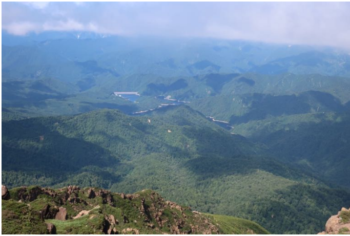
北方はまだ展望がある 中央は奥只見ダム