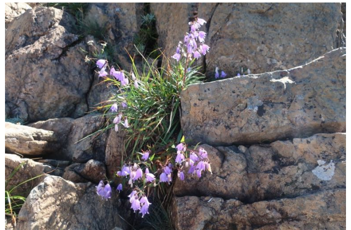
ヒメシャジン 尾瀬では至仏山だけで見られるそうだ