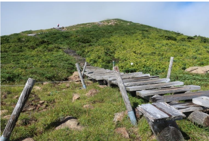
高天ヶ原 やっと勾配が緩くなる