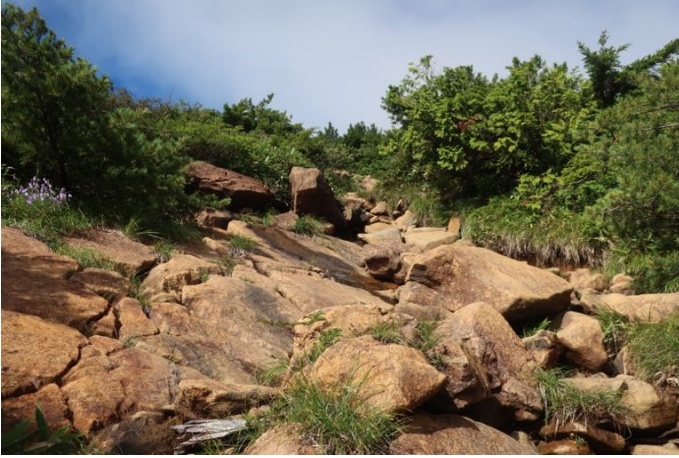
1 時間ほど登ると樹林帯が終わり、岩場に蛇紋岩という岩で、青光りした所は濡れていると滑りやすい