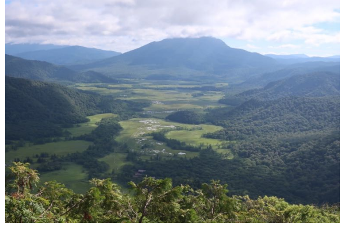
だいぶ登ってきた