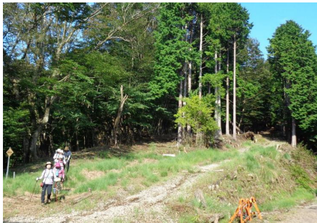
下山して1時間ほどで林道へ降り立つ