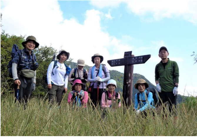
サンショウバラの丘で